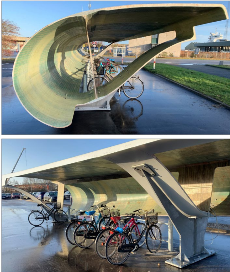
Figura 2 - Bike shed in Aalborg, Denmark