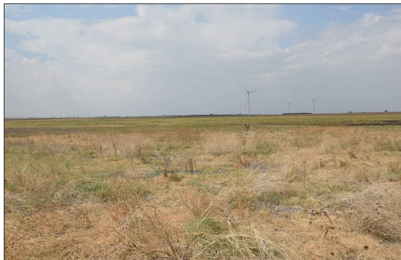
6) Vista dalla Masseria di Santa Maria della Scala (impianto non visibile)