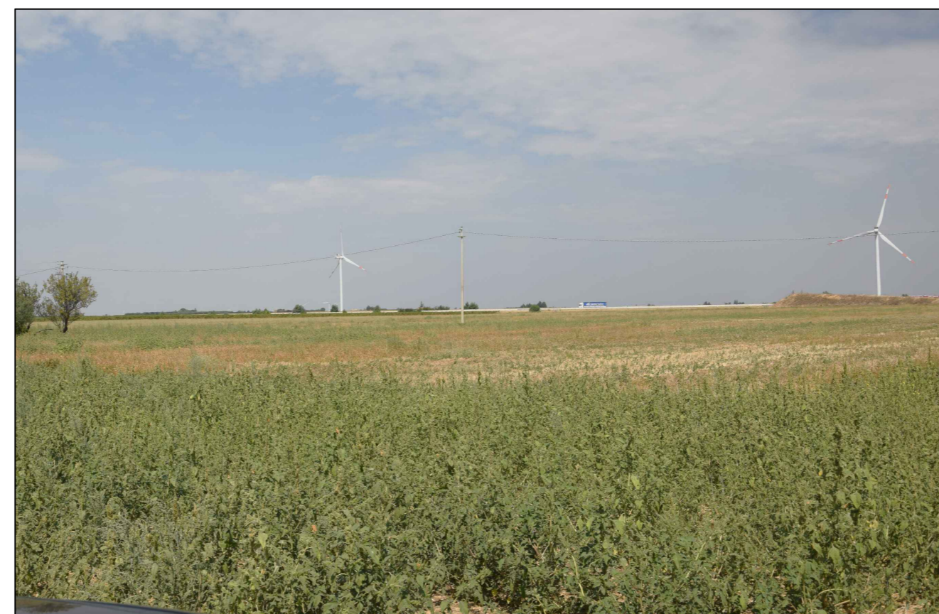
17) Vista dal Lago Capaciotti (impianto non visibile)