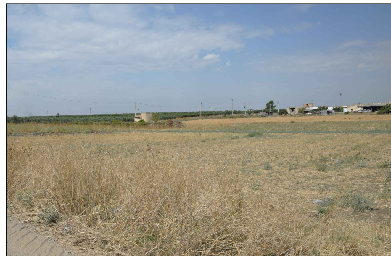
9) Vista dalla Masseria Tre Titoli (impianto non visibile)