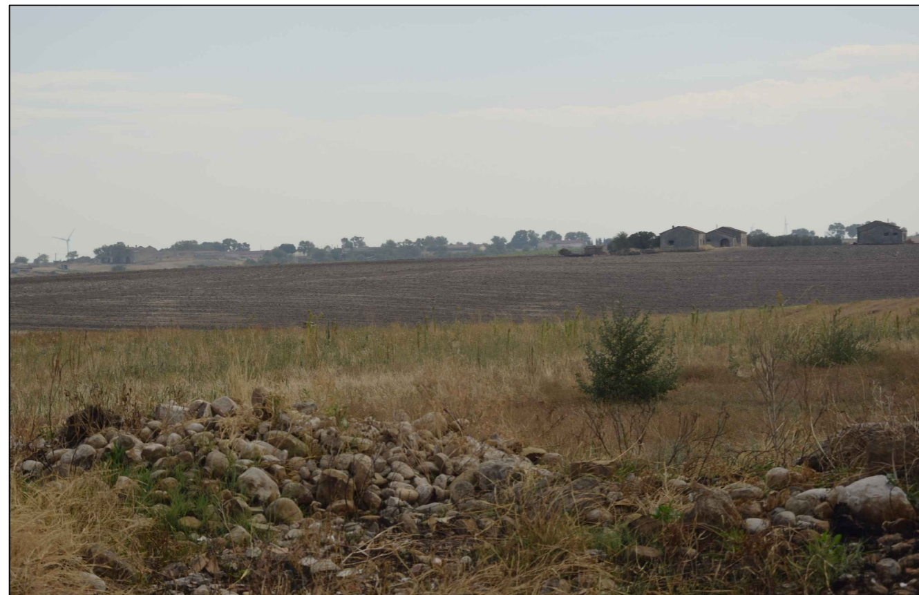
2) Vista dalla Masseria Lagnanello (impianto non visibile)