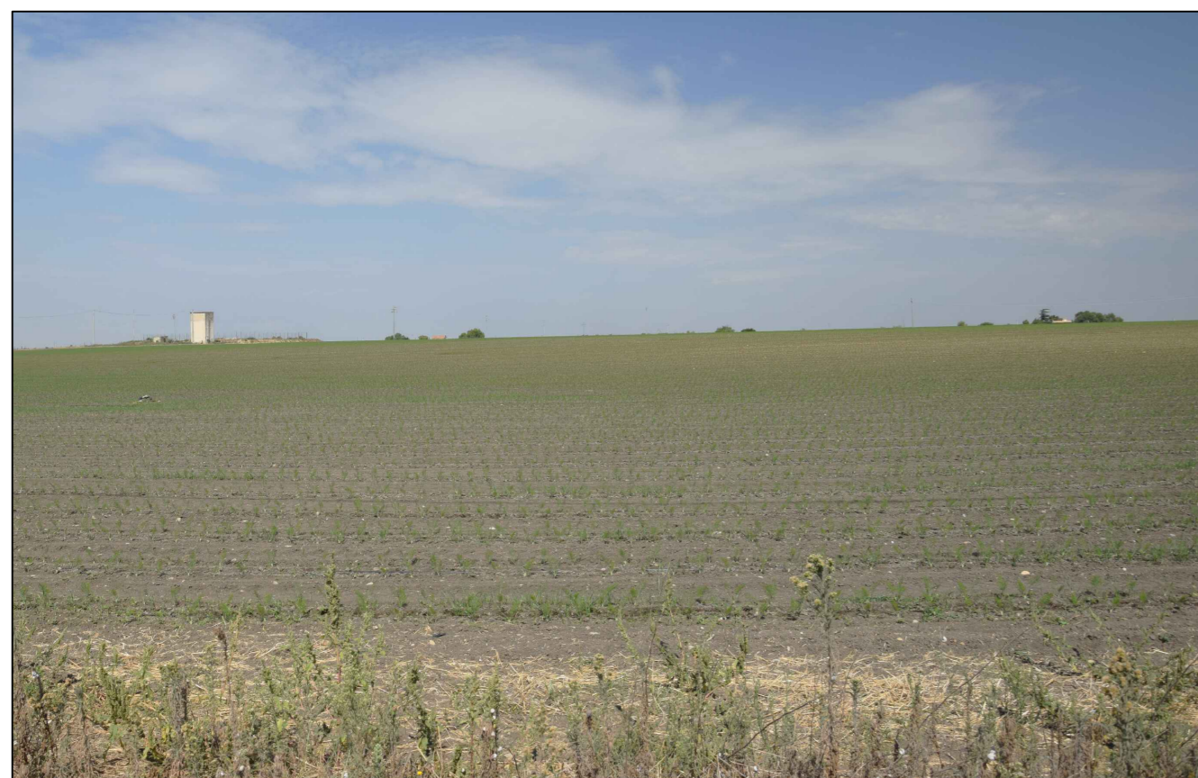
16) Vista dal Tratturo Candela - Montegentile (impianto non visibile)