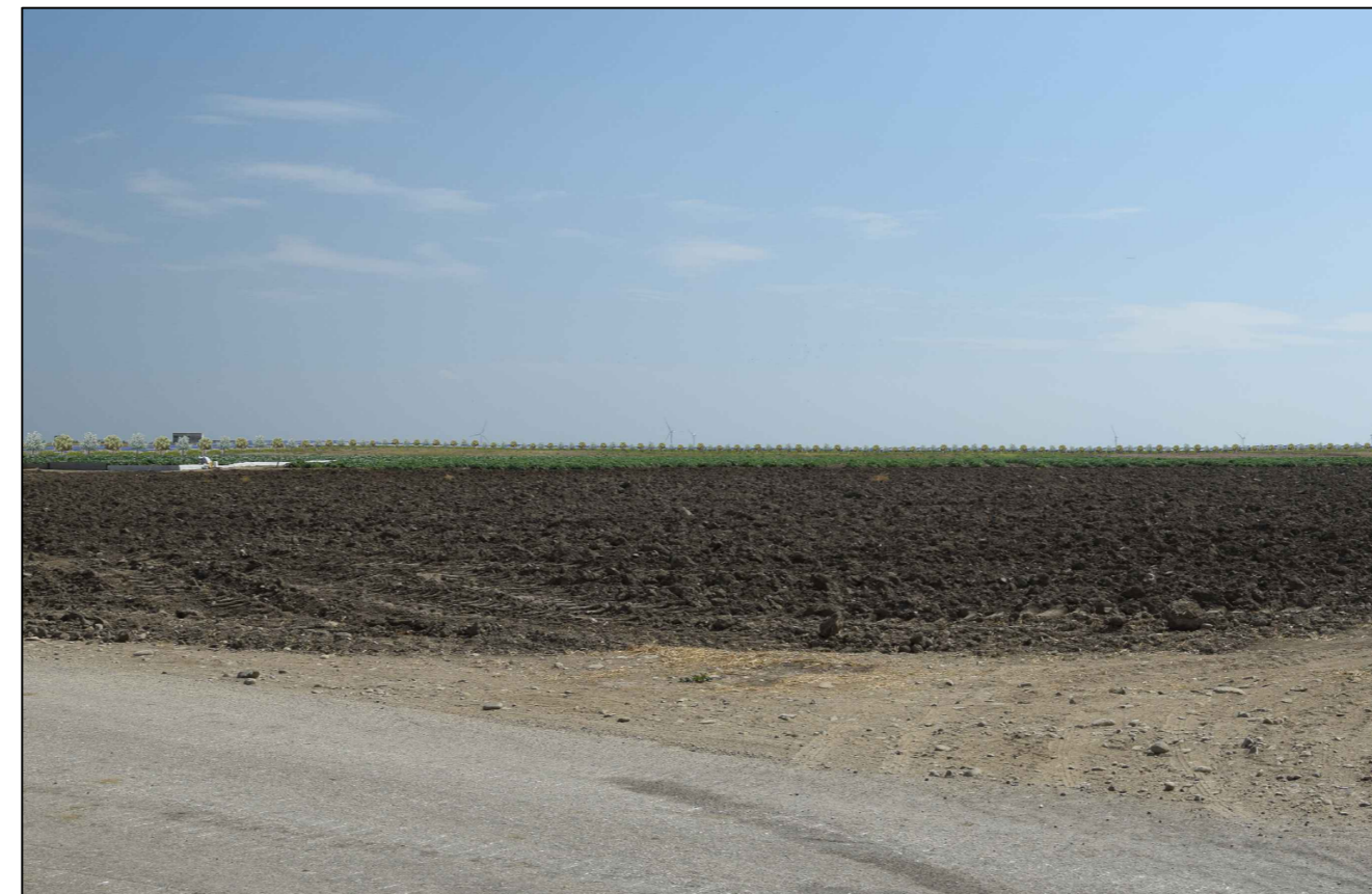
5) Vista dalla Masseria Lagnano (impianto nascosto dalla fascia di mitigazione)