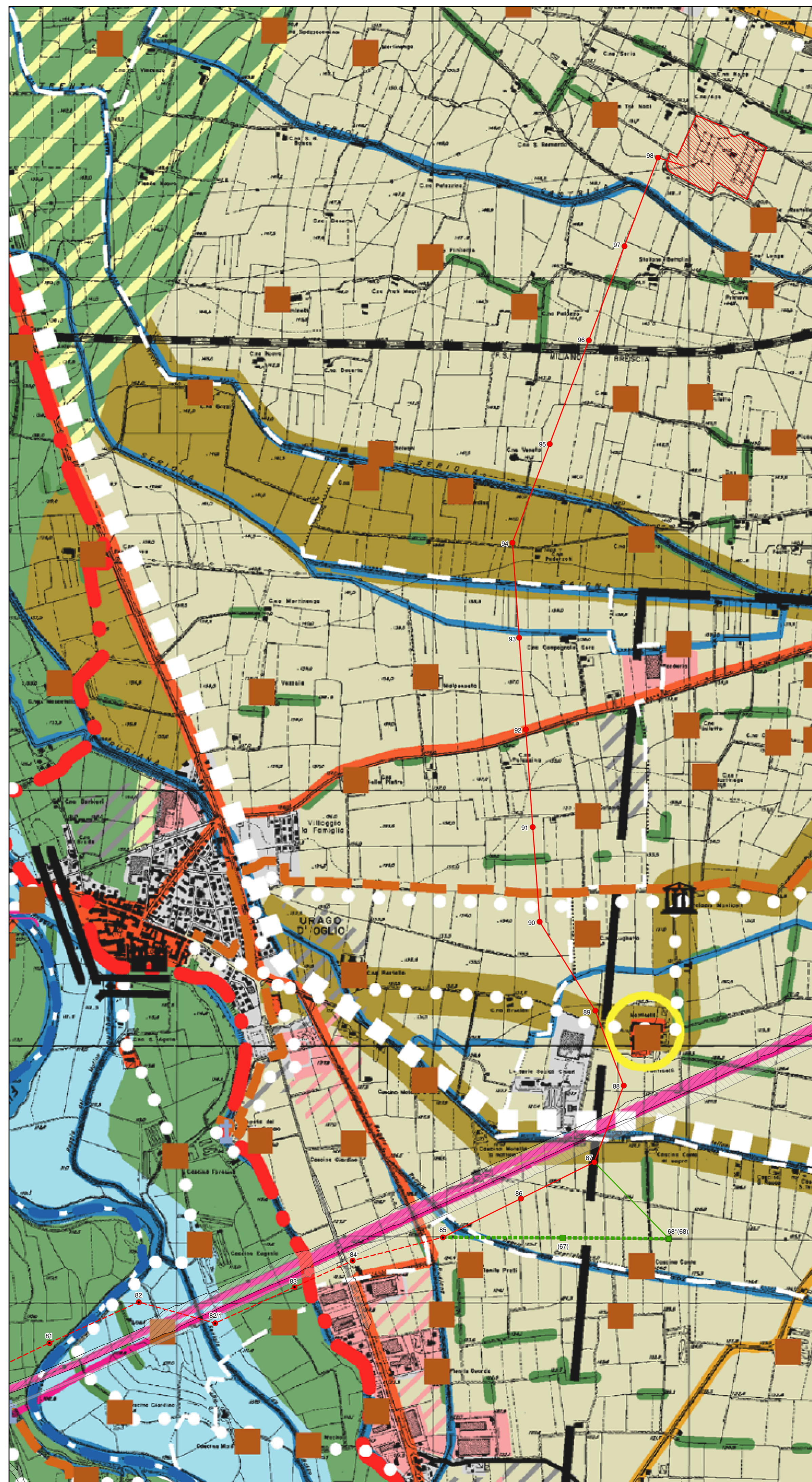
Figura B Estratto Tavola 3a.21 "Ambiente e Rischi - Atlante dei Rischi Idraulici ed Idrogeologici"

Questo documento contiene informazioni di proprietà Terma Spa e deve essere utilizzato esclusivamente dal destinatario in relazione alle finalità per le quali è stato ricevuto. È vietata qualsiasi forma di riproduzione o divulgazione senza l'esplicito consenso di Terma Spa. This document contains information proprietary to TERMA S.p.A. and it will have to be used exclusively for the purposes for which it has been furnished. Whichever shape of spreading or reproduction without the written permission of TERMA S.p.A. is prohibited.