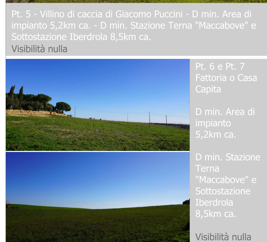
Pt. 6 e Pt. 7 Fattoria o Casa Capita D min. Area di impianto 5,2km ca. D min. Stazione Terna "Maccabove" e Sottostazione Iberdrola 8,5km ca. Visibilità nulla