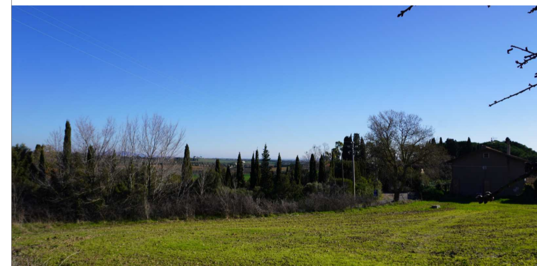
Pt. 5 - Villino di caccia di Giacomo Puccini - D min. Area di impianto 5,2km ca. - D min. Stazione Terna "Maccabove" e Sottostazione Iberdrola 8,5km ca. Visibilità nulla