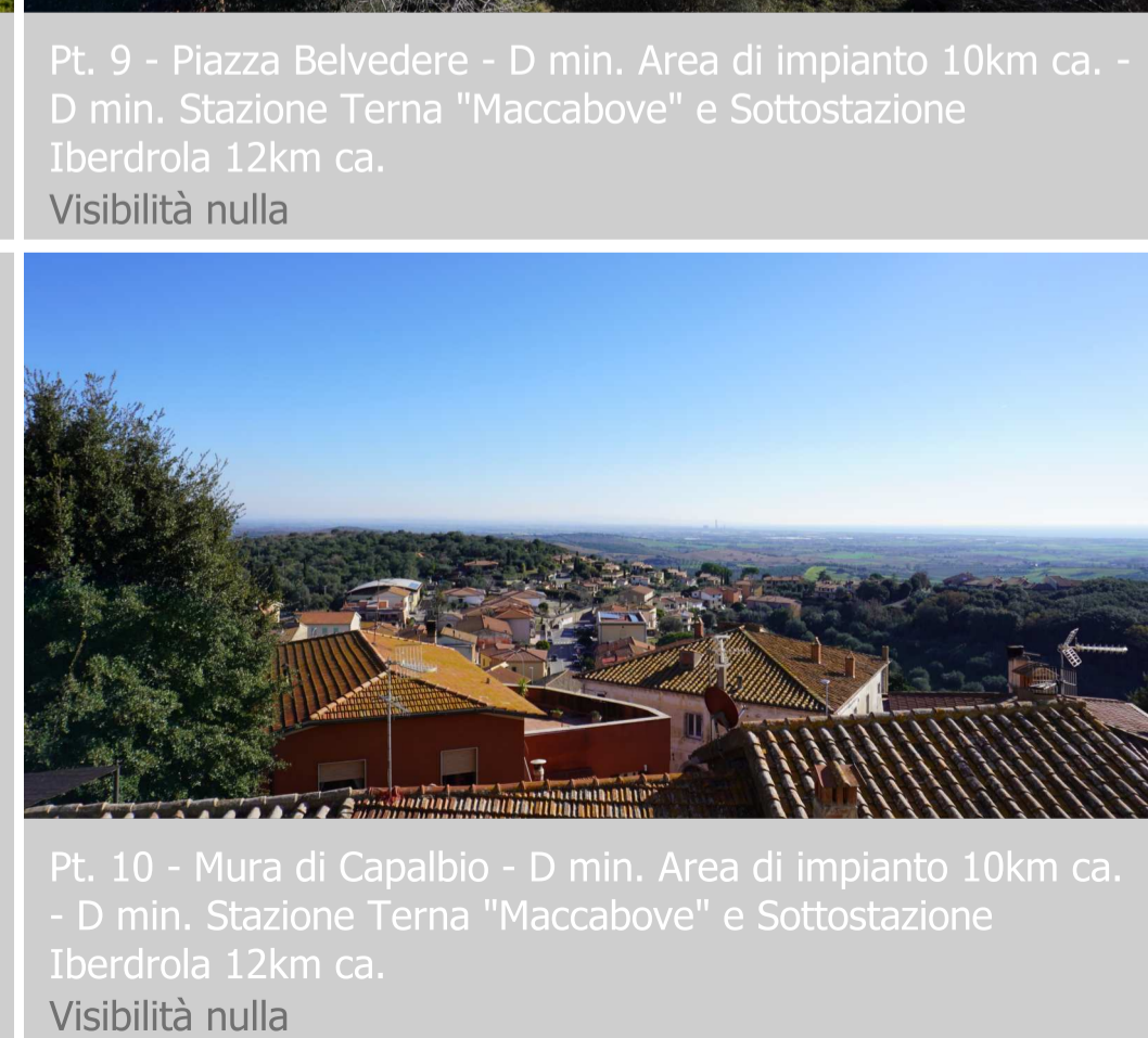
Pt. 10 - Mura di Capalbio - D min. Area di impianto 10km ca. - D min. Stazione Terna "Maccabove" e Sottostazione Iberdrola 12km ca. Visibilità nulla