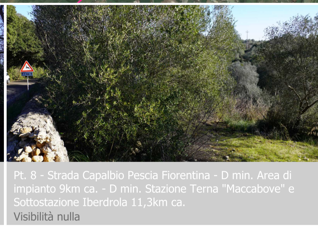
Pt. 8 - Strada Capalbio Pesca Fiorentina - D min. Area di impianto 9km ca. - D min. Stazione Terna "Maccabove" e Sottostazione Iberdrola 11,3km ca. Visibilità nulla