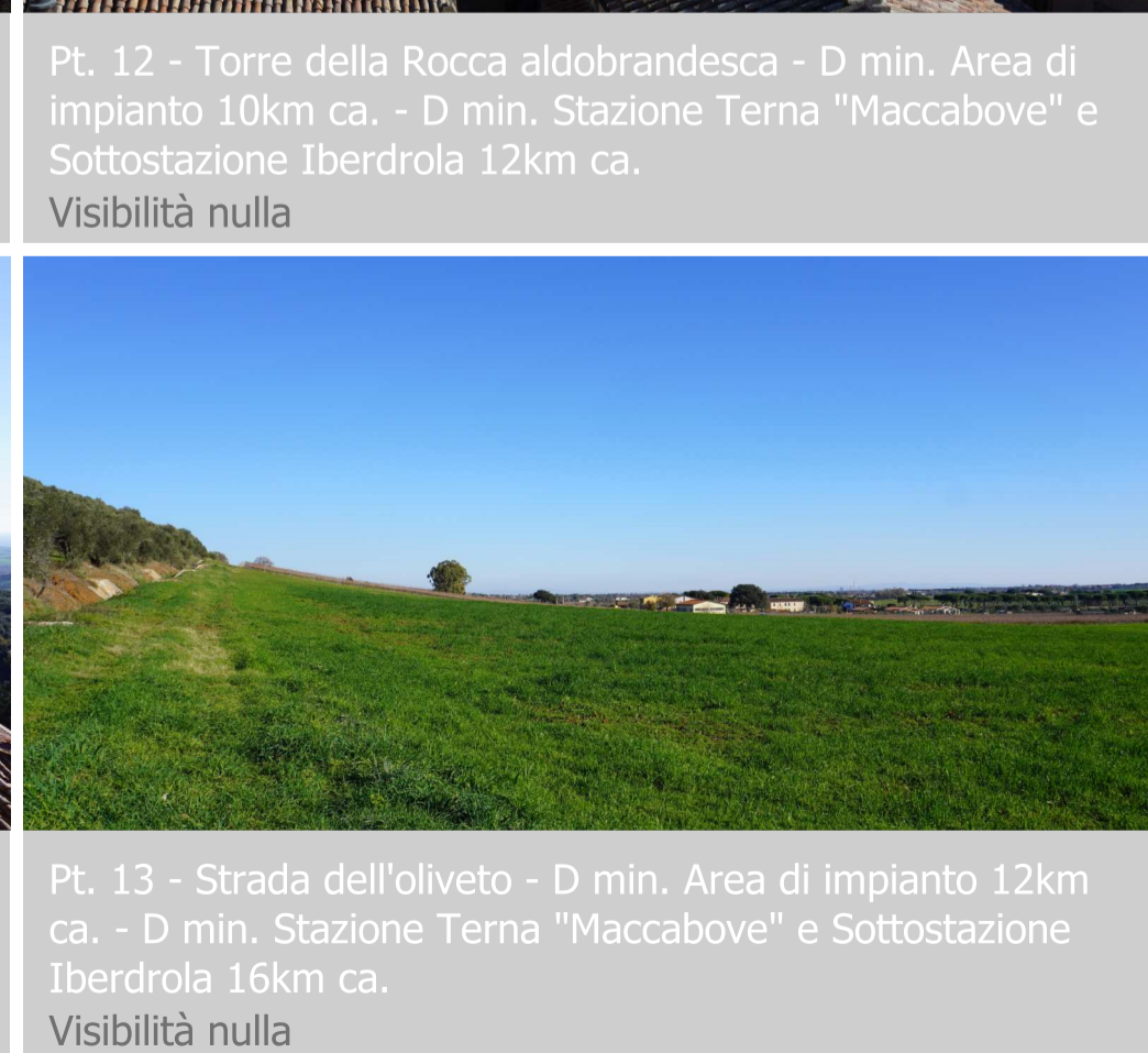
Pt. 13 - Strada dell'oliveto - D min. Area di impianto 12km ca. - D min. Stazione Terna "Maccabove" e Sottostazione Iberdrola 16km ca. Visibilità nulla