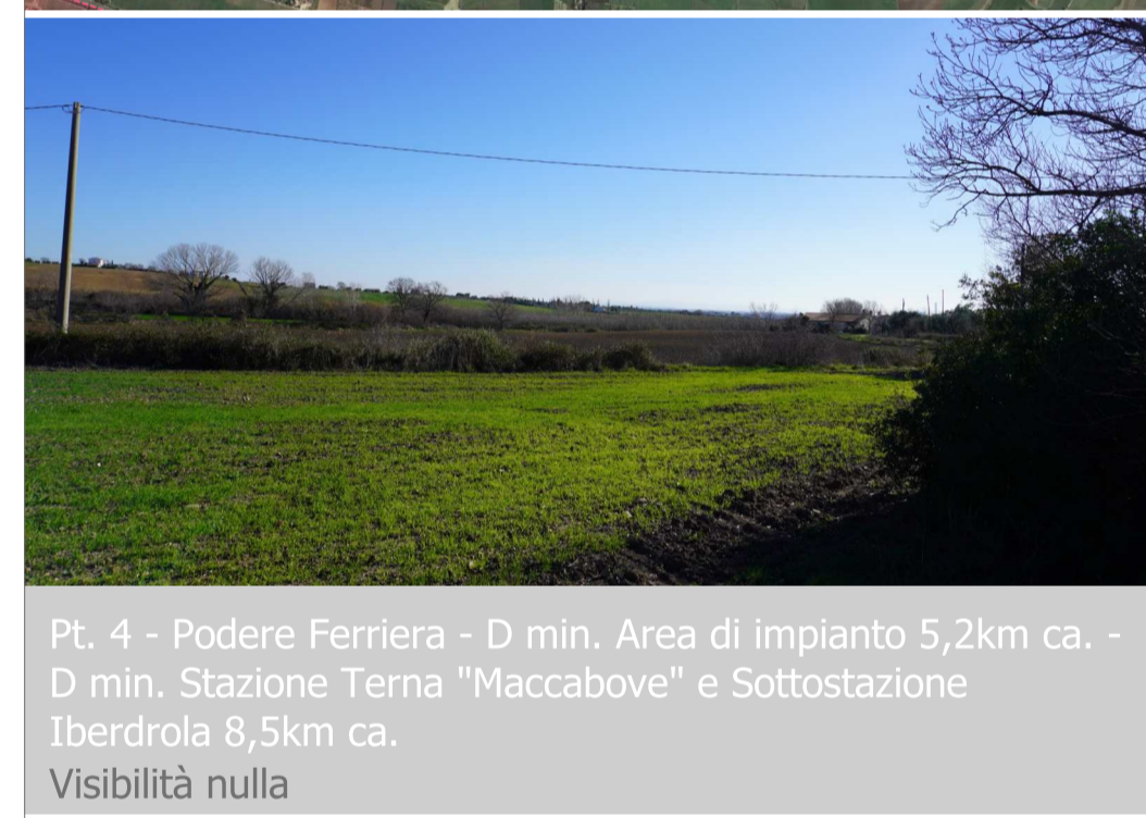
Pt. 4 - Podere Ferriera - D min. Area di impianto 5,2km ca. - D min. Stazione Terna "Maccabove" e Sottostazione Iberdrola 8,5km ca. Visibilità nulla