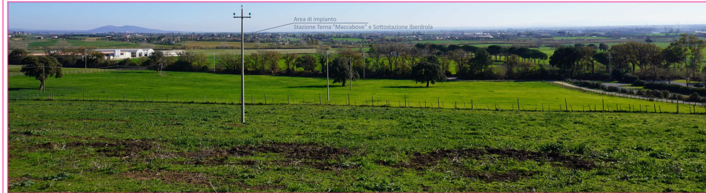
Pt. 2 Strada privata D min. Area di impianto 6km ca. D min. Stazione Terna "Maccabove" e Sottostazione Iberdrola 9,5km ca. Visibilità parziale