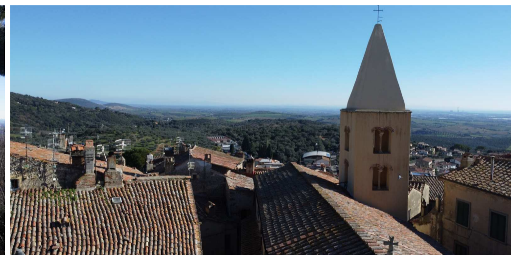
Pt. 12 - Torre della Rocca aldobrandesca - D min. Area di impianto 10km ca. - D min. Stazione Terna "Maccabove" e Sottostazione Iberdrola 12km ca. Visibilità nulla