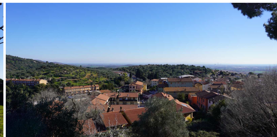
Pt. 9 - Piazza Belvedere - D min. Area di impianto 10km ca. - D min. Stazione Terna "Maccabove" e Sottostazione Iberdrola 12km ca. Visibilità nulla