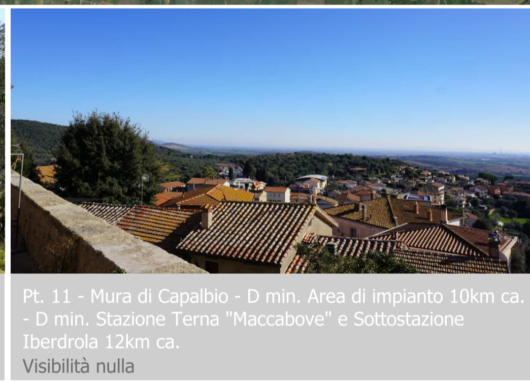
Pt. 11 - Mura di Capalbio - D min. Area di impianto 10km ca. - D min. Stazione Terna "Maccabove" e Sottostazione Iberdrola 12km ca. Visibilità nulla