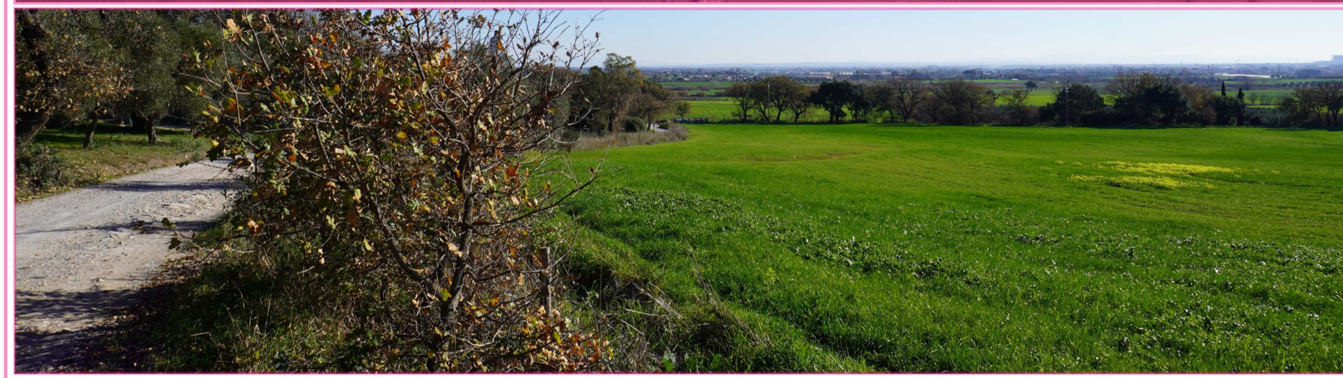
Pt. 1 Strada Garavicchio D min. Area di impianto 6km ca. D min. Stazione Terna "Maccabove" e Sottostazione Iberdrola 9,5km ca. Visibilità nulla