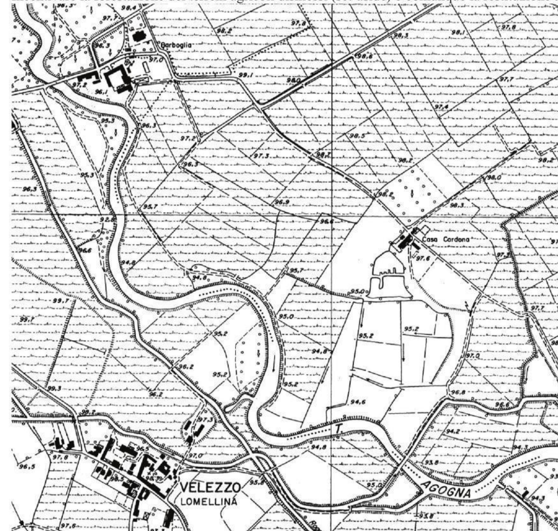
Esempio cartografico dell'unità tipo logica paesaggi delle pianura risicola' (Lomellina, zona fra Vellezzo Lomellina e Cergnago, PV). Estratto da CTR 10.000, foglio A7c4.

Si sottolinea poi l'assoluta urgenza di una tutela integrale e di un recupero del sistema irriguo della bassa pianura, soprattutto nella fascia delle risorgive, e nelle manifestazioni colturali collegate a questo sistema (marcite, prati marcitori, prati irrigui). Promuovere la formazione di parchi agricoli adeguatamente finanziati dove la tutela delle forme produttive tradizionali sia predominante svolgendo un ruolo di testimonianza culturale e di difesa dall'urbanizzazione (si pensi, ad esempio, al vasto comprensorio agricolo della Bassa Milanese). Sviluppare nuove linee di progettazione del paesaggio agrario orientando scelte e metodi di coltivazione biologici. Incentivare la forestazione dei terreni agricoli dismessi (set-aside) o comunque la restituzione ad