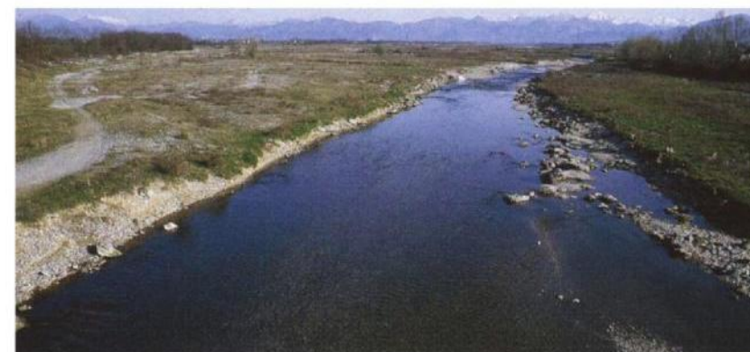
Foto 32 - I magredi del Serio

Data l'elevata concentrazione di fontanili attivi e potenziali, oggi in disuso per effetto di scorrette politiche agricole e gestionali delle risorse idriche, questa parte di territorio appartiene quasi interamente, tranne la fascia agricola a nord nord-est ed ovest di Treviglio, alla fascia dei fontanili riconosciuta dagli studi settoriali come area di pregio naturalistico per i sistemi naturalistici endemici appurati e per i sistemi storico culturali ancora leggibili sul territorio (sistema delle cascine e dei nuclei storici rurali, sistema della viabilità storica, sistema delle centuriazioni, sistema delle rogge e dei canali), per la identificazione dei quali si rimanda all'elaborazione di dettaglio del Piano Territoriale di Coordinamento provinciale a valenza paesistica.