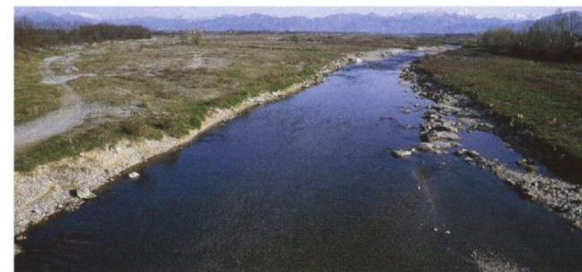
Foto 32 - I magredi del Serio

Data l'elevata concentrazione di fontanili attivi e potenziali, oggi in disuso per effetto di scorrette politiche agricole e gestionali delle risorse idriche, questa parte di territorio appartiene quasi interamente, tranne la fascia agricola a nord nord-est ed ovest di Treviglio, alla fascia dei fontanili riconosciuta dagli studi settoriali come area di pregio naturalistico per i sistemi naturalistici endemici appurati e per i sistemi storico culturali ancora leggibili sul territorio (sistema delle cascine e dei nuclei storici rurali, sistema della viabilità storica, sistema delle centuriazioni, sistema delle rogge e dei canali), per la identificazione dei quali si rimanda all'elaborazione di dettaglio del Piano Territoriale di Coordinamento provinciale a valenza paesistica.