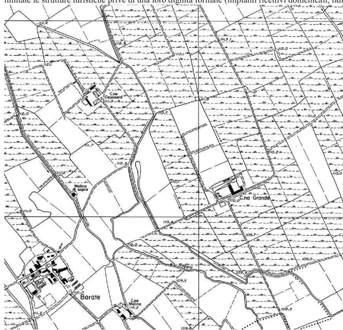
Esempio cartografico dell'unità tipo logica paesaggi della pianura irrigua cerealicolo-foraggera' (bassa pianura milanese a sud di Gaggiano, MI). Estratto da CTR 10.000, foglio B6a4 Trezzano sul Naviglio.

Va rispettata la tendenza a limitare gli insediamenti nelle zone golenali. Vanno controllate e limitate le strutture turistiche prive di una loro dignità formale (impianti ricettivi domenicali, lidi