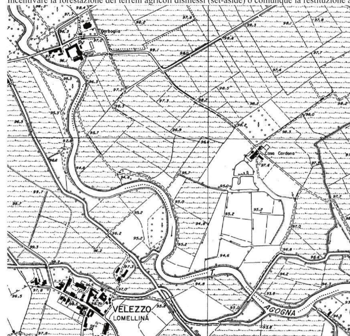
Esempio cartografico dell'unità tipo logica paesaggi delle pianura risicolo' (Lomellina, zona fra Vellezzo Lomellina e Cergnago, PV). Estratto da CTR 10.000, foglio A7c4.

Si sottolinea poi l'assoluta urgenza di una tutela integrale e di un recupero del sistema irriguo della bassa pianura, soprattutto nella fascia delle risorgive, e nelle manifestazioni colturali collegate a questo sistema (marcite, prati marcitori, prati irrigui). Promuovere la formazione di parchi agricoli adeguatamente finanziati dove la tutela delle forme produttive tradizionali sia predominante svolgendo un ruolo di testimonianza colturale e di difesa dall'urbanizzazione (si pensi, ad esempio, al vasto comprensorio agricolo della Bassa Milanese). Sviluppare nuove linee di progettazione del paesaggio agrario orientando scelte e metodi di coltivazione biologici. Incentivare la forestazione dei terreni agricoli dismessi (set-aside) o comunque la restituzione ad