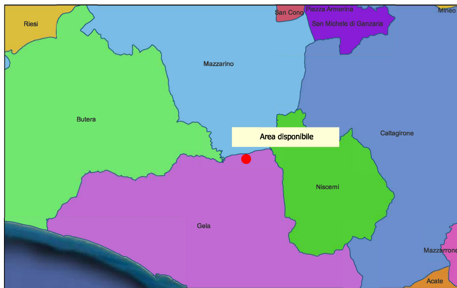
INQUADRAMENTO TERRITORIALE - SCALA 1:200.000