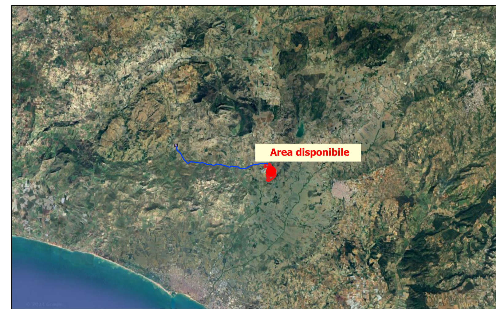
INQUADRAMENTO TERRITORIALE - SCALA 1:1.500.000