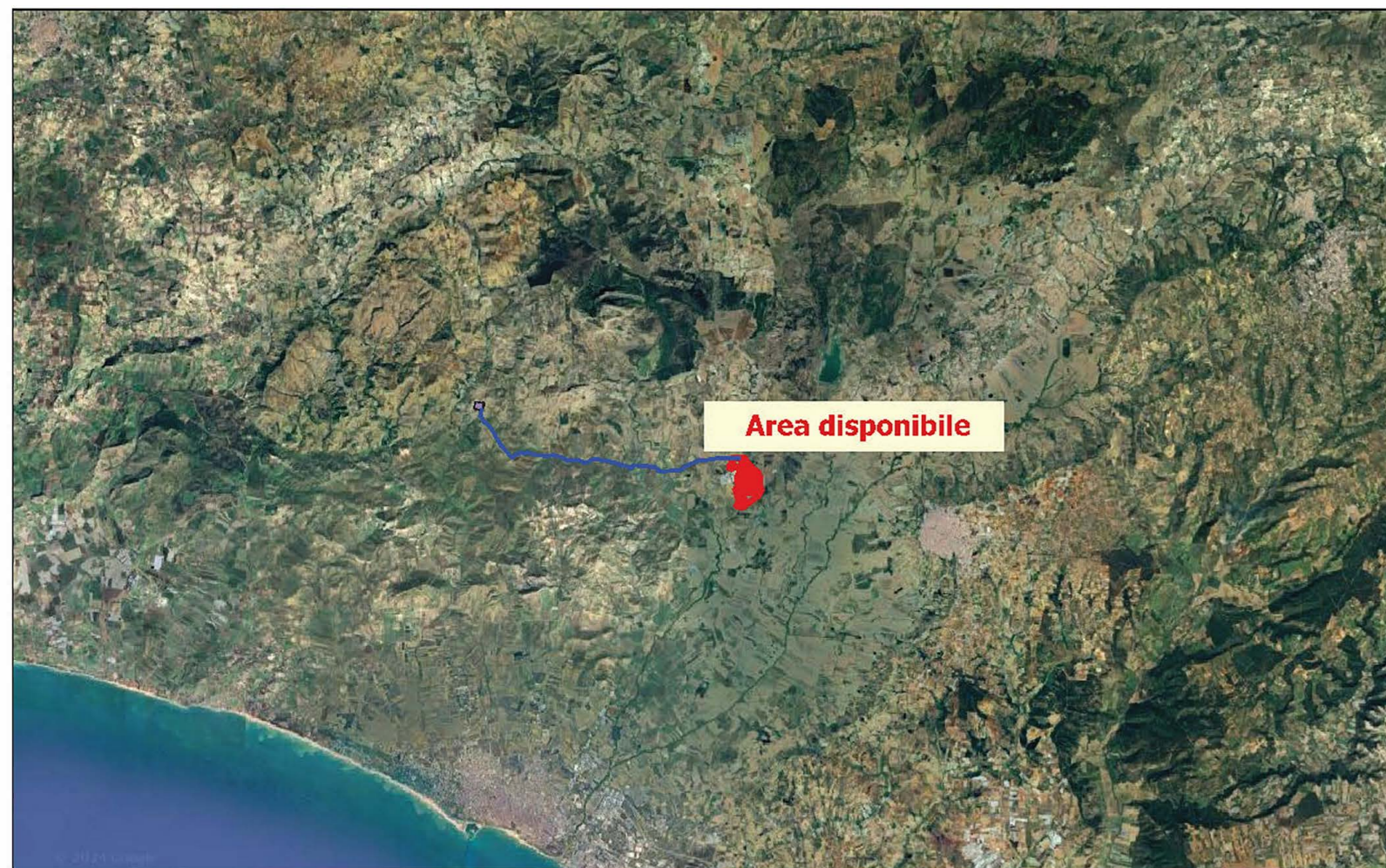
INQUADRAMENTO TERRITORIALE - SCALA 1:250.000