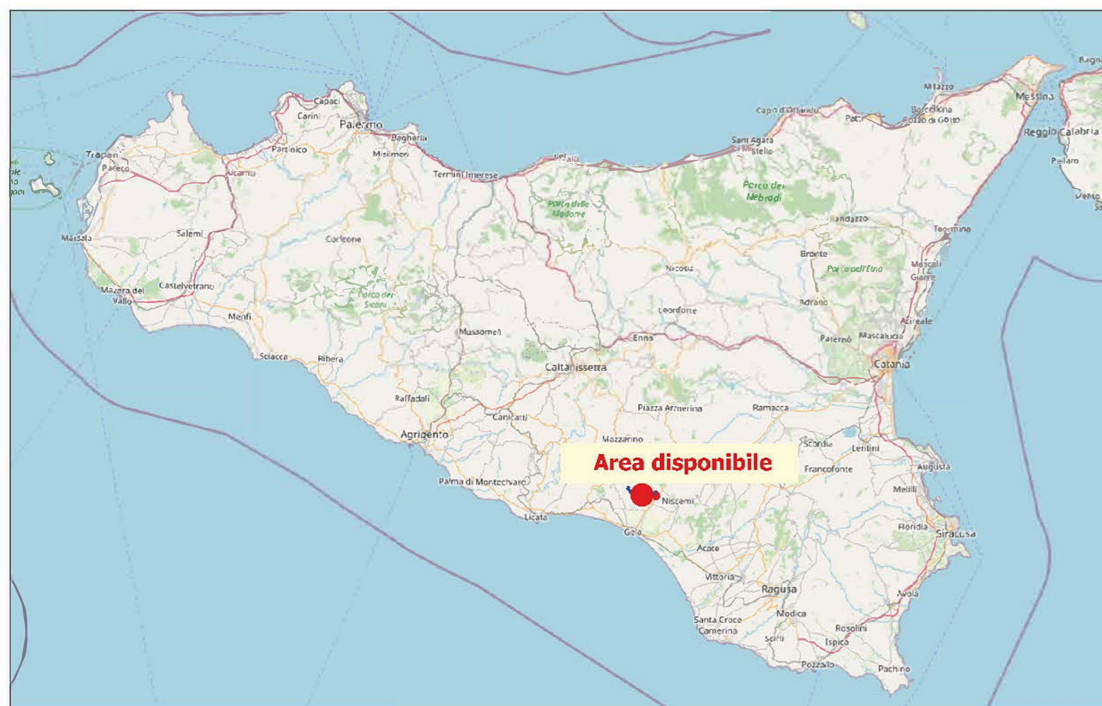
INQUADRAMENTO TERRITORIALE - SCALA 1:1.500.000