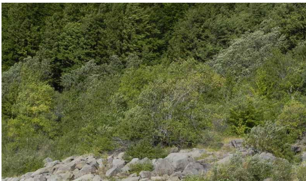
Foto 1-5 Nella parte più alta delle sponde del Lago Ballano si affermano formazioni di salici arbustivi ( Salix caprea , S. apennina , S. eleagnos e S. purpurea ).