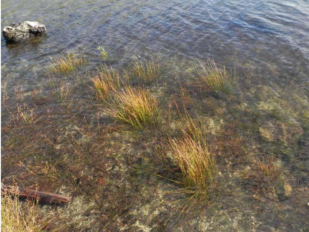
Foto 1-10 - Phytocoenon a Juncus filiformis .