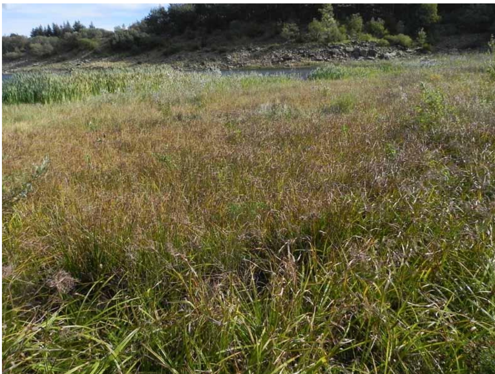
Foto 1-8 - Phytocoenon a Scirpus sylvaticus .