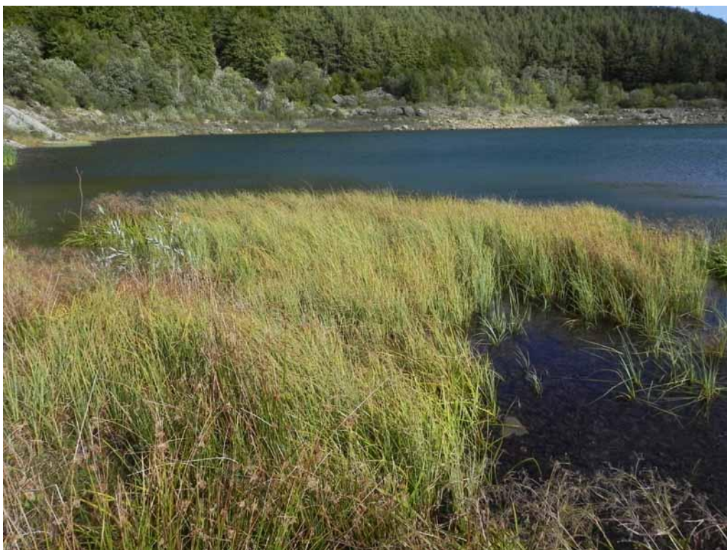
Foto 1-7 - Phytocoenon a Carex rostrata.