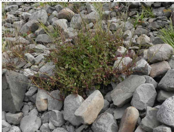
Foto 1-3 - Lembi di vegetazione glareicola sulle sponde del Lago Ballano: Rumex scutatus .