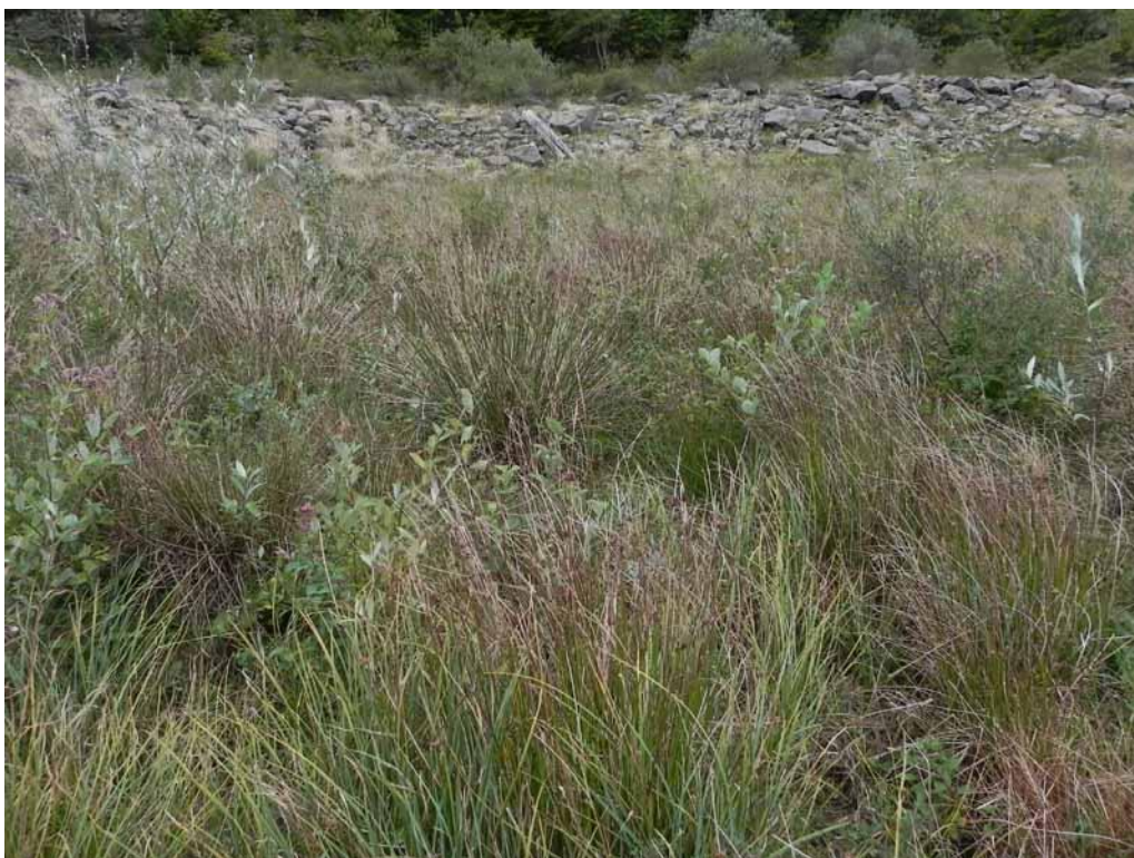
Foto 1-9 - Phytocoenon a Juncus effusus .