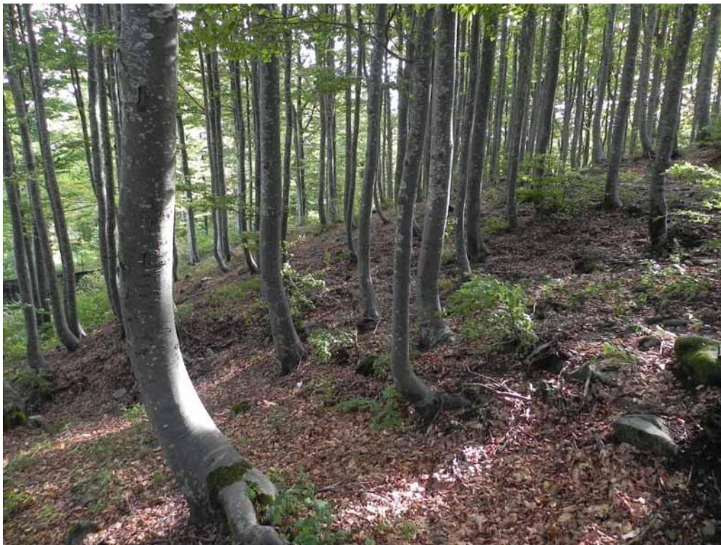
Foto 1-1 - Gymnocarpio-Fagetum subass. trochiscanthesum nei pressi del Lago Ballano.

Si riporta di seguito la fotodocumentazione delle tipologie vegetazionali osservate attorno al Lago Ballano a settembre 2022.