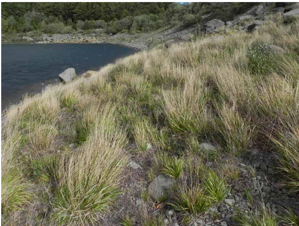
Foto 1-4 - Sulle sponde del Lago Ballano sono presenti formazioni erbacee aperte ad elevata petrosità superficiale a dominanza di Brachypodium genuense .