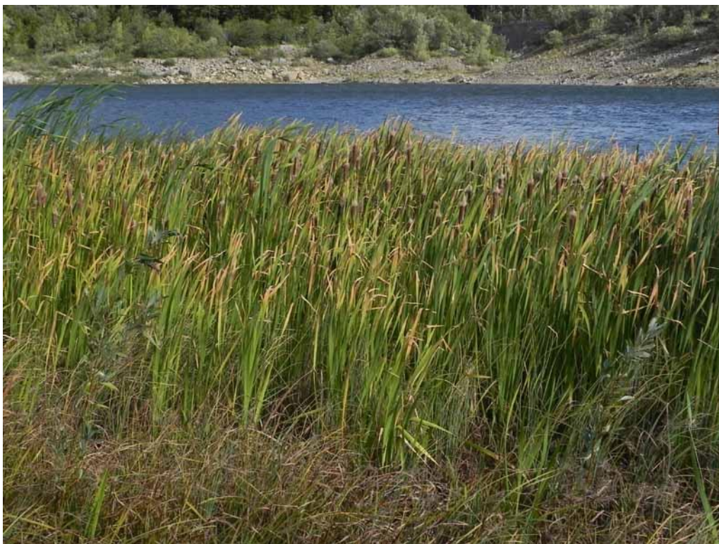
Foto 1-6 - Typhetum shuttleworthii.