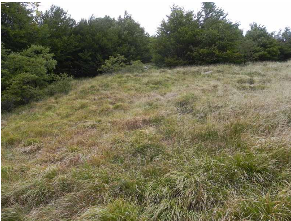
Foto 2-12 - Phytocoenon a Brachypodium genuense nei pressi della diga del Lago Verde.