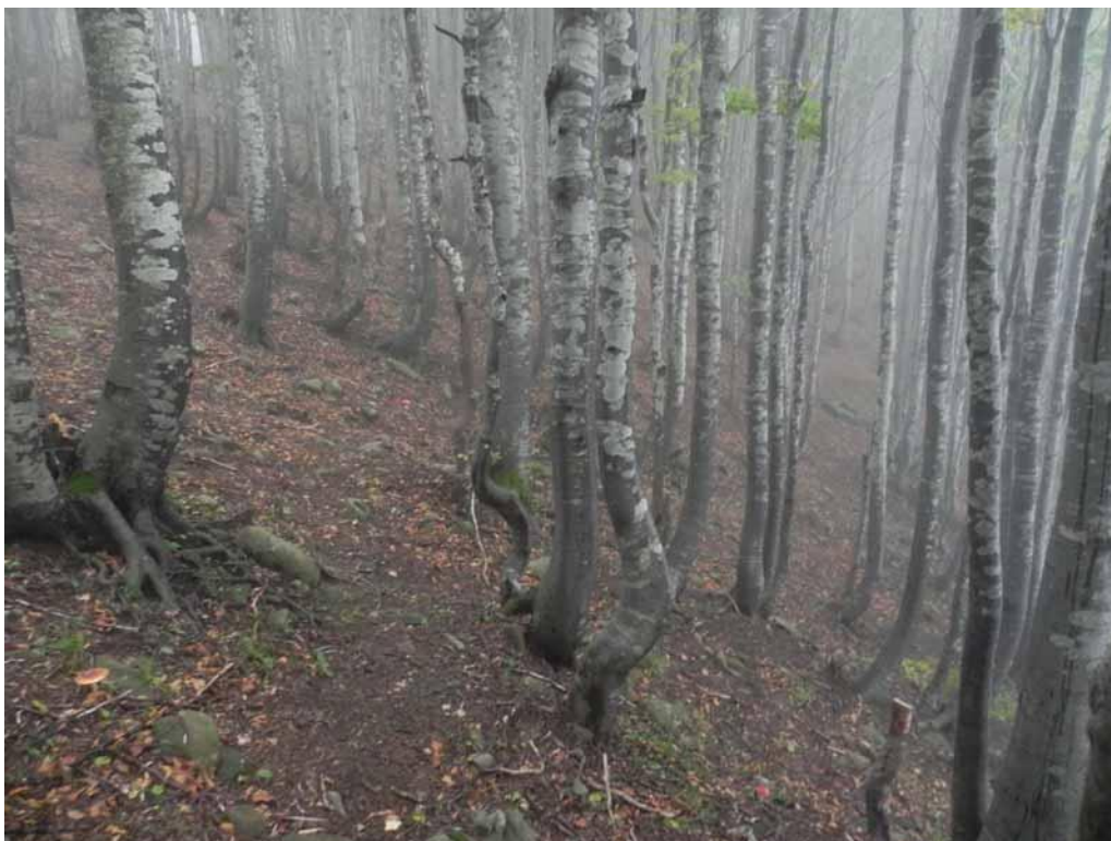
Foto 2-1 - Gymnocarpio-Fagetum subass. trochiscanthesum nei pressi del Lago Verde.

Si riporta di seguito la fotodocumentazione delle tipologie vegetazionali osservate lungo attorno al Lago Verde a settembre 2022.