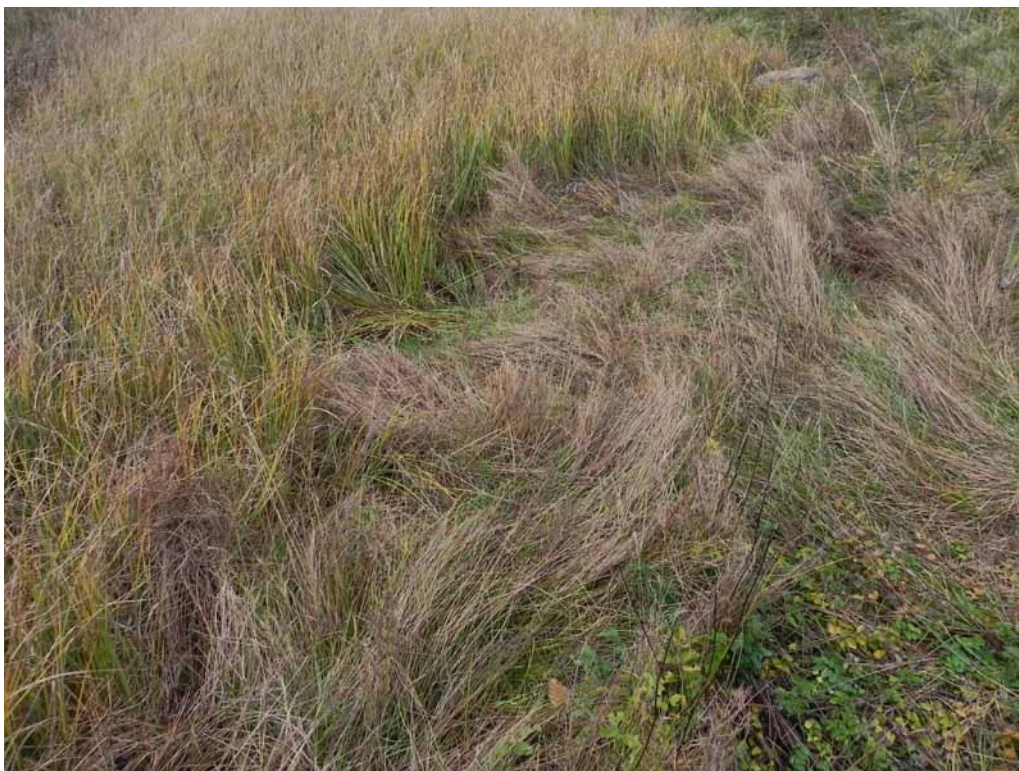
Foto 2-8 - Phytocoenon a Juncus filiformis sulle sponde del Lago Verde.