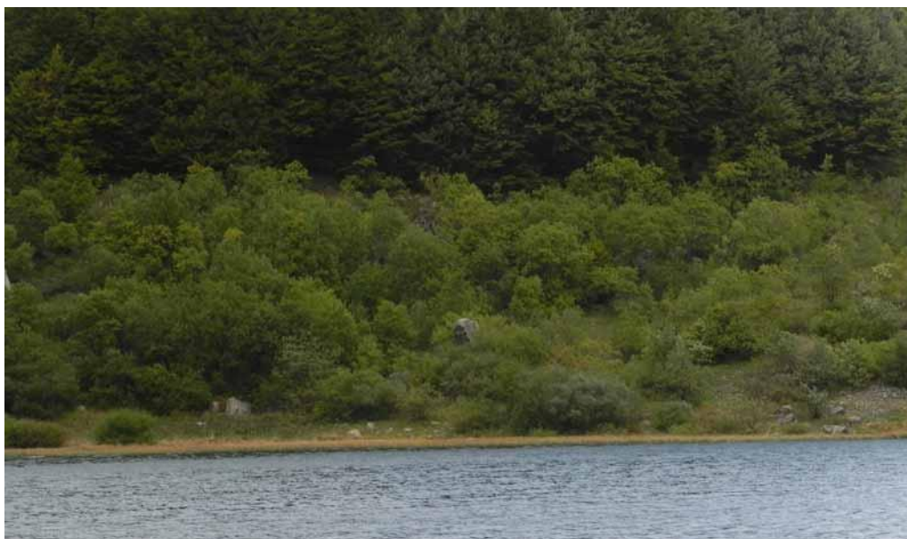
Foto 2-5 - formazioni di salici arbustivi ( Salix caprea , S. apennina , S. eleagnos e S. purpurea ) sulle sponde del Lago Verde.