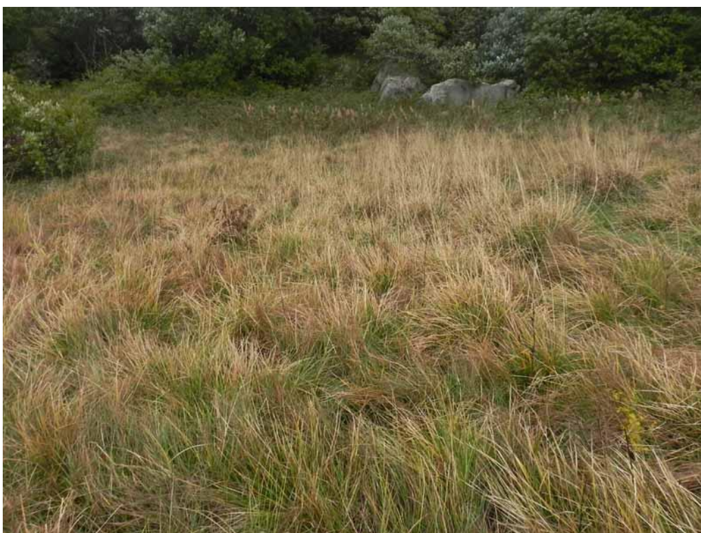
Foto 2-9 - Phytocoenon a Deschampsia caespitosa sulle sponde del Lago Verde.