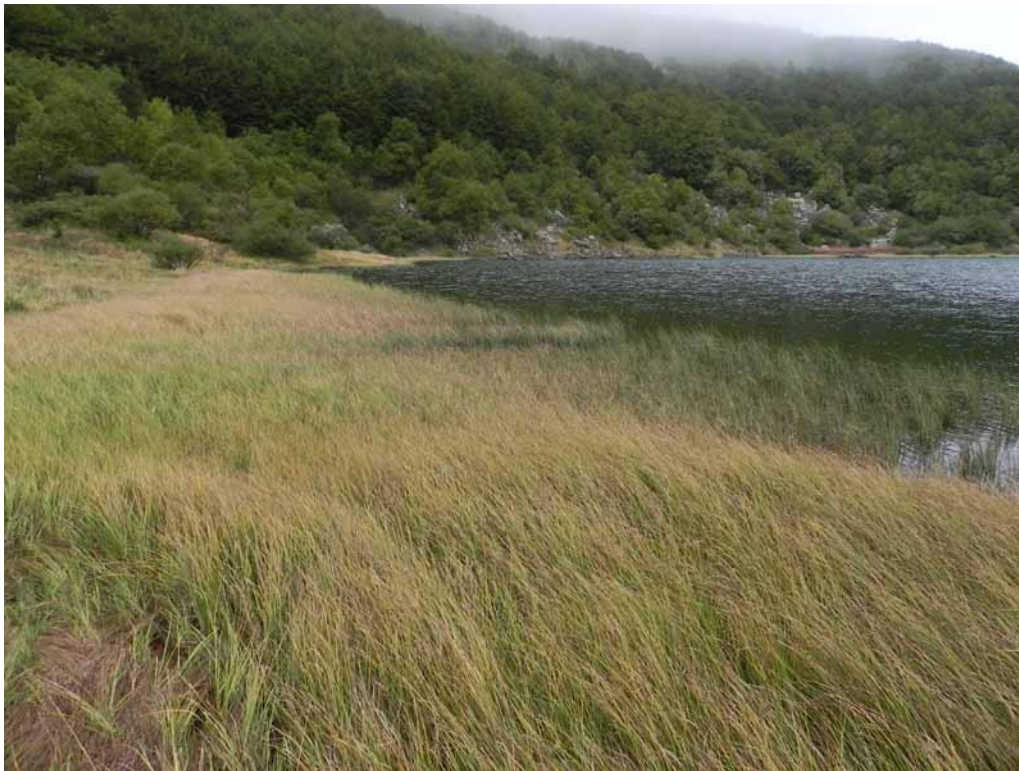
Foto 2-7 - Phytocoenon a Carex rostrata sulle sponde del Lago Verde.