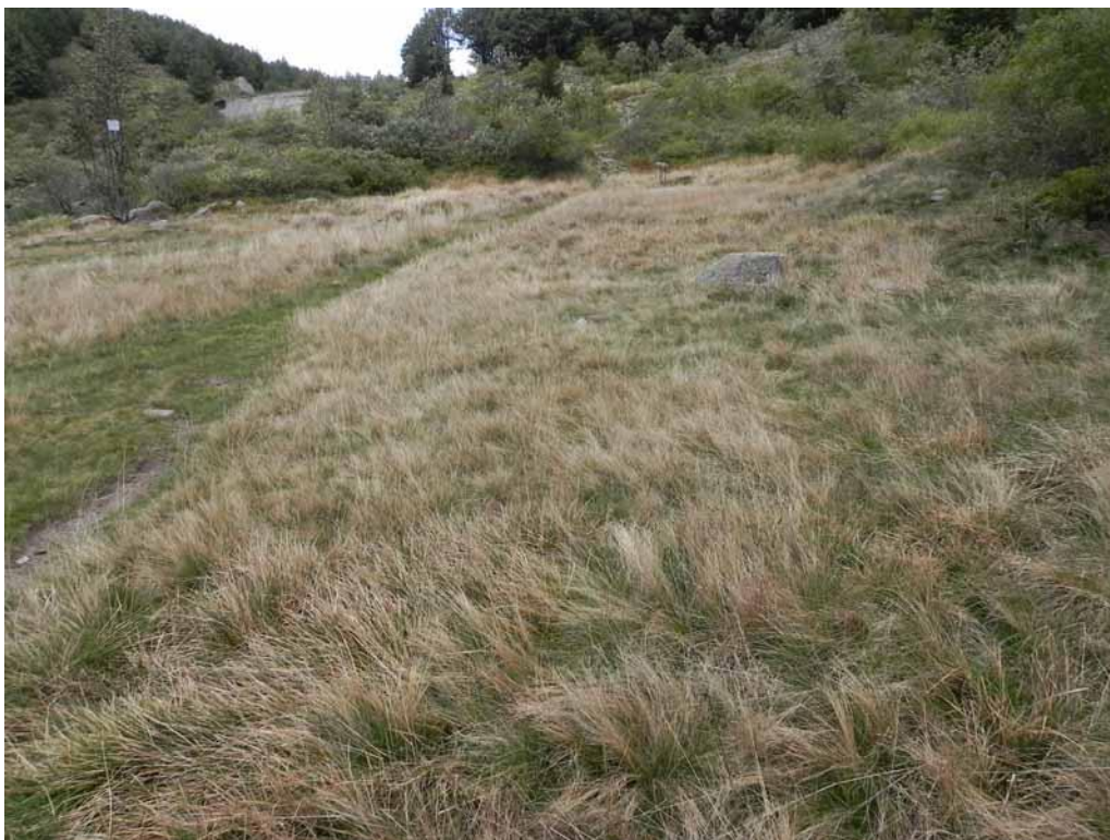
Foto 2-4 - Lembo di prateria a dominanza di Nardus stricta sulle sponde del Lago Verde.