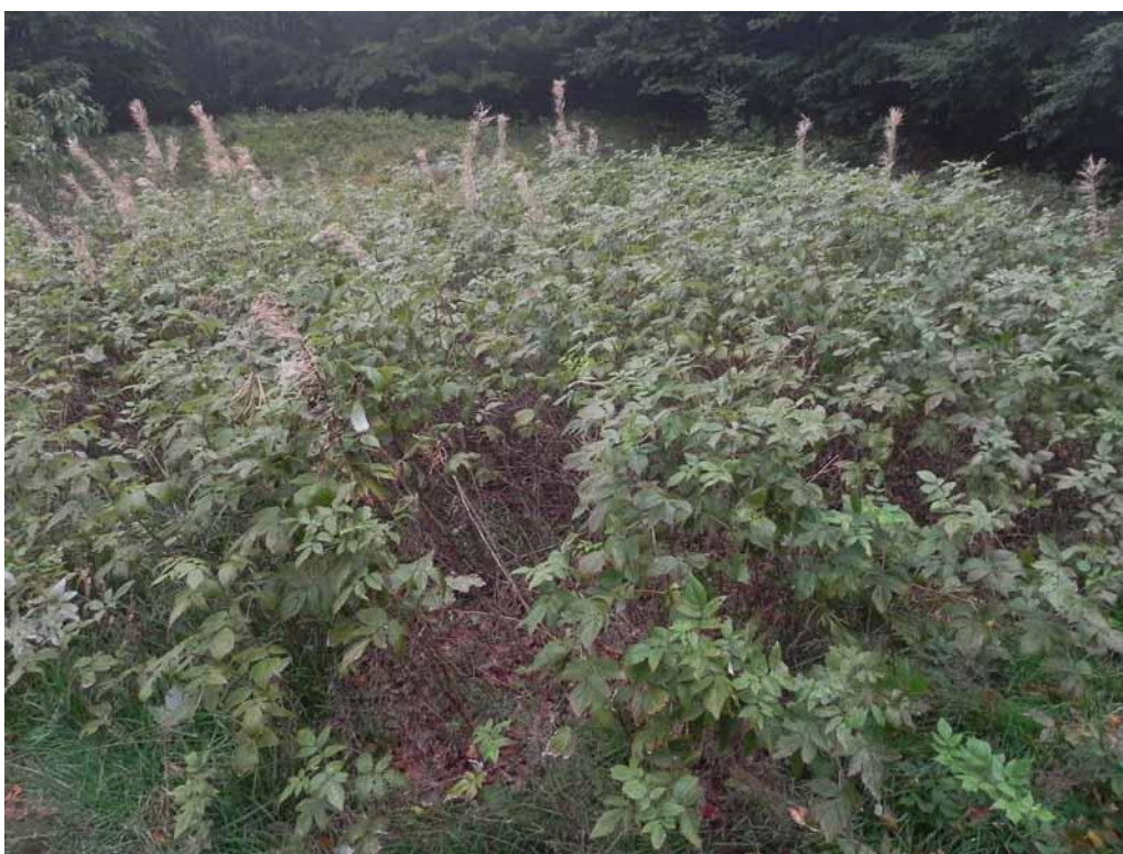
Foto 2-11 - Rubetum, idaei Davanti all'edificio comandi e servizi situato presso la diga del Lago Verde.