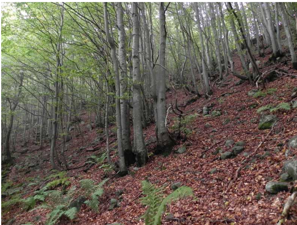
Foto 2-2 - Gymnocarpio-Fagetum typicum immediatamente a valle della diga del Lago Verde.