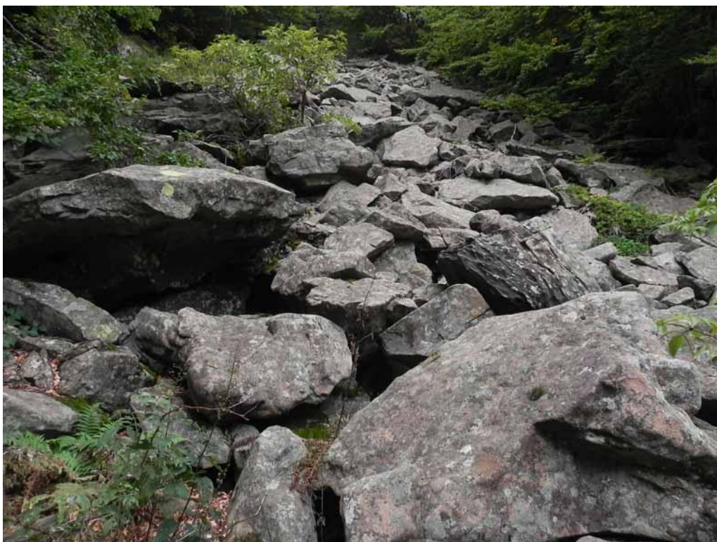
Foto 1-3 - In corrispondenza delle pietraie stabilizzate a grandi massi di Arenaria Macigno si afferma l'associazione glareicola Cryptogrammo-Drypteridetum oreadis .