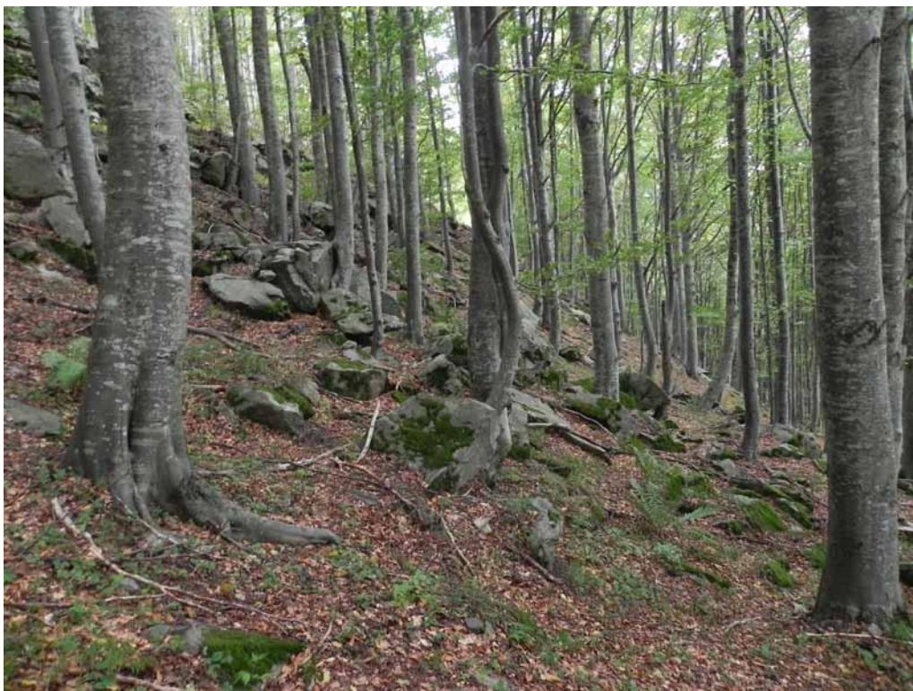
Foto 1-1 - Gymnocarpio-Fagetum subass. trochiscanthetosum lungo la pista forestale che dal Lago Ballano conduce al Lago Verde.

Si riporta di seguito la fotodocumentazione delle tipologie vegetazionali osservate lungo la pista forestale che dal Lago Ballano conduce al Lago Verde a settembre 2022.