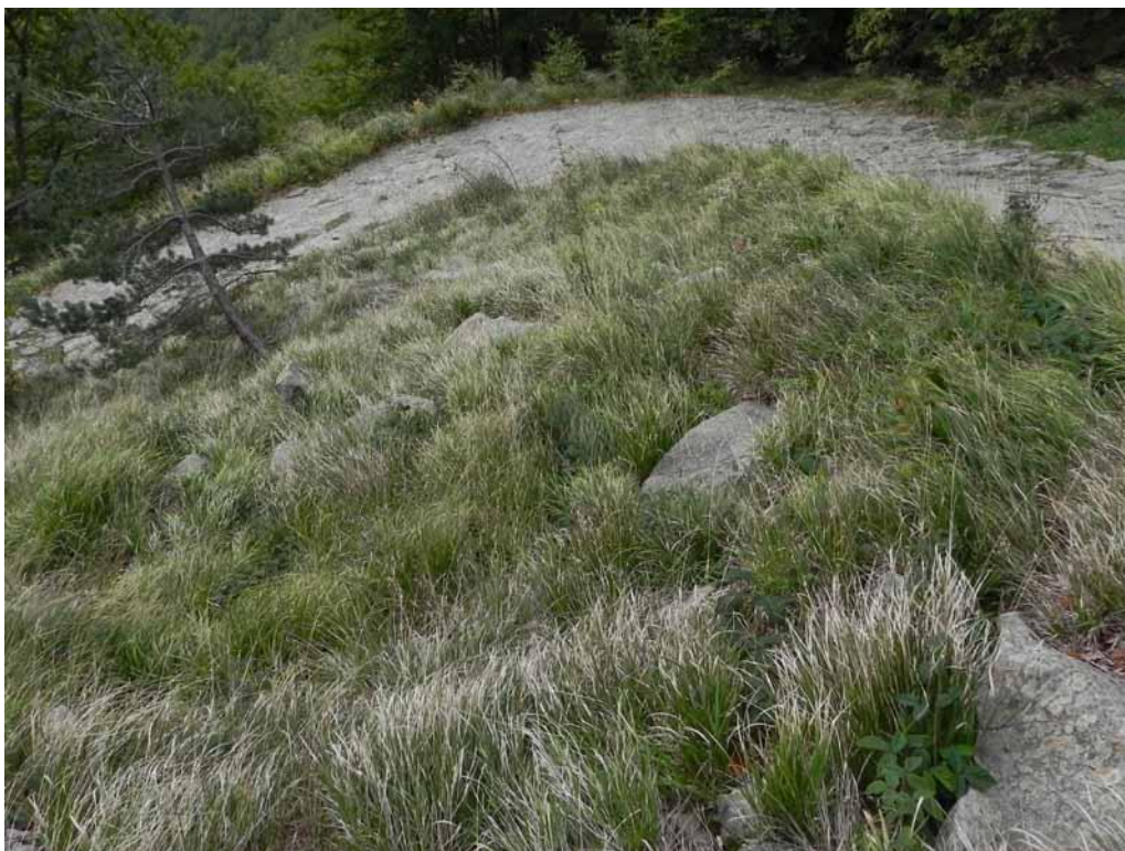
Foto 1-2 - Phytocoenon a Brachypodium genuense lungo la pista di accesso al Lago Verde.