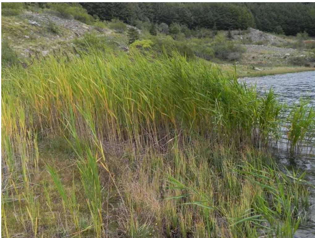
Foto 2-6 - Nei pressi dello scarico del Lago Verde è presente un piccolo canneto a Cannuccia di palude riferibile all'associazione Phragmitetum australis .