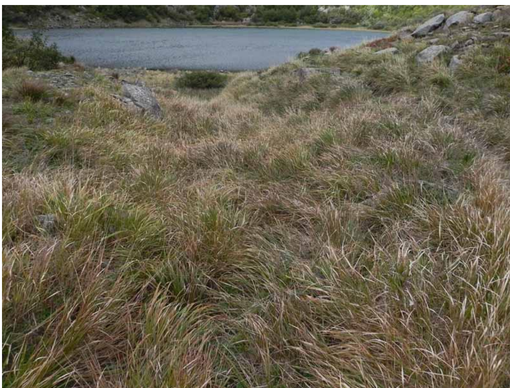
Foto 2-3 - Formazione prativa a dominanza di Brachypodium genuense sulle sponde del Lago Verde.