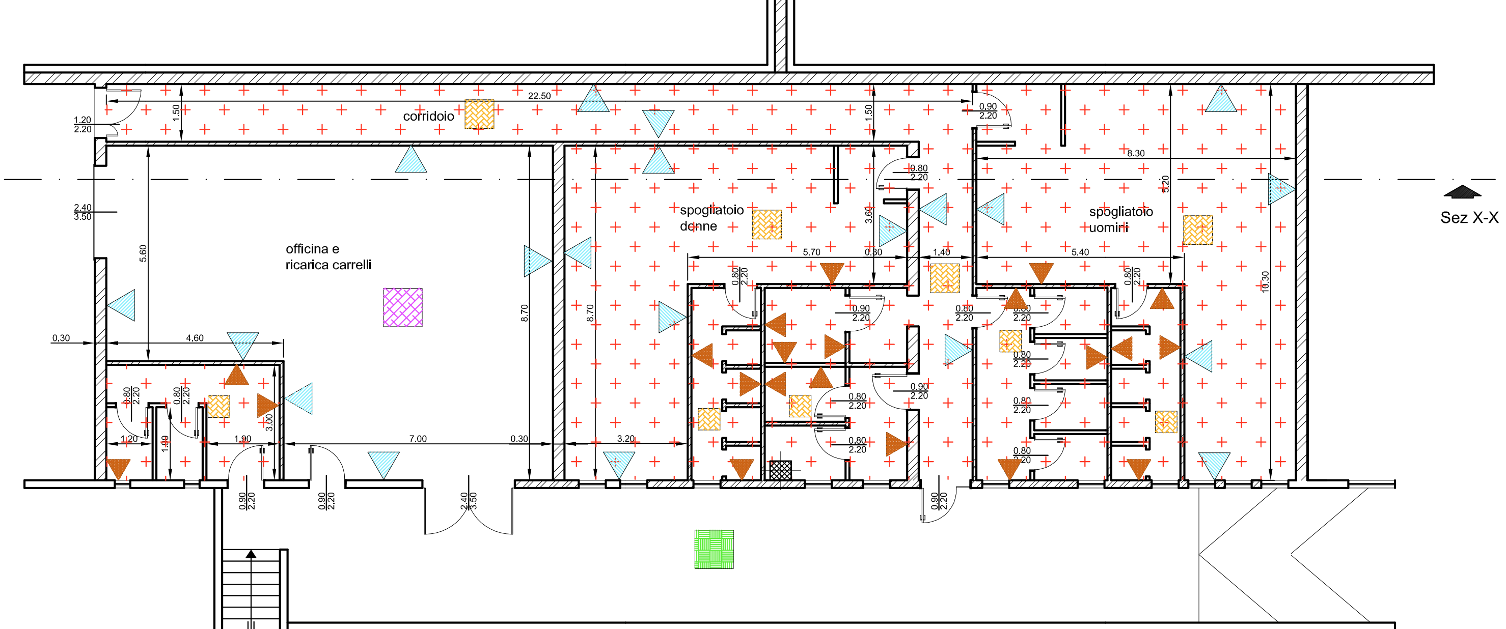
PARTICOLARE UFFICI E SERVIZI SCALA 1:100