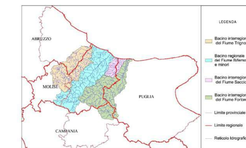
CARTA DELLA PERICOLOSITA' IDRAULICA assetto idraulico