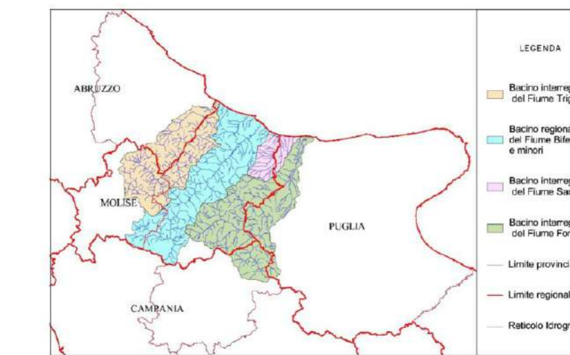
CARTA DEL RISCHIO IDRAULICO assetto idraulico