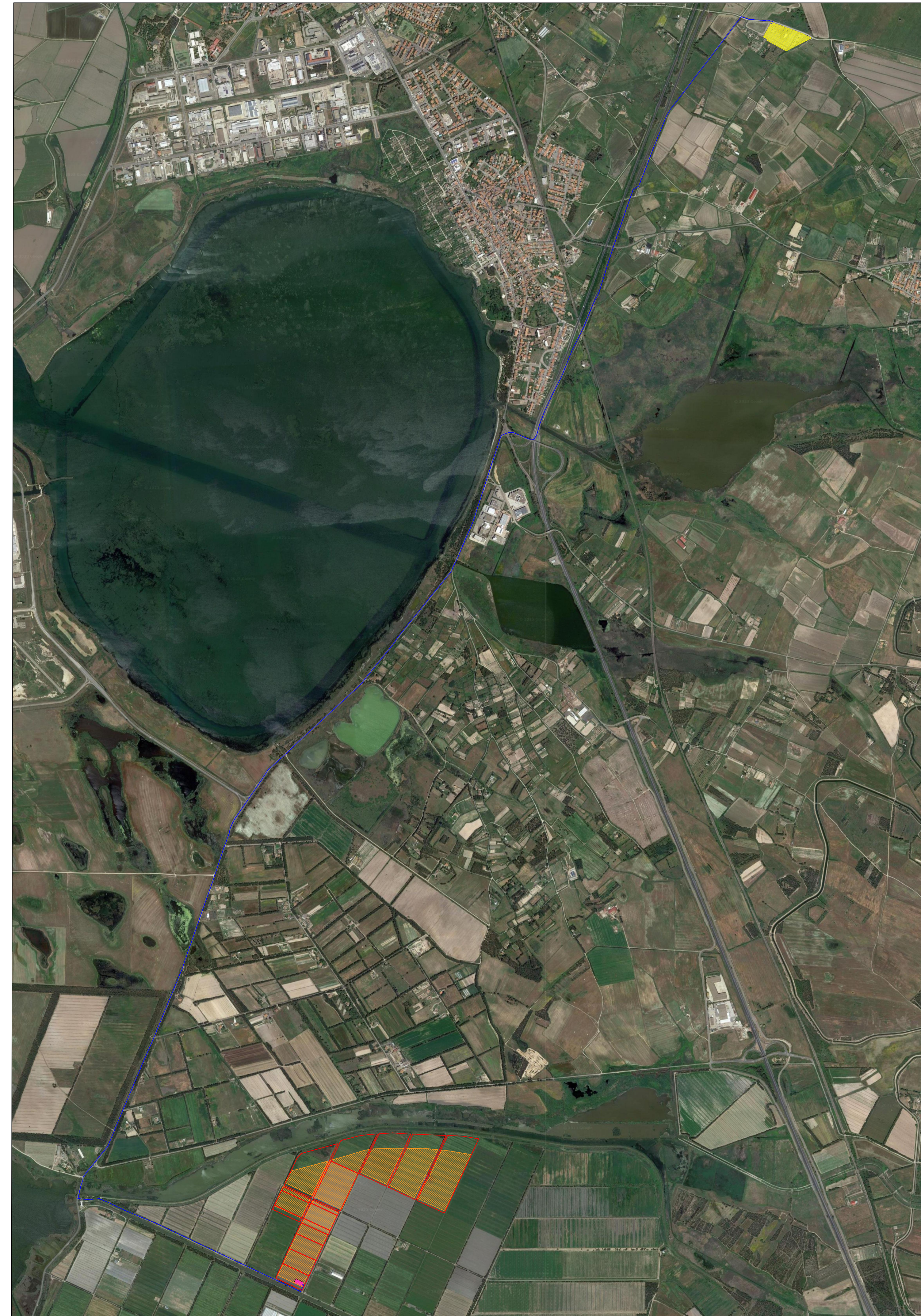
Aerofoto scala 1:15.000