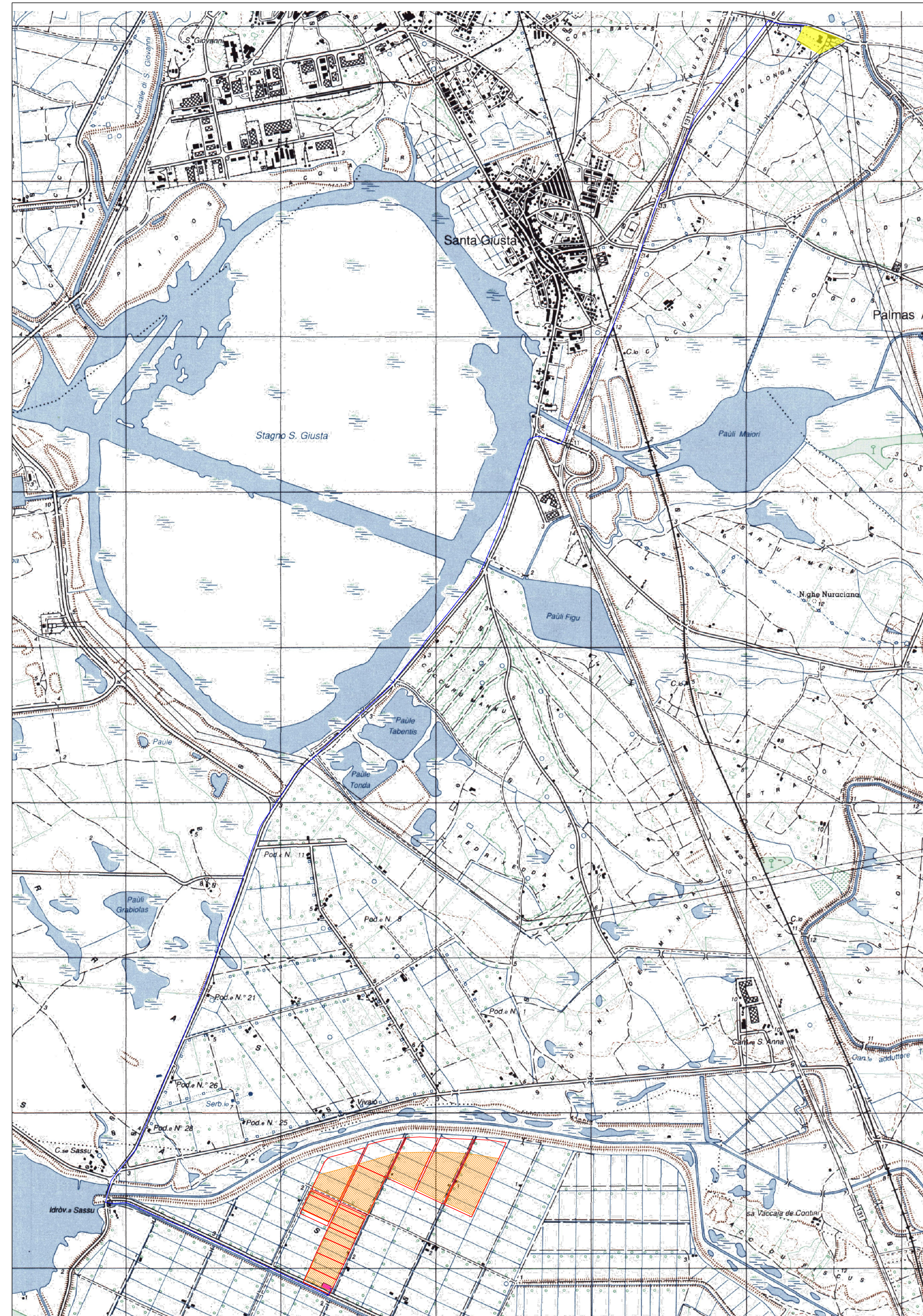
Inquadramento IGM scala 1:15.000