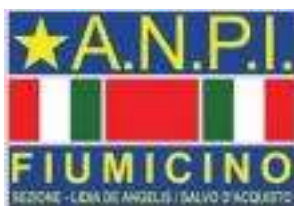
Progetto per la realizzazione del porto turistico-crocieristico di Isola Sacra -Fiumicino (ID 10397) Osservazione della Sezione ANPI FIUMICINO