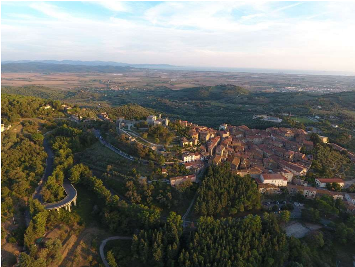
Vista da Campiglia Marittima

In questa sede mi limito a citare alcune delle innumerevoli carenze del progetto presentato, riservandomi di incaricare nel prosieguo dell'istruttoria professionisti specializzati al fine di avere quantomeno la certezza di avere verificato tutti gli aspetti richiamati dalle leggi vigenti in materia ambientale.