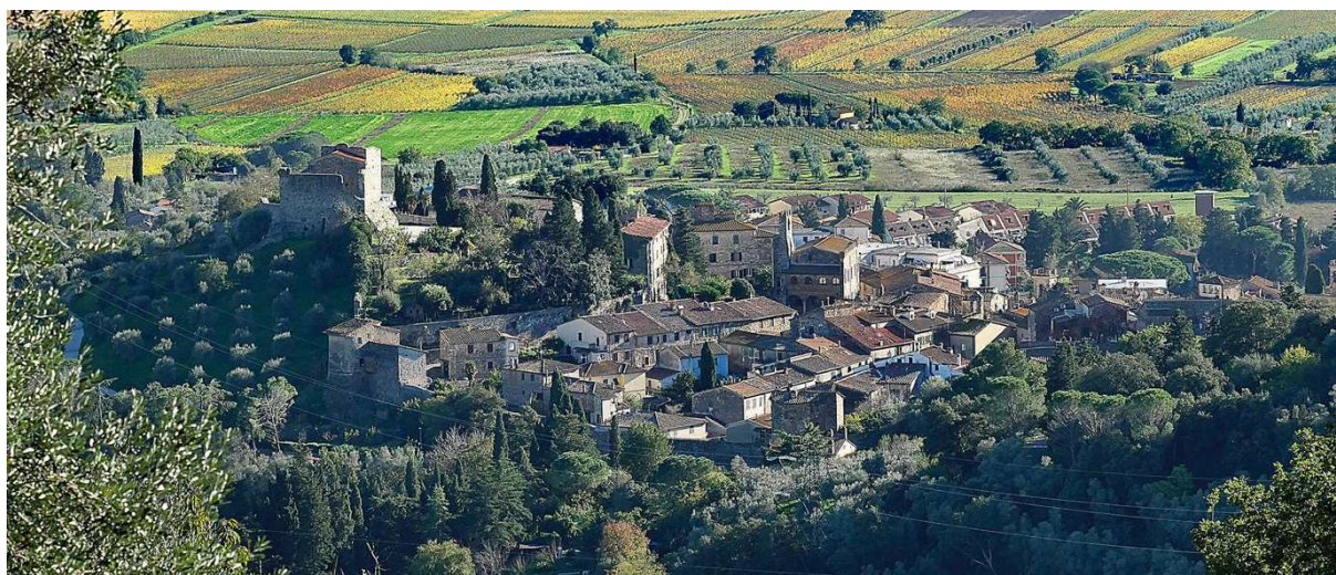
Vista da Suvereto

Questa piccola comunità rurale è una preziosa perla architettonica in cui si intersecano in modo armonico l'antica cinta muraria, l'imponente Rocca, i vicoli lastricati, lo storico palazzo comunale, la chiesa San Giusto ed il chiostro di San Francesco. Nel Borgo sono presenti due piccoli musei, ovvero il Museo artistico della bambola ed il Museo di arte sacra.