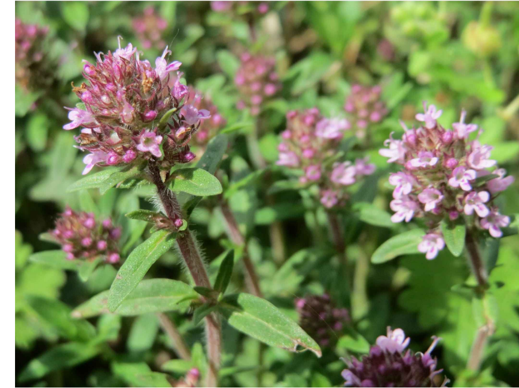
Thymus serpyllum 15 esemplari