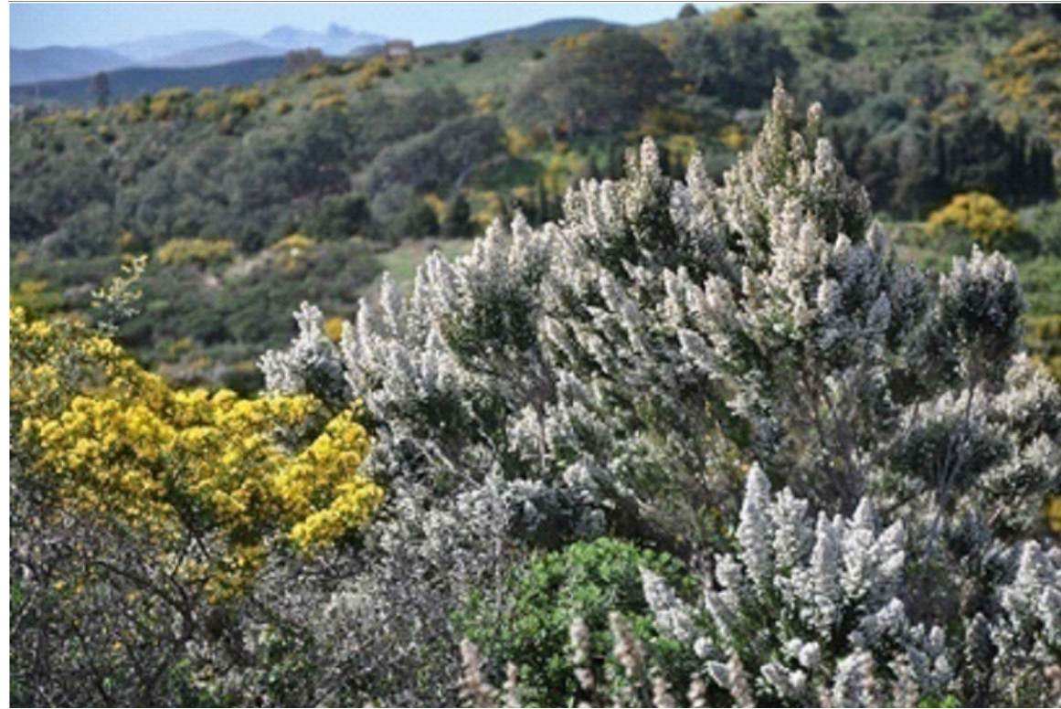
Erica arborea 9 esemplari

A3 Aree caratterizzate da una flora di tipo erbaceo, arbustivo e arboreo esprimibile dall'area target, attraverso la quale si mira a fornire una copertura vegetale uniforme.