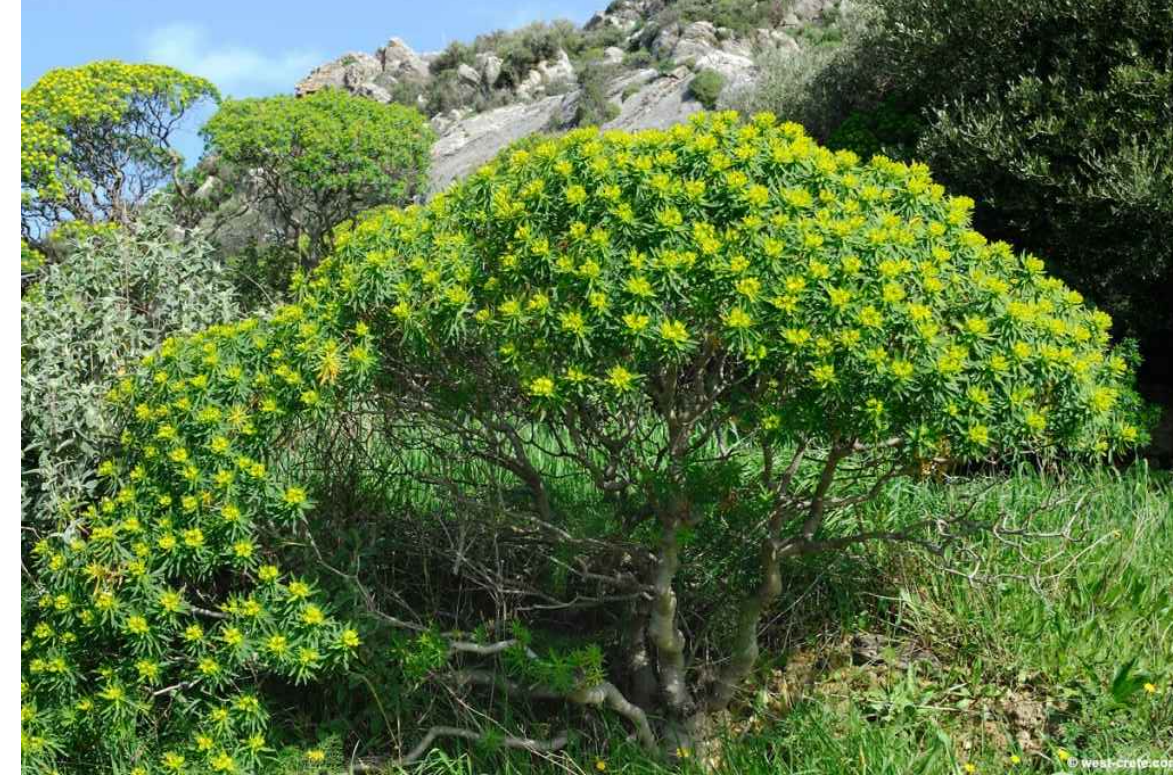
Euphorbia dendroides 5 esemplari