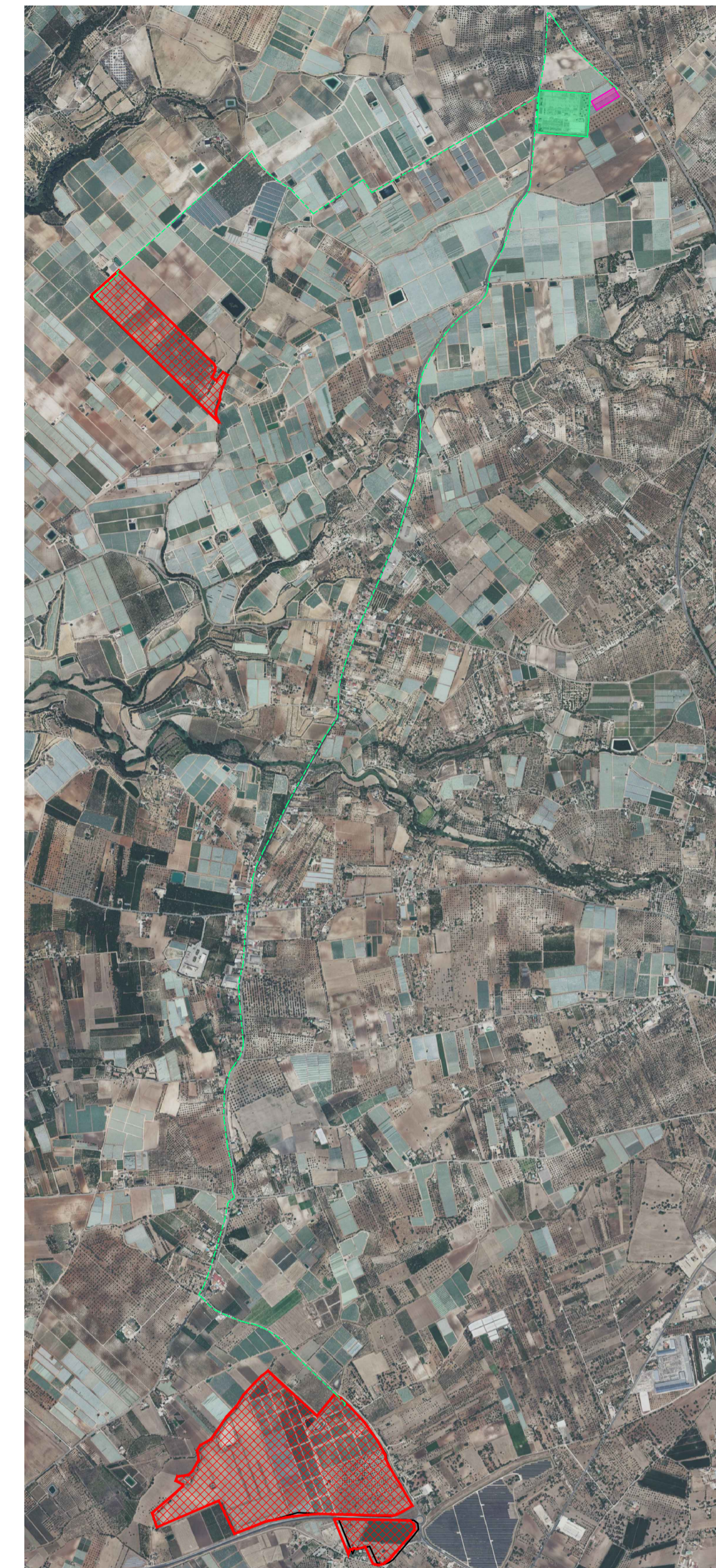
KEY-PLAN GENERALE (1:25.000)