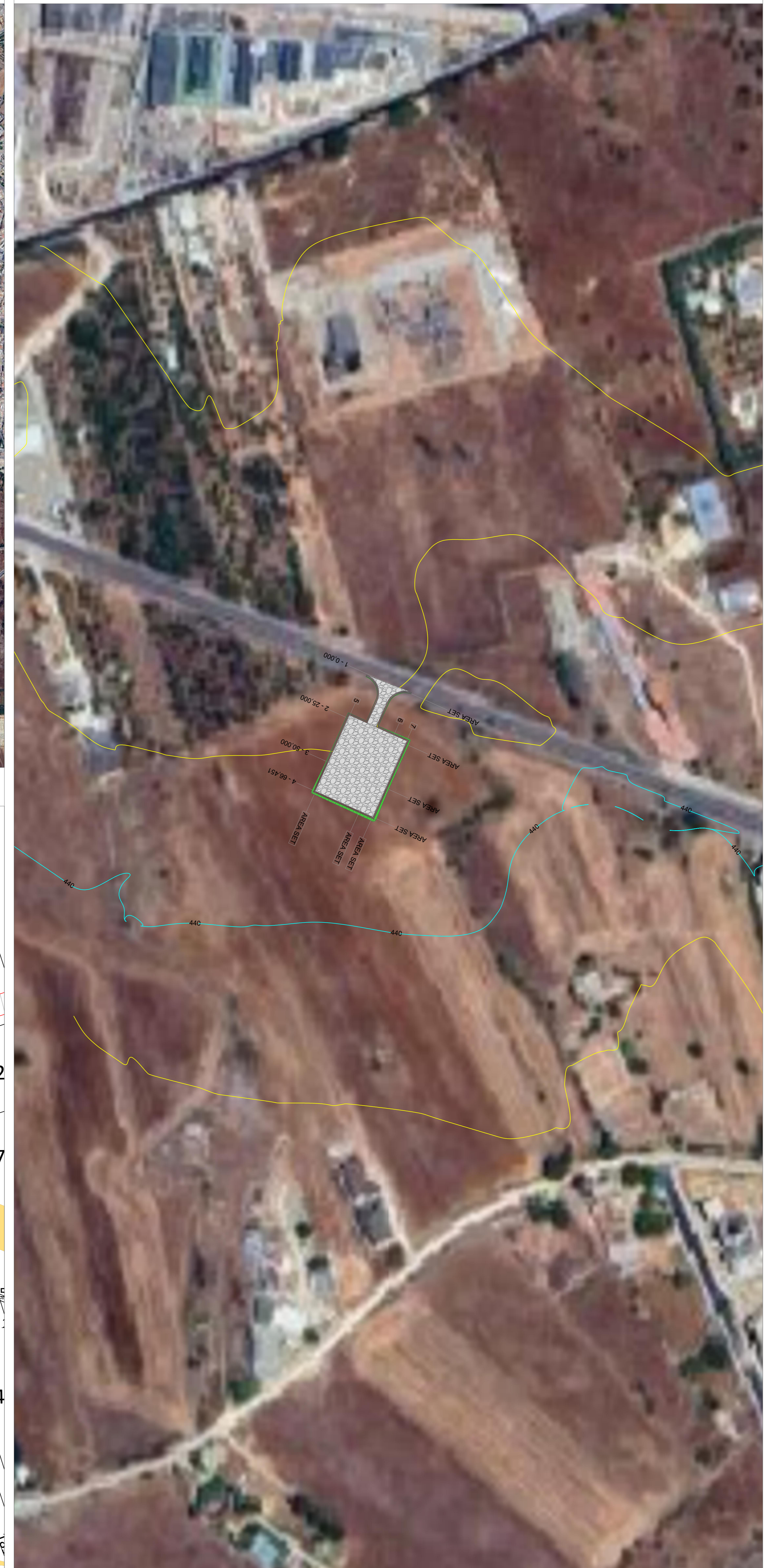
Planimetria Particolareggiata su base Ortofoto - scala 1.1000