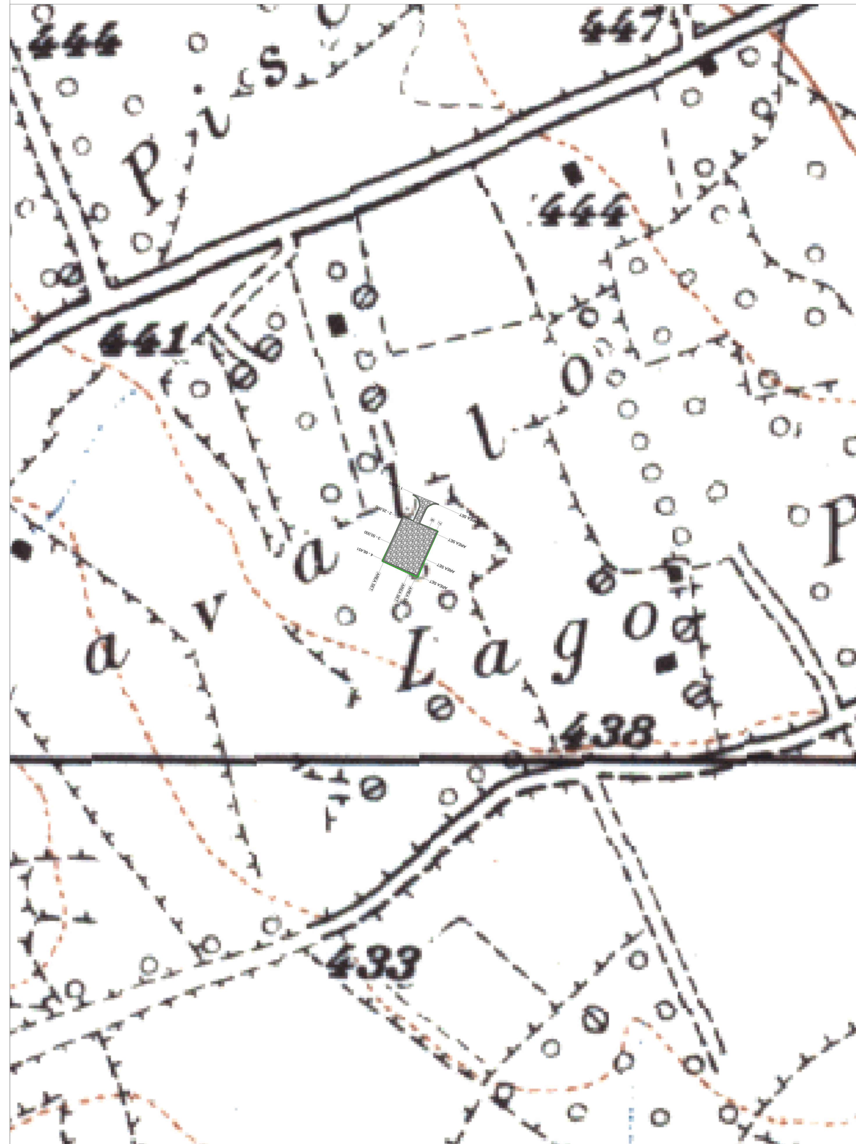
Planimetria Particolareggiata su base Igm - scala 1.2000