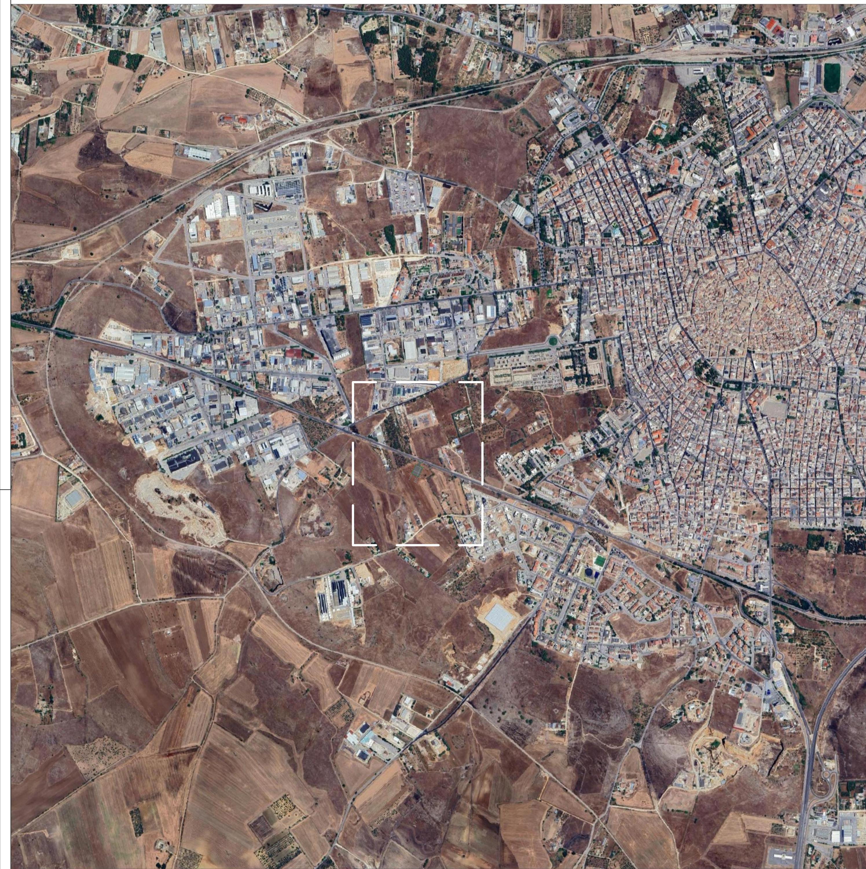
Inquadramento su base Ortofoto - scala 1.10000