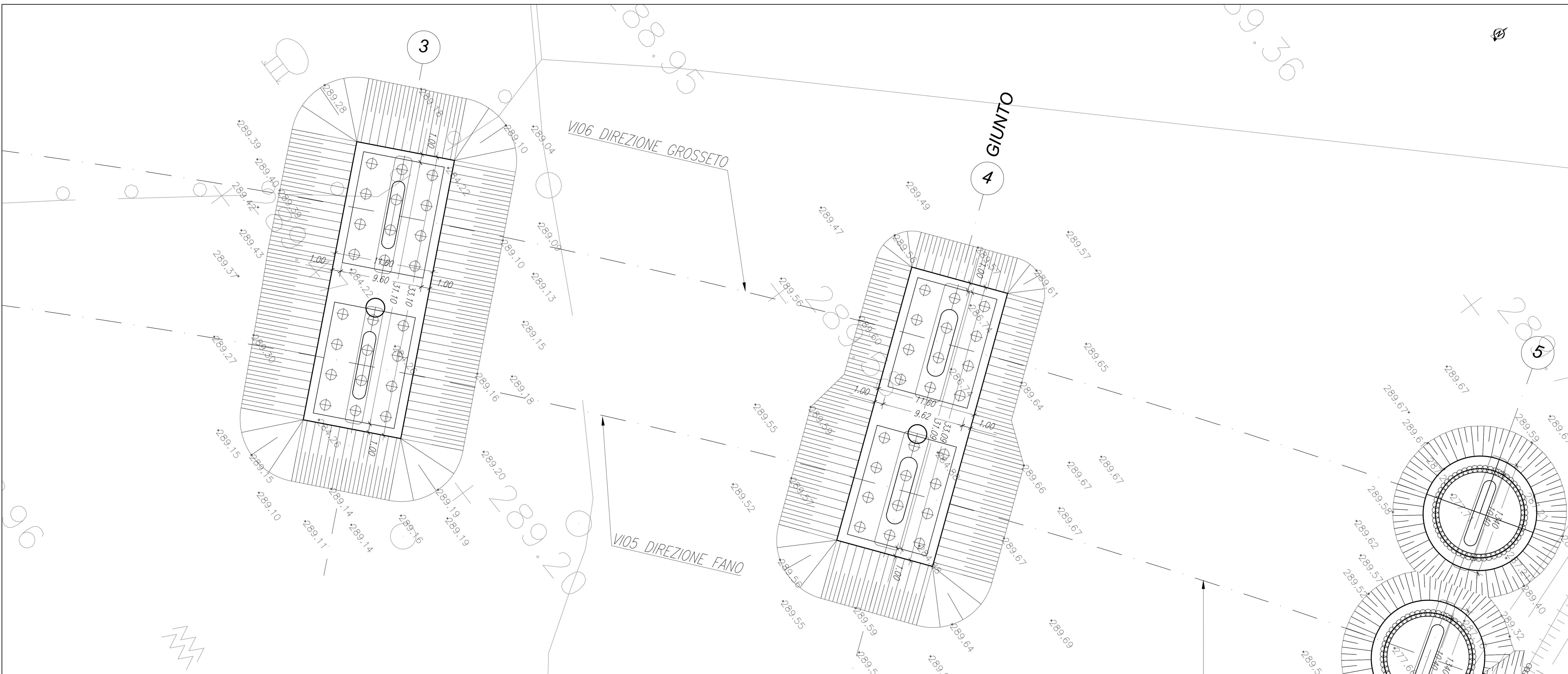
Pianta Scavi - Pila 3 e Pila 4 - Scala 1:200

NOTA: Durante lo scavo e l'esecuzione delle fondazioni è previsto l'uso di WELL-POINT finalizzati all'abbassamento della falda al disotto del piano di scavo stesso.