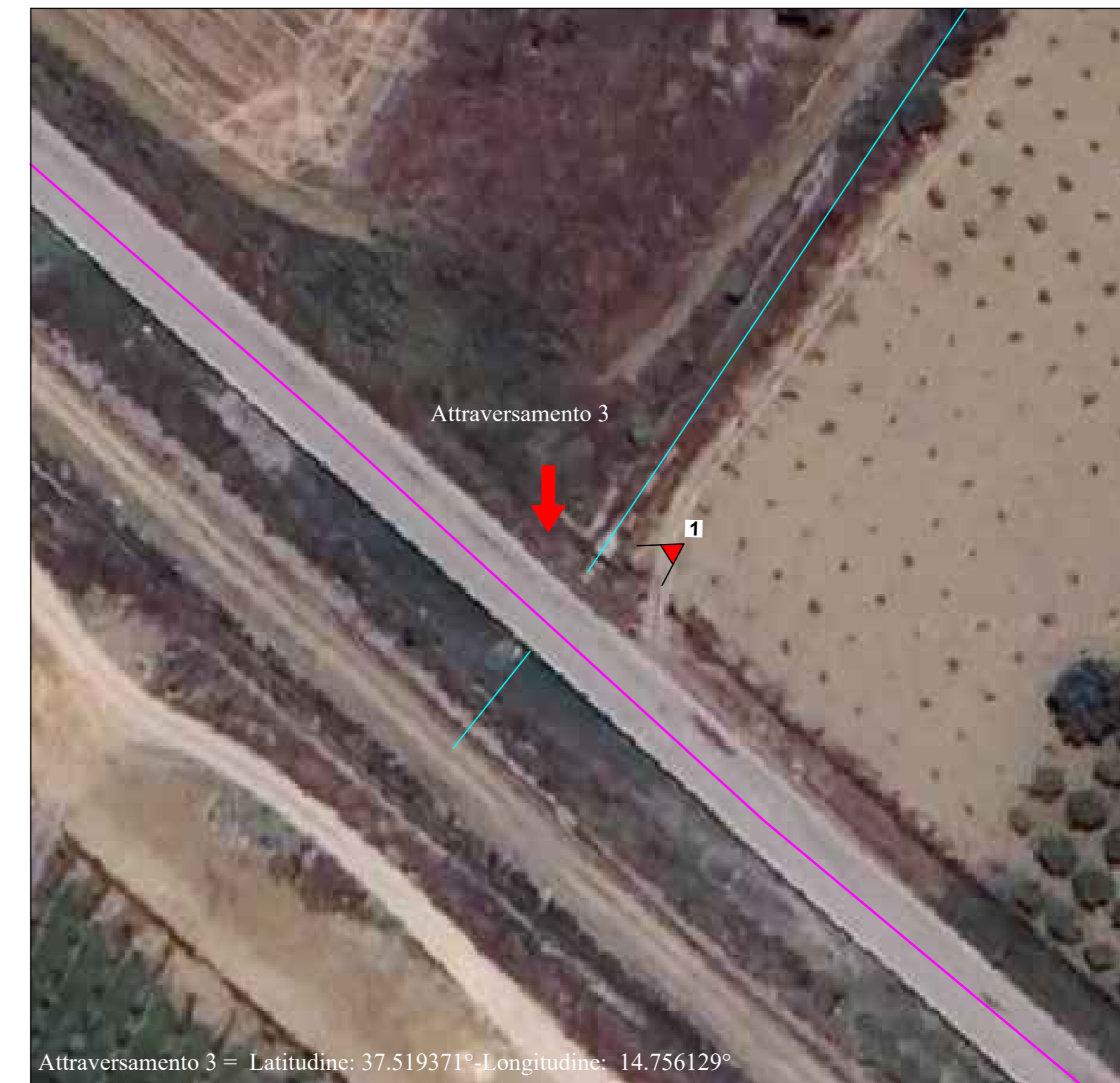
Attraversamento 3 - Latitudine: 37.519371° - Longitudine: 14.756129° UBICAZIONE ATTRAVERSAMENTO 3 SU ORTOFOTO SCALA 1:500