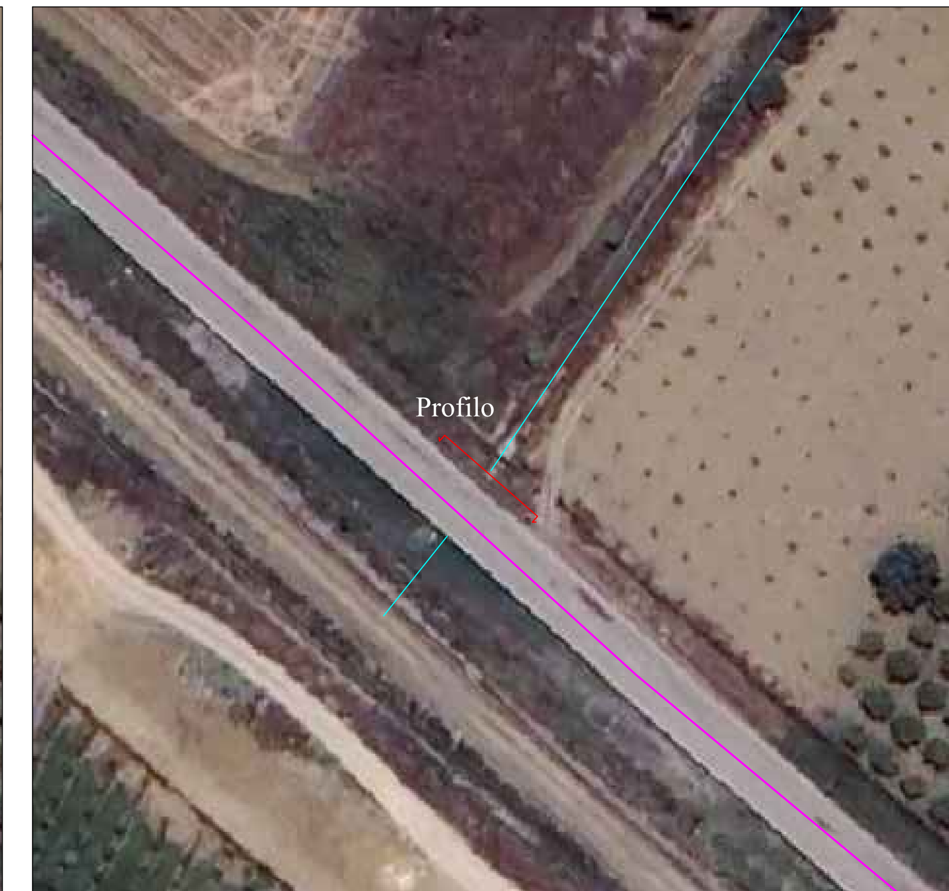
UBICAZIONE PROFILO SU ORTOFOTO SCALA 1:500