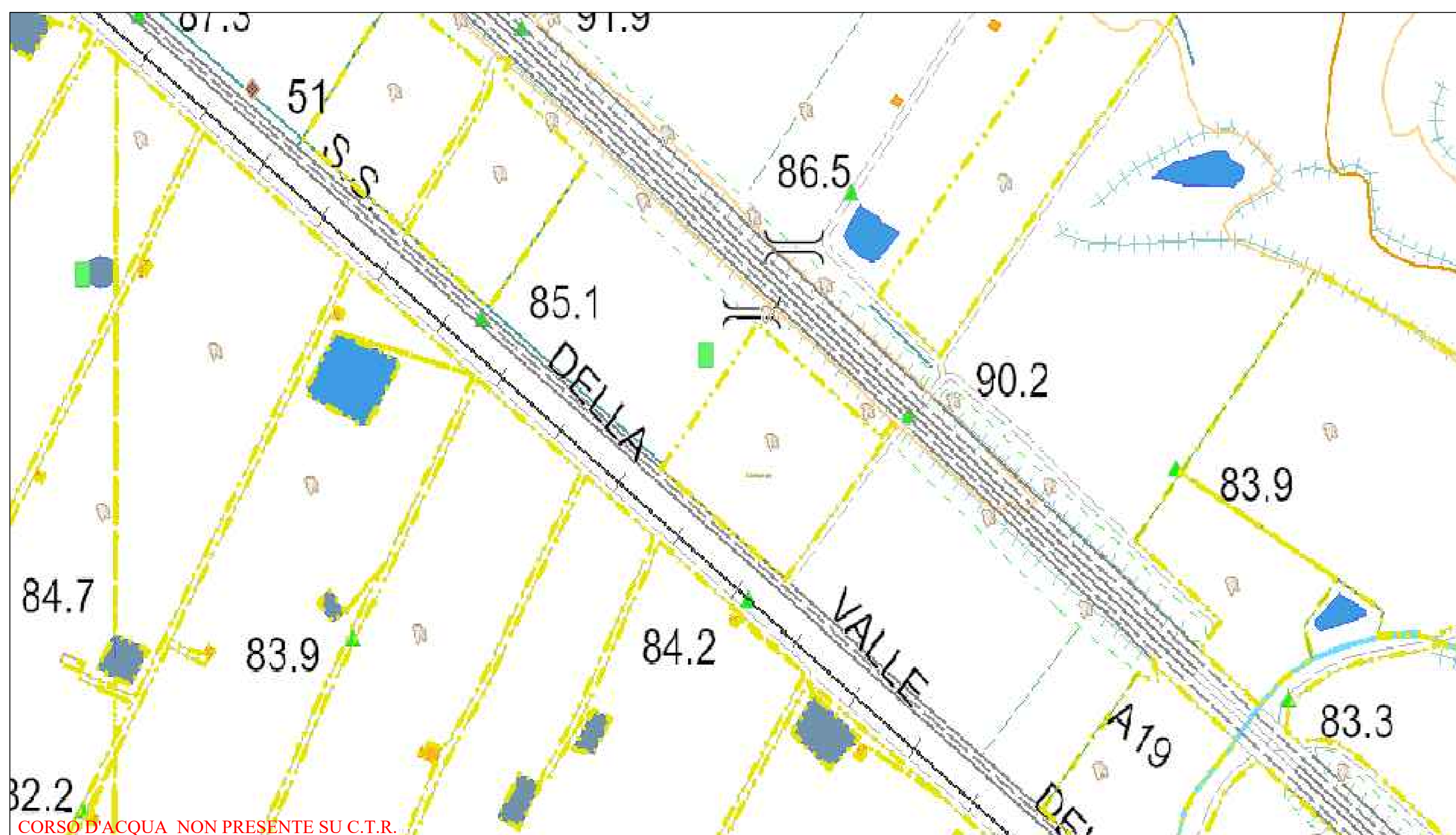
UBICAZIONE ATTRAVERSAMENTO 3 SU C.T.R. SCALA 1:1.000