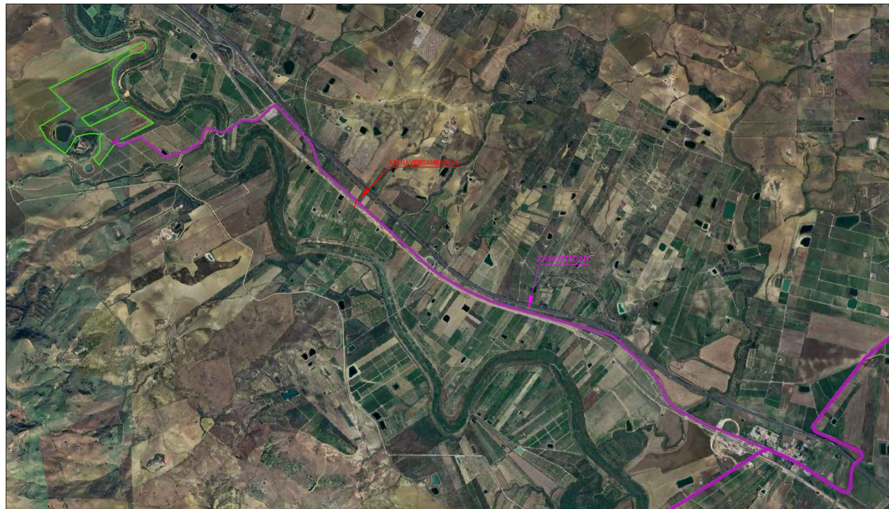
STRALCIO ORTOFOTO SCALA 1:20.000