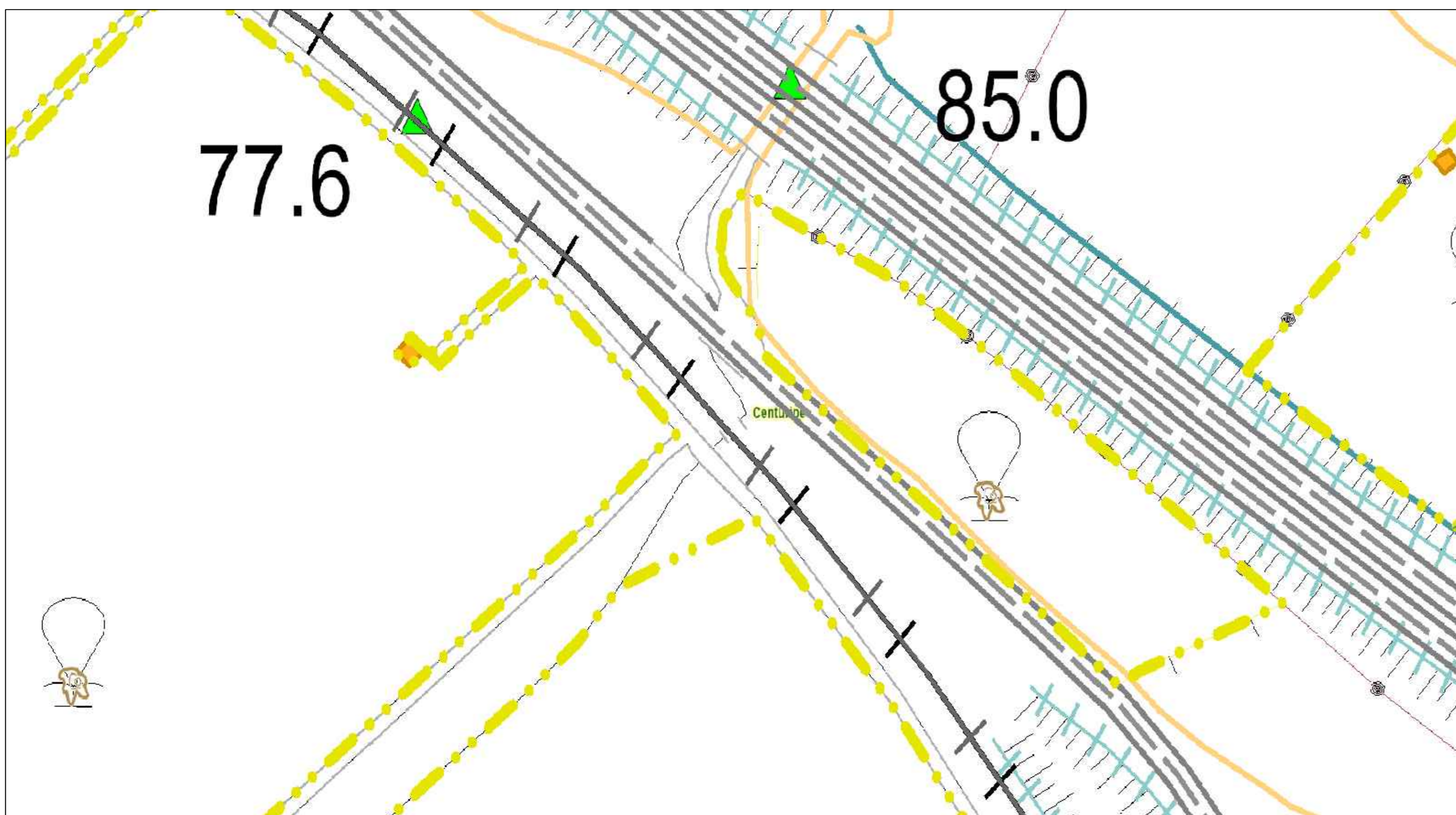
UBICAZIONE ATTRAVERSAMENTO 7 SU C.T.R. SCALA 1:1.000