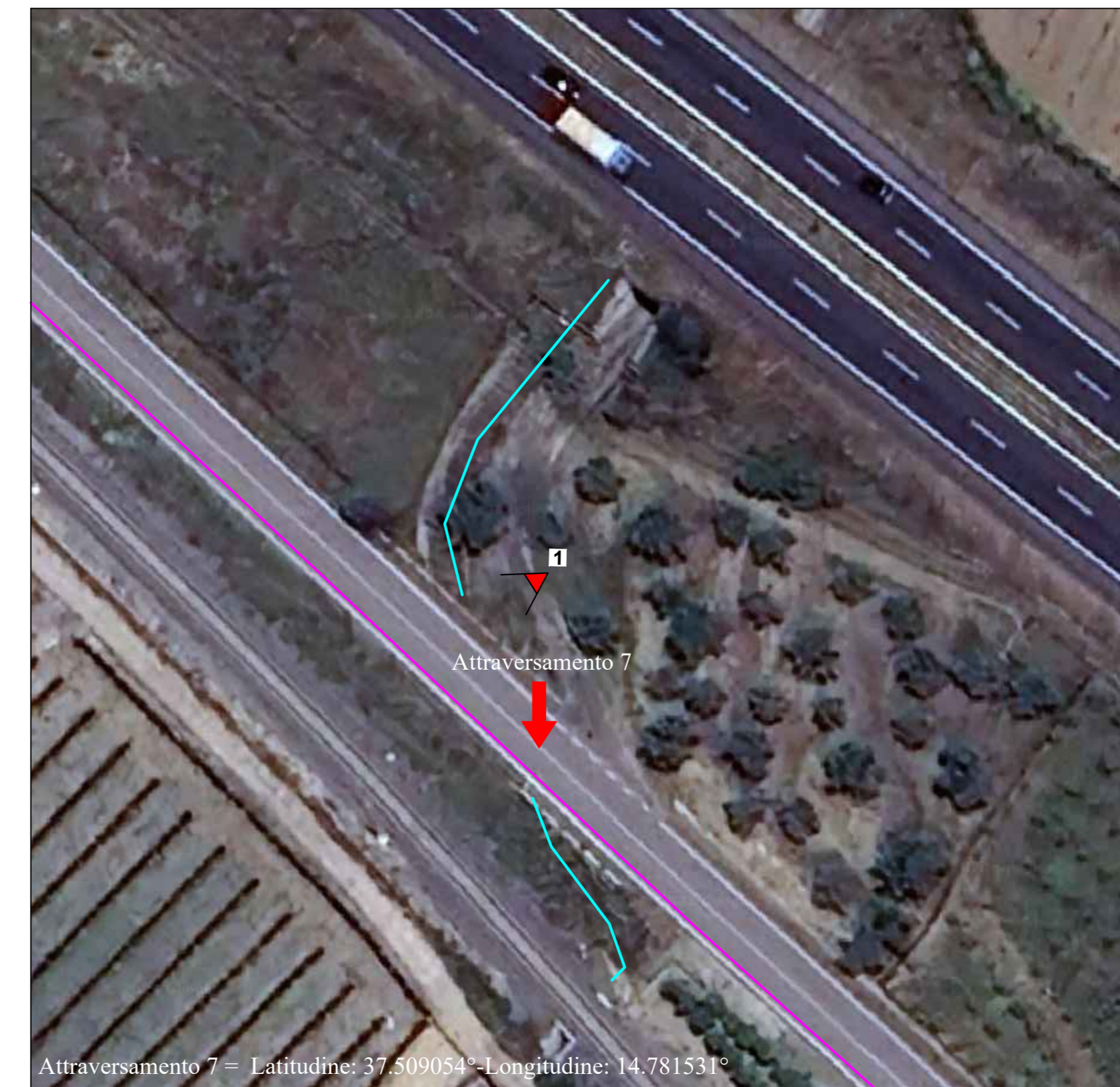
Attraversamento 7 = Latitudine: 37.509054 - Longitudine: 14.781531 UBICAZIONE ATTRAVERSAMENTO 7 SU ORTOFOTO SCALA 1:500