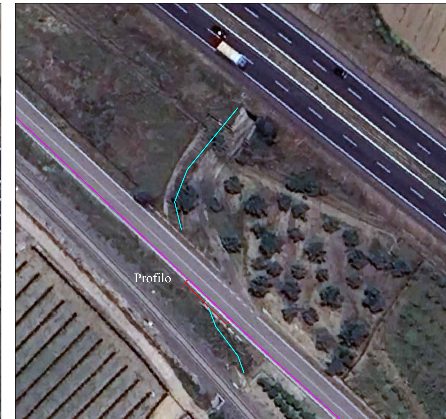
UBICAZIONE PROFILO SU ORTOFOTO SCALA 1:500