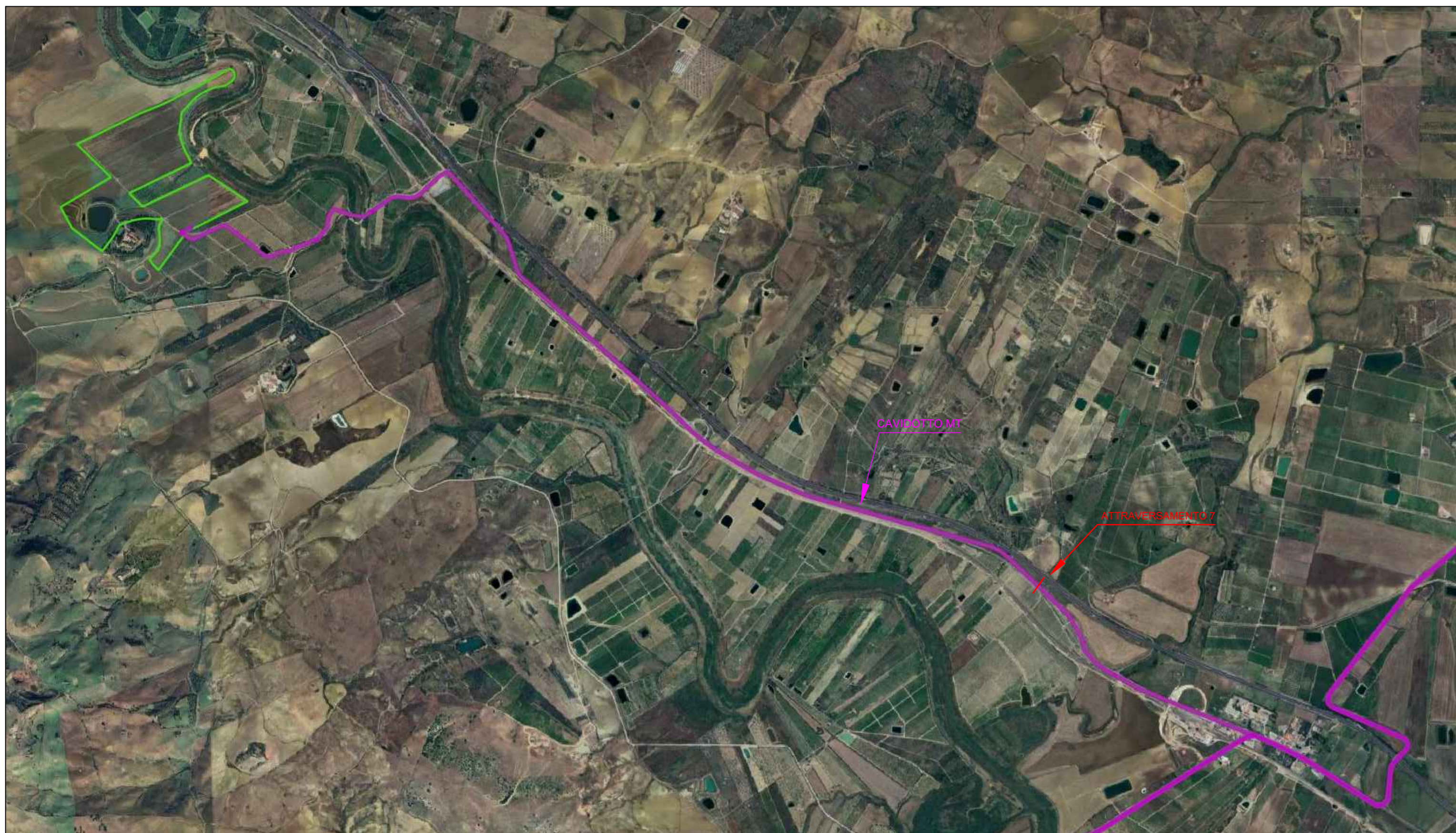
STRALCIO ORTOFOTO SCALA 1:20.000