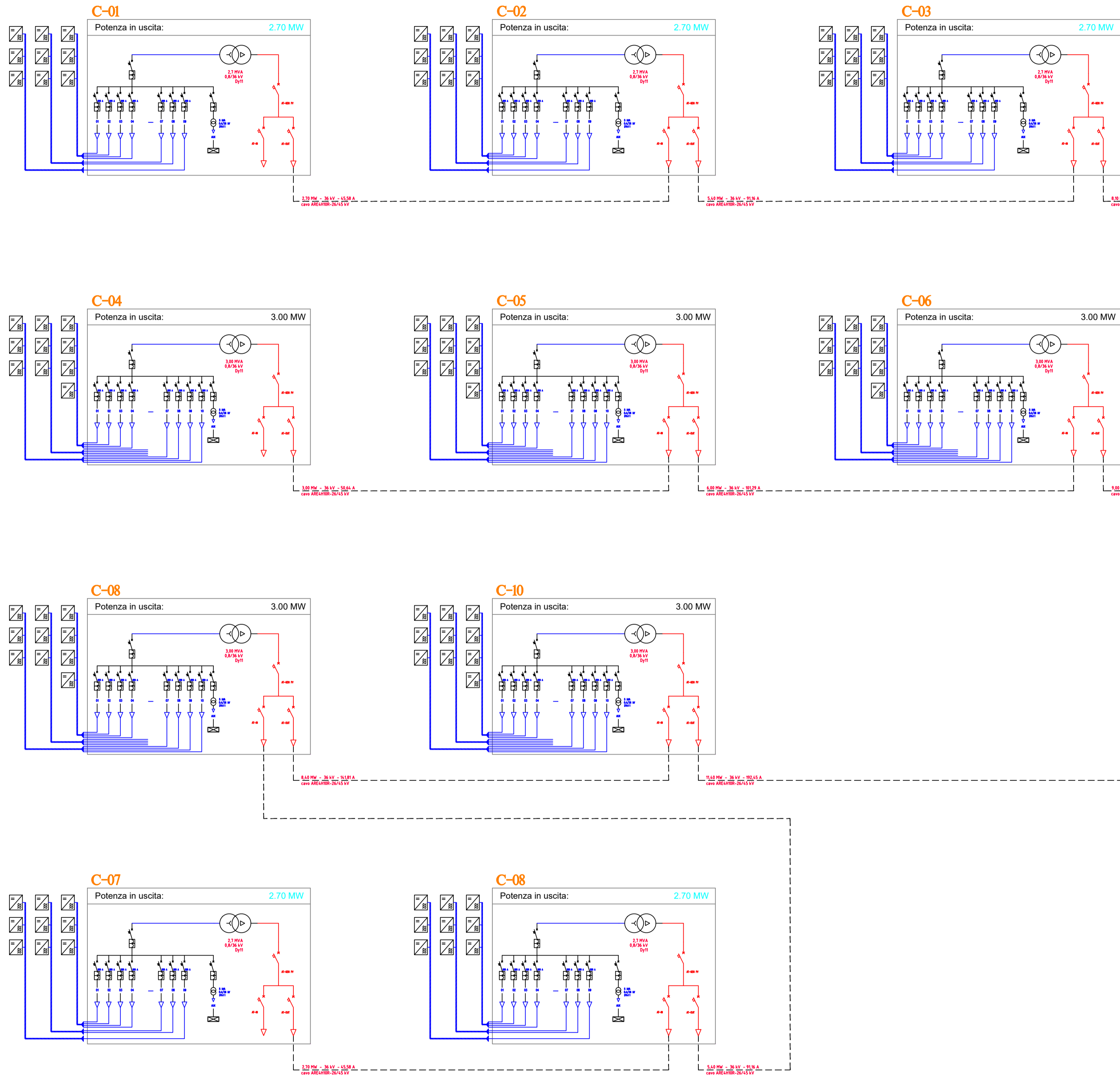
SCHEMA AREE ELETTRICHE E LINEE INTERNE IN AT