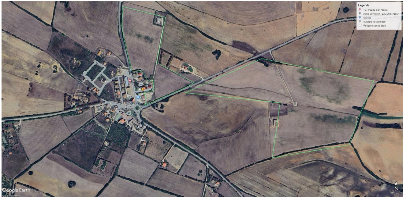
Foto aerea dell'area di intervento (Ortofoto 2023)

L'area interessata ricade interamente nel territorio del comune di Stintino, nella provincia di Sassari in località "Pozzo San Nicola"