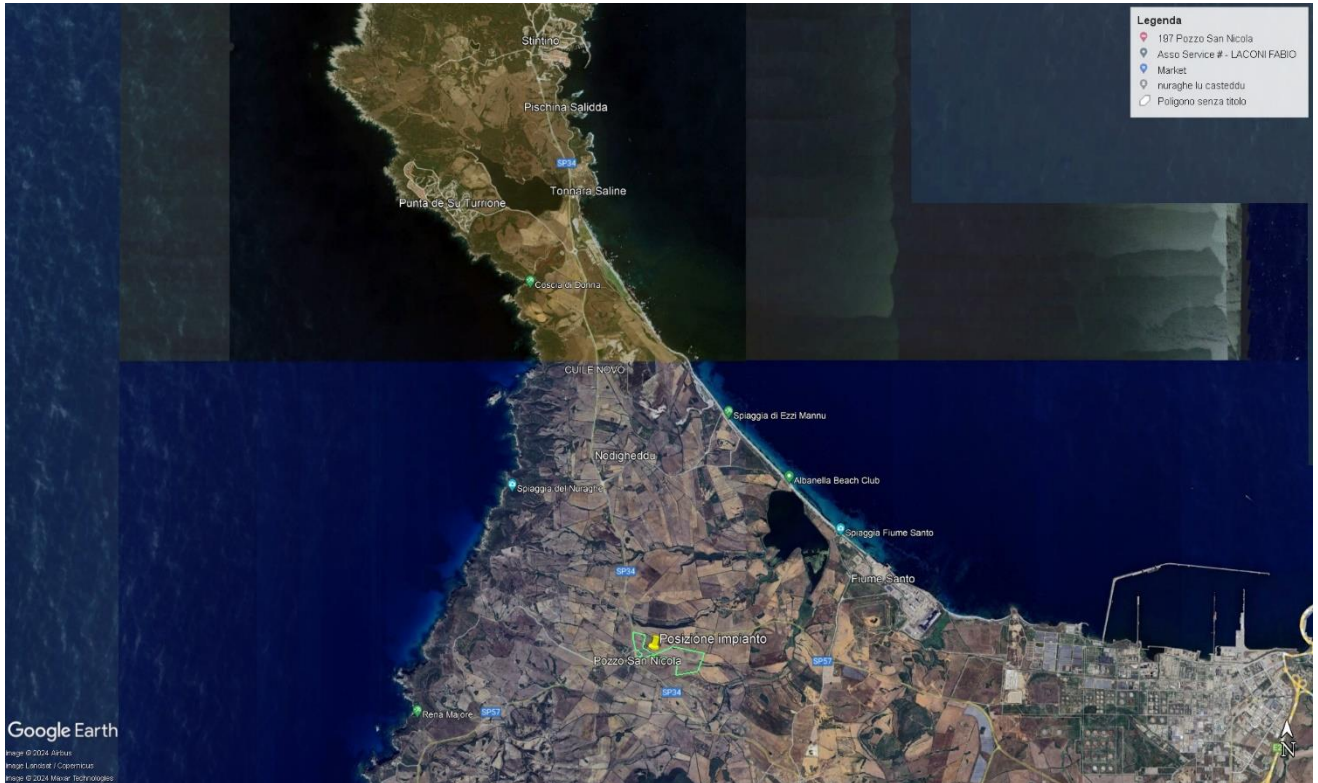
Figura 3 – Inquadramento territoriale dell'area di impianto su Ortofoto da Google Earth Pro (delimitata in verde)

A livello catastale l'impianto agrivoltaico si identifica all'interno del Foglio 18 del Comune di Stintino, particelle 93-125-265-205-206-214-101-103-201-202-203-204, per una superficie totale della proprietà di Ha 32,6031.