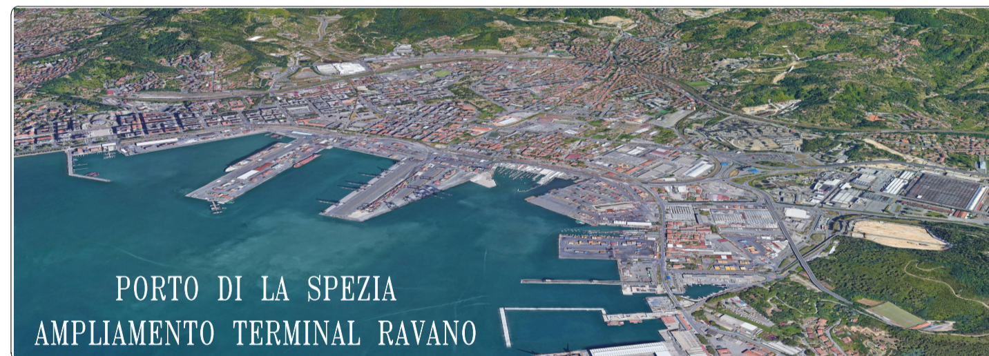
PORTO DI LA SPEZIA AMPLIAMENTO TERMINAL RAVANO