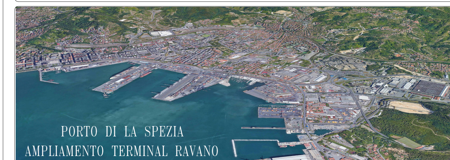
PORTO DI LA SPEZIA AMPLIAMENTO TERMINAL RAVANO