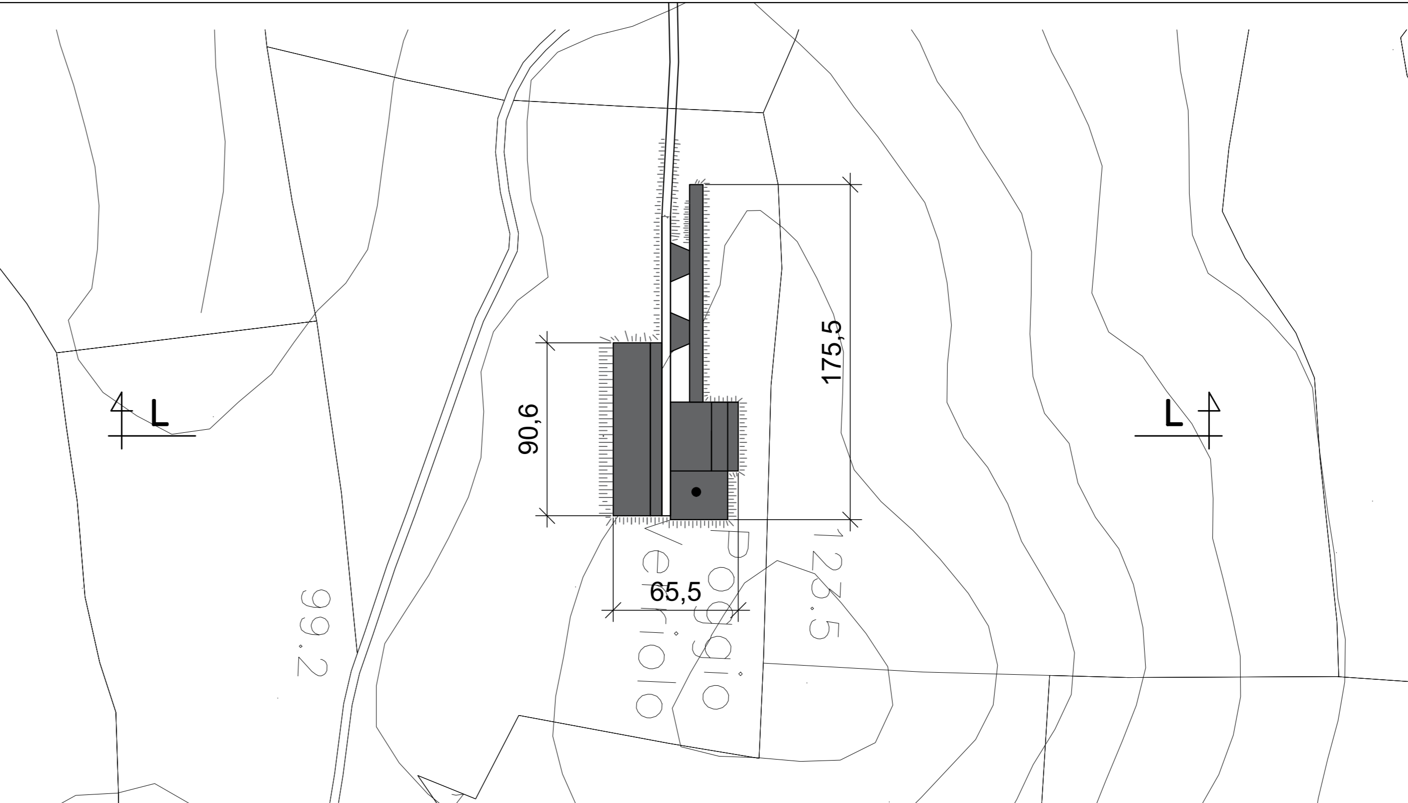
VISTA IN PIANTA PIAZZOLA WGT-10 FASE DI CANTIERE scala 1:200

N.B. TUTTE LE MISURE SONO ESPRESSE IN METRI SE NON DIVERSAMENTE INDICATO