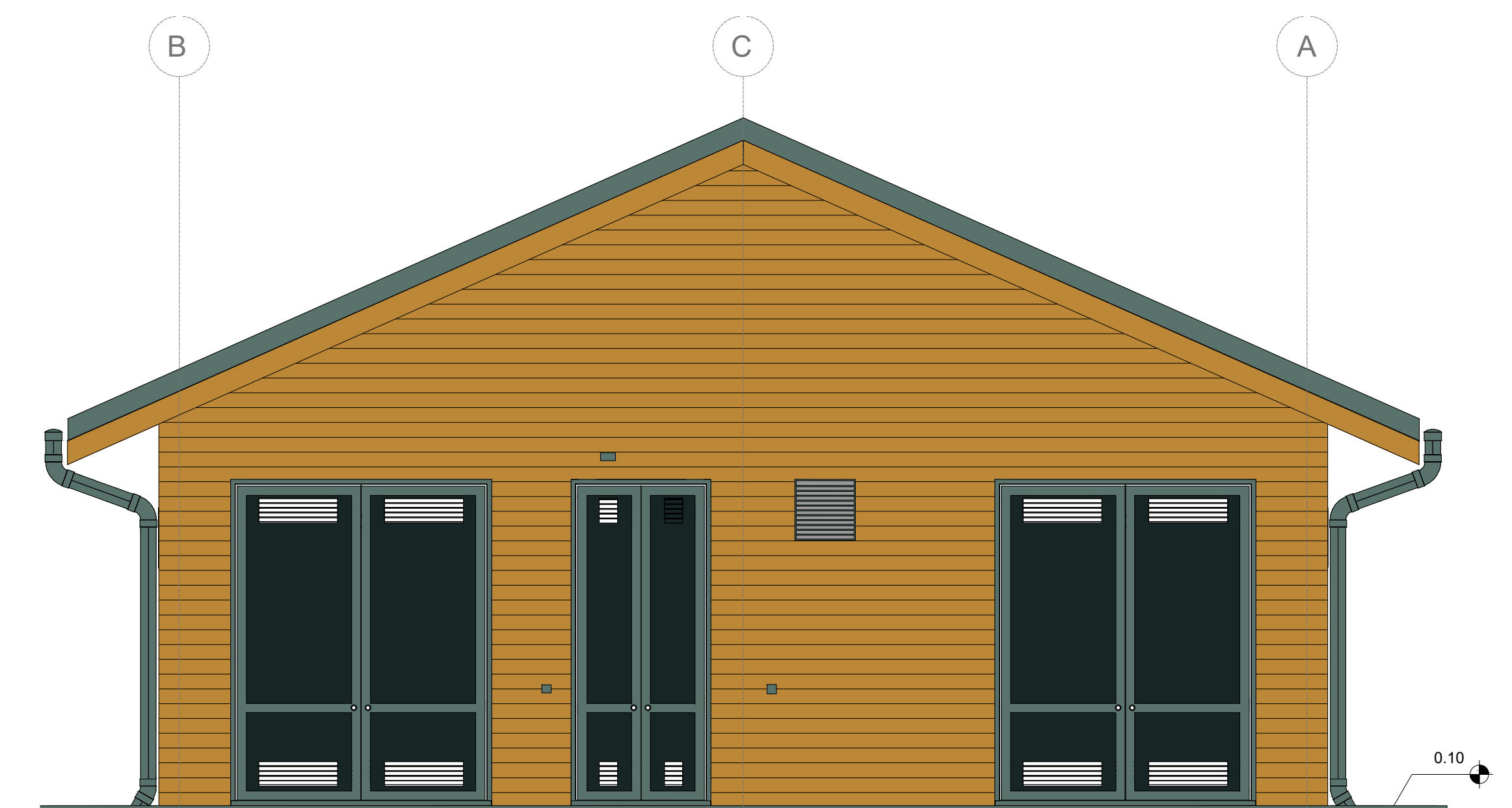
3 Prospecto B 1 : 50