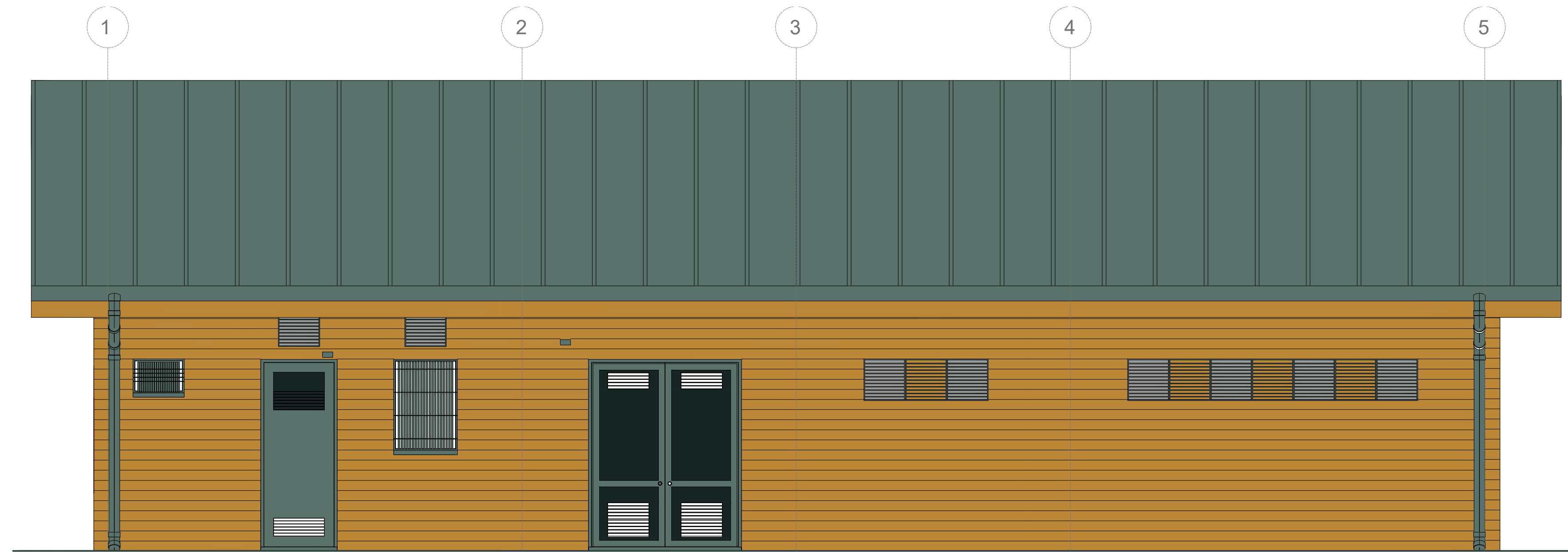
5 Prospecto D 1 : 50