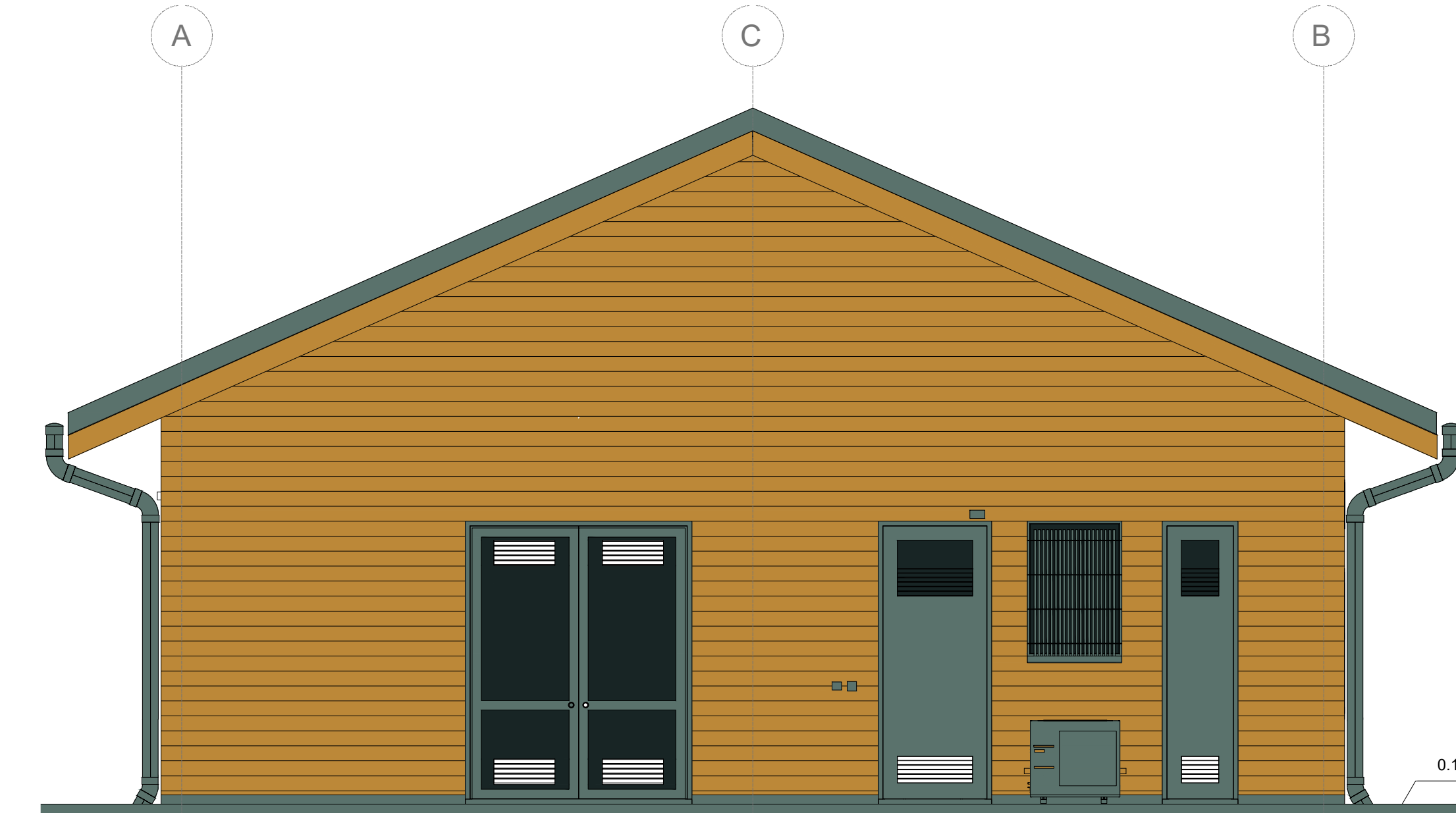
2 Prospecto A 1 : 50