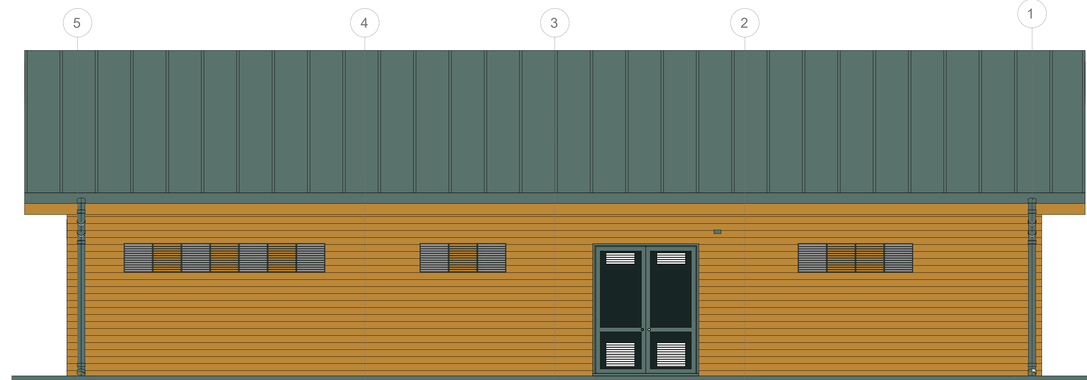
4 Prospecto C 1 : 50