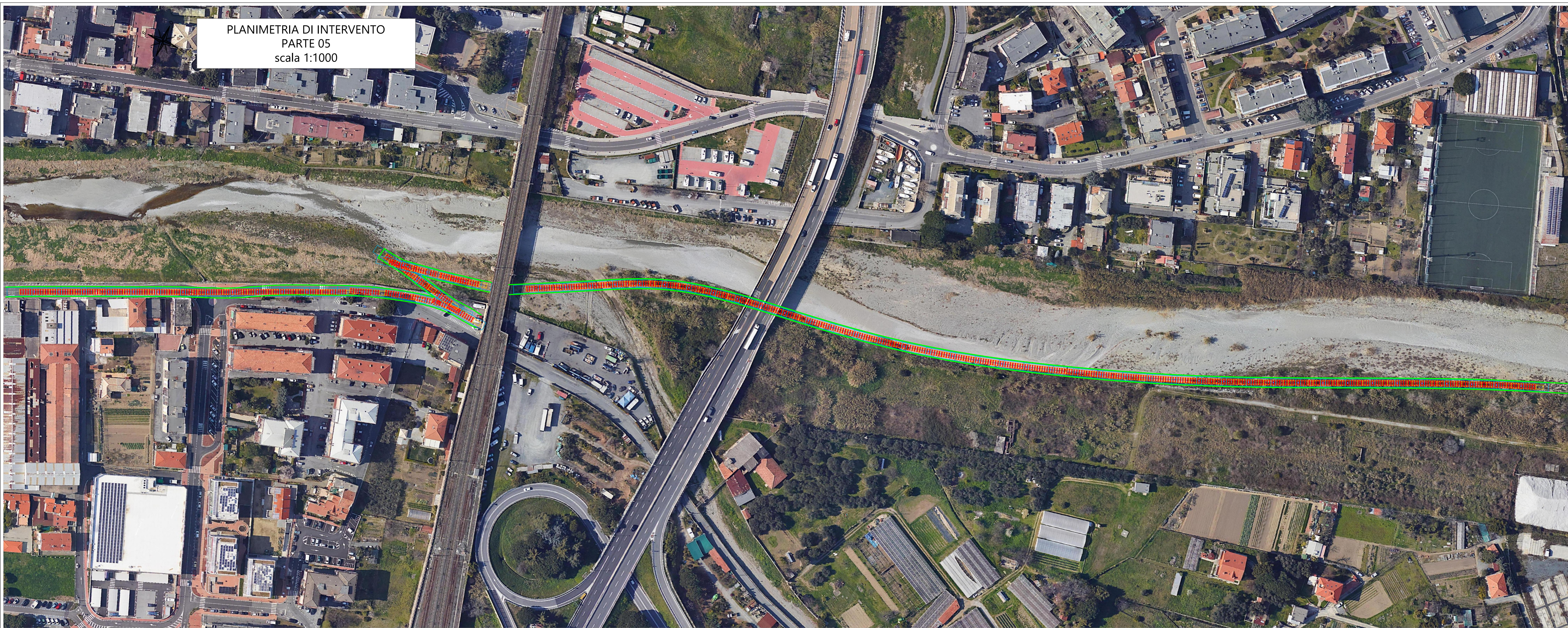
PLANIMETRIA DI INTERVENTO PARTE 05 scala 1:1000