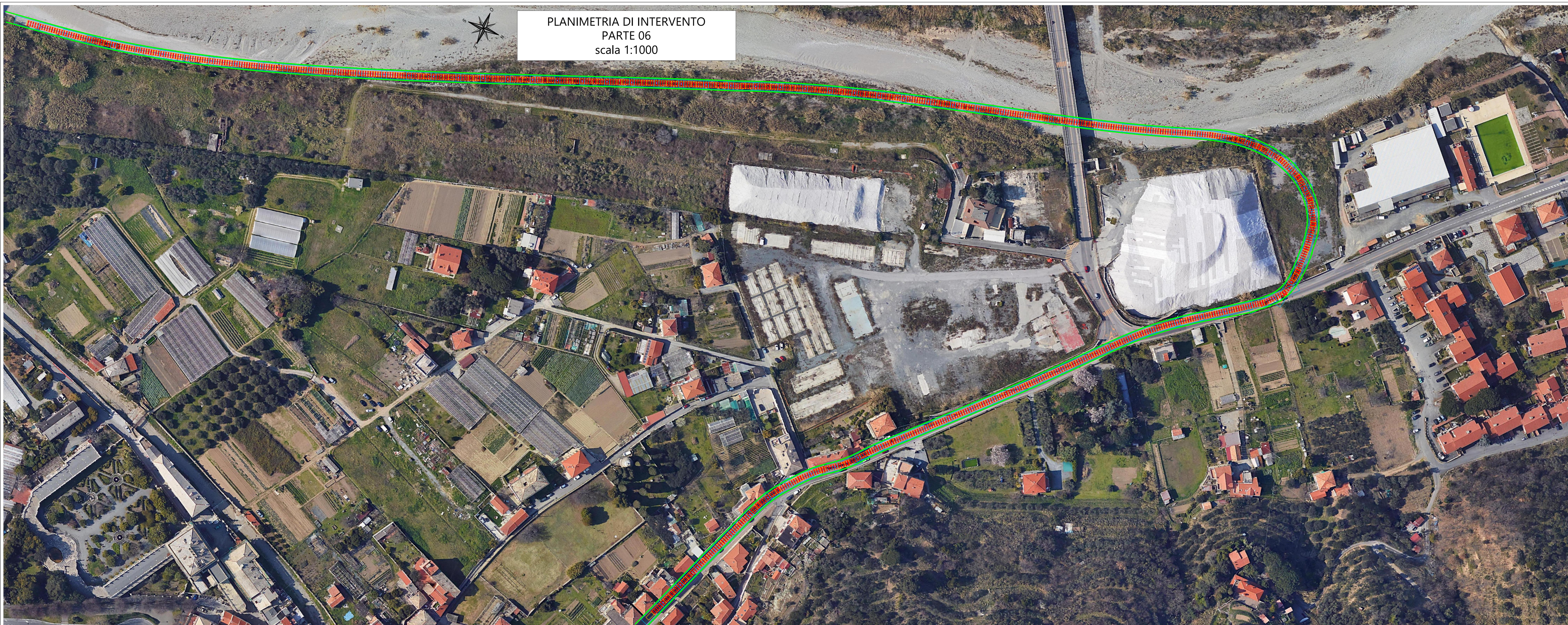
PLANIMETRIA DI INTERVENTO PARTE 06 scala 1:1000