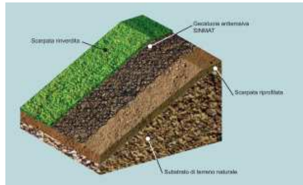
Figura 2 - schema struttura geostuoie

A seguito della fase di cantiere si prevede inoltre di sistemare la viabilità di collegamento, mantenendola sterrata e garantendone la permeabilità, affinché possa essere fruibile anche dai turisti e dagli sportivi che popolano le montagne nel periodo estivo.