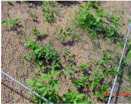
Figura 1 – particolare della vegetazione che cresce attraverso la biostuoia in cocco