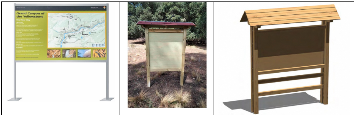
Totem informativi installati sulla nuova piazzola rinverditata