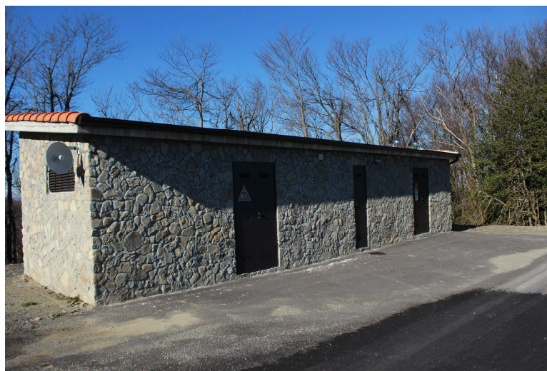
esempio di cabina elettrica mitigata

Le cabine di consegna previste nei pressi dell'aerogeneratore 04, dal punto di vista architettonico, saranno costituite da strutture prefabbricate ai quali saranno applicate opportune misure di mitigazione atte ad inserirle nel contesto ambientale nella maniera meno invasiva possibile.