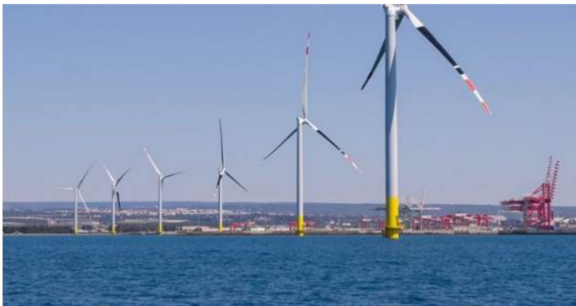
vista del parco eolico realizzato nel porto di Taranto

Benché non sia effettivamente una misura in grado di poter limitare l'impatto visivo del singolo aerogeneratore, tra le misure di mitigazione proposte vi è quella di tinteggiare con vernici ultraviolette di colore nero due delle cinque pale eoliche.