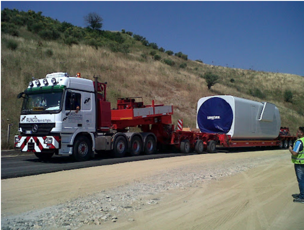
Figura 3 | Trasporto componenti – navicella

Progetto dell'impianto eolico con storage denominato "Capece" della potenza complessiva di 66 MW con storage da 20 MW da realizzare nei Comuni di Francavilla Fontana, San Vito dei Normanni, San Michele Salentino e Latiano (BR).