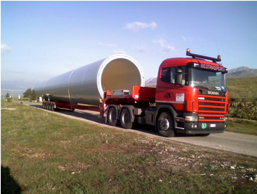
Figura 2 | Trasporto componenti – torre eolica

Progetto dell'impianto eolico con storage denominato "Capece" della potenza complessiva di 66 MW con storage da 20 MW da realizzare nei Comuni di Francavilla Fontana, San Vito dei Normanni, San Michele Salentino e Latiano (BR).