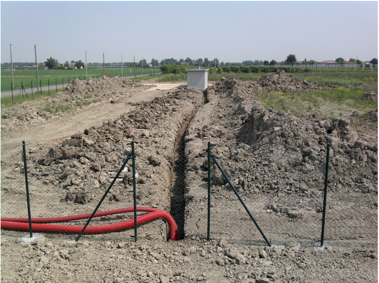
Figura 6 | Tipico di realizzazione di cavidotto interrato

Progetto dell'impianto eolico con storage denominato "Capece" della potenza complessiva di 66 MW con storage da 20 MW da realizzare nei Comuni di Francavilla Fontana, San Vito dei Normanni, San Michele Salentino e Latiano (BR).