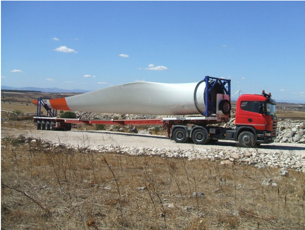
Figura 1 | Trasporto componenti - blade eolica

Per il parco eolico "Capece", si ritengono sufficienti circa 60 giorni lavorativi per la realizzazione di queste opere, bisogna comunque specificare che i lavori di montaggio per parte dell'impianto, visto la distribuzione planimetrica e le poche interferenze tra le varie fasi di lavoro, può incominciare anche prima dell'ultimazione dei lavori di realizzazione delle viabilità e delle piazzole.