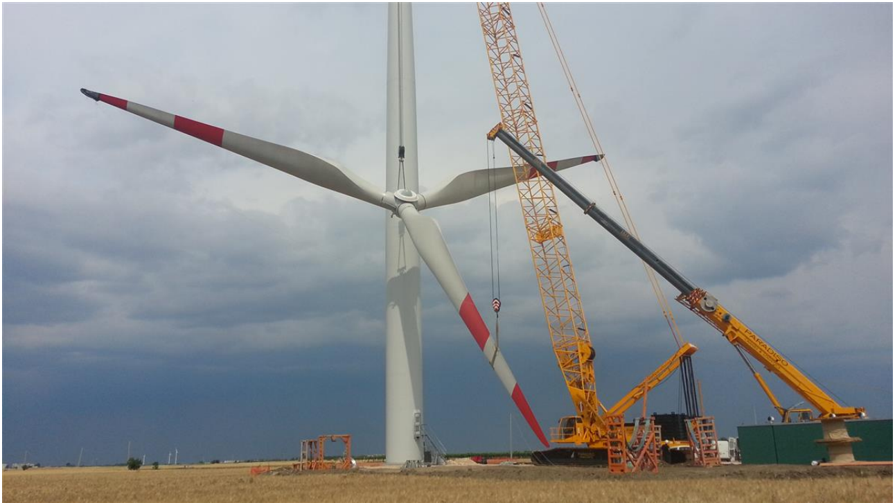
Figura 5 | Operazioni di montaggio aerogeneratori

Progetto dell'impianto eolico con storage denominato "Capece" della potenza complessiva di 66 MW con storage da 20 MW da realizzare nei Comuni di Francavilla Fontana, San Vito dei Normanni, San Michele Salentino e Latiano (BR).