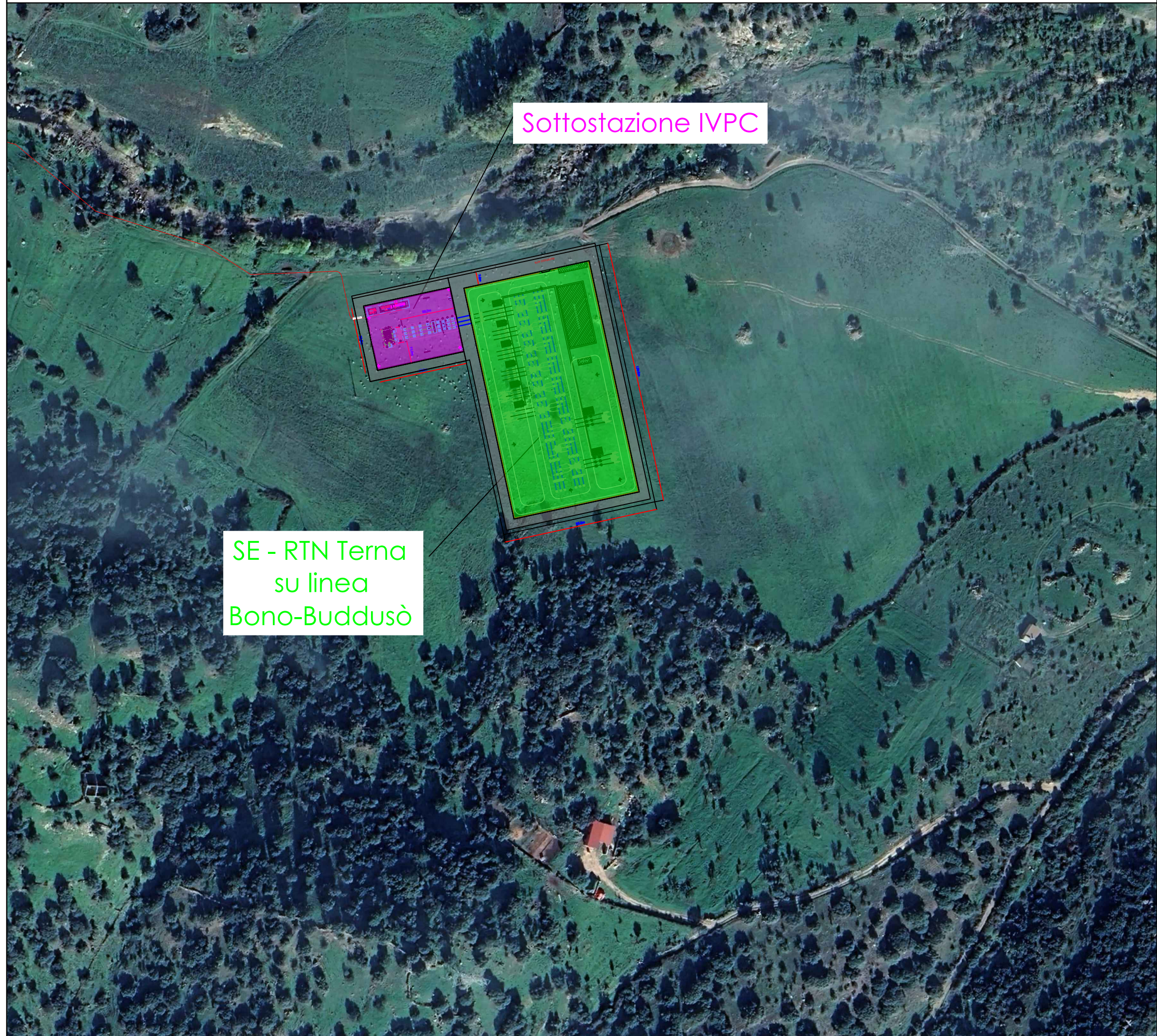
Inquadramento su ortofoto - scala 1:2.000