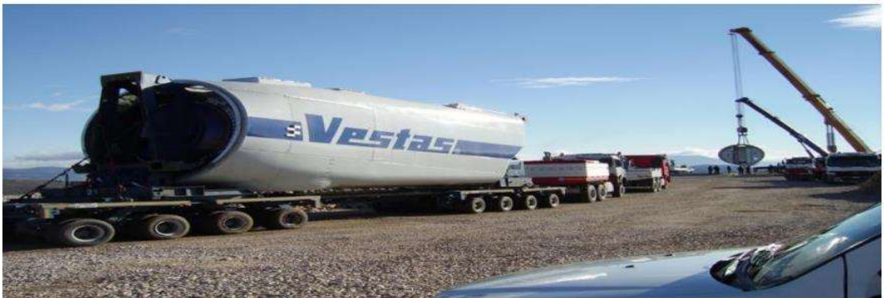
Mezzi per il trasporto della navicella.

Si ribadisce quindi, anche in questa sede, che non è presente uno studio dettagliato inerente le problematiche e la trattazione dei risvolti naturalistici in termini di conservazione degli habitat che potrebbe avere la creazione di una viabilità per il parco eolico in oggetto.