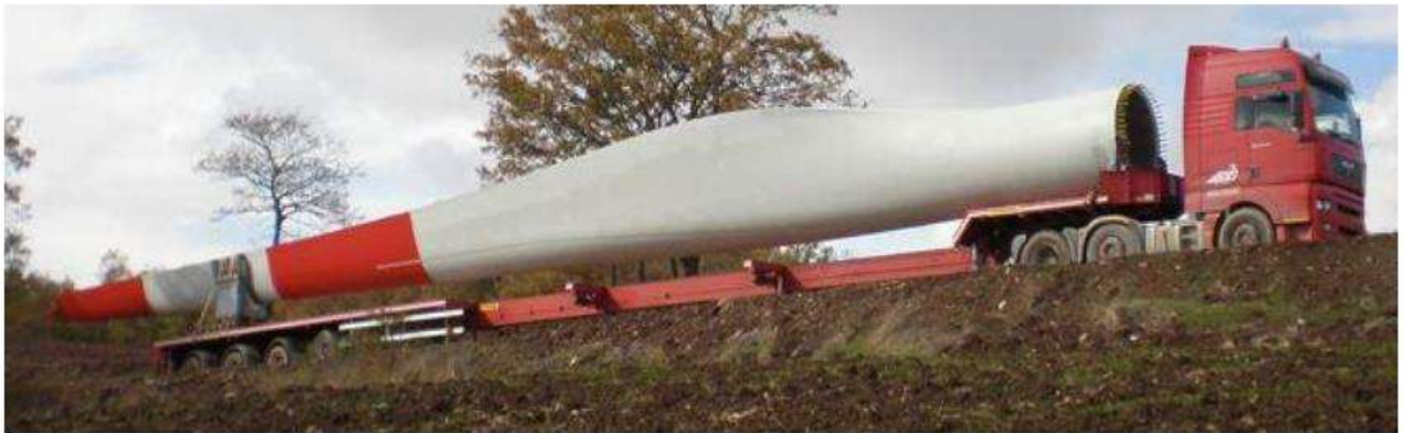
Mezzi per il trasporto della pala.