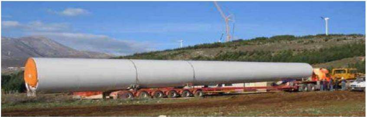
Mezzi per il trasporto di sezioni di torre.