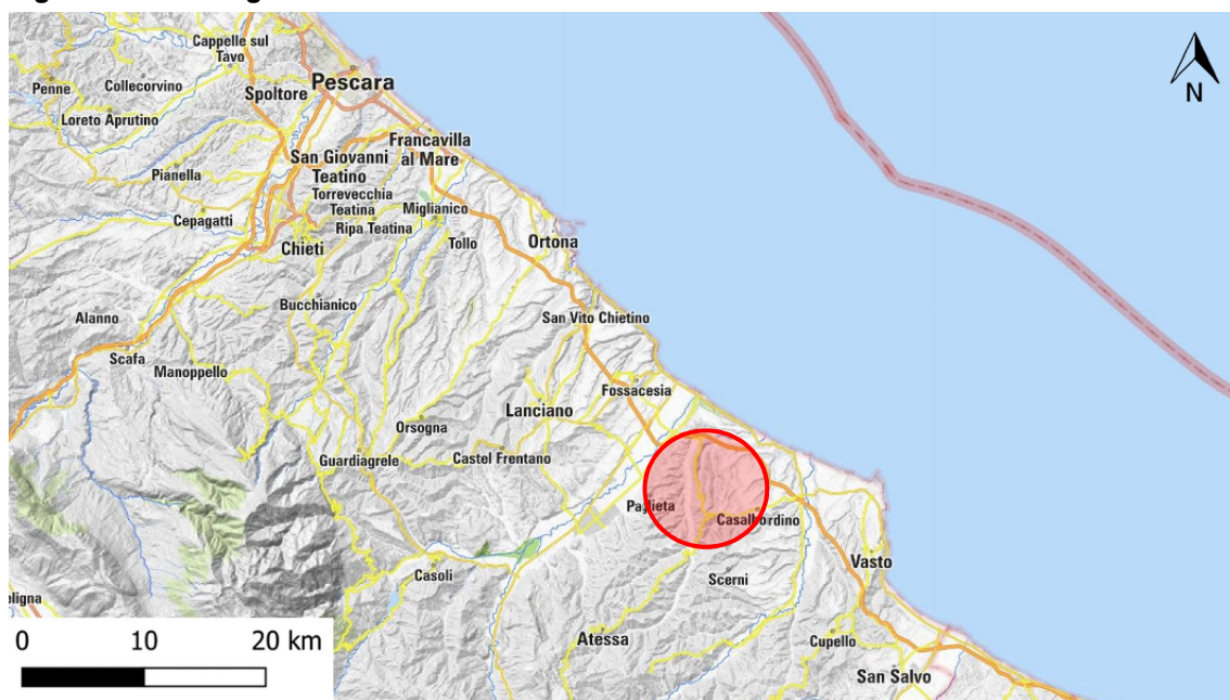
Figura 2-1 – Corografia con localizzazione dell'area di intervento cerchiata in rosso

Nella figura sottostante (Figura 2-2) si individuano le aree di intervento su foto aerea in progetto, in rosso, e quelli da dismettere in verde: come si può notare, le nuove condotte si sviluppano quasi completamente in parallelismo ai metanodotti esistenti, sfruttandone il corridoio tecnologico. I territori attraversati, prevalentemente collinari, si trovano a distanze viabili tra 5 e 10 km dal mare. L'uso del suolo evidenzia la predominanza di aree boscate e di colture agricole; le coltivazioni più diffuse sono gli uliveti ed i vigneti.