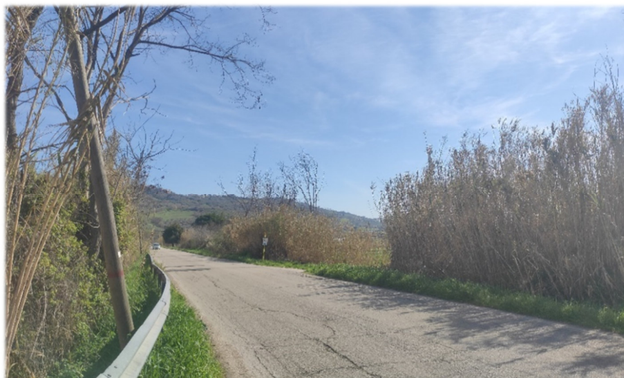
Figura 3-1 - Canneto di Arundo donax interferito, in comune di Torino di Sangro

Vegetazione sinantropica a dominanza di Arundo donax , disposta sui terreni umidi e freschi lungo gli argini di fiumi, torrenti e fossati, zone sabbiose ripariali, margini di campi coltivati, spesso legata a condizioni di frequente disturbo antropico.