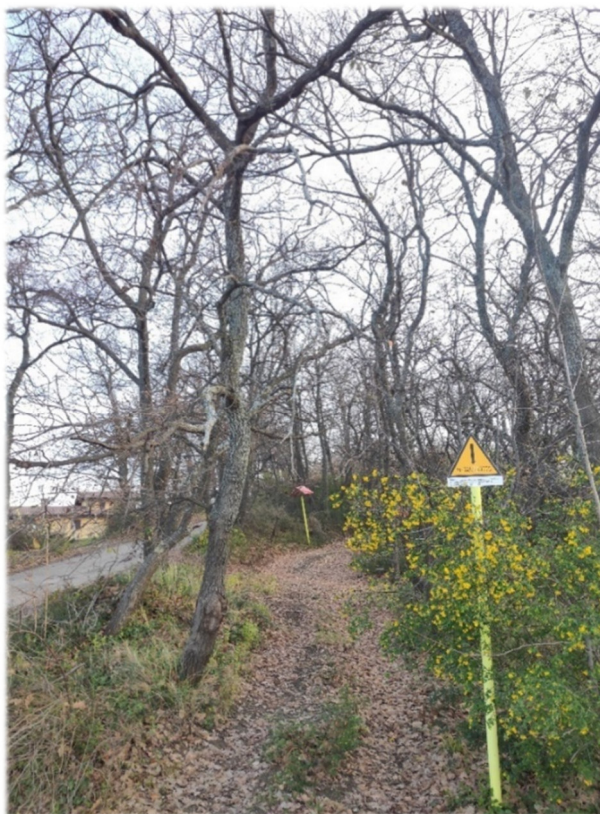
Figura 3-2 - Bosco di roverella interferito, a Torino di Sangro, dal tracciato in dismissione

Si tratta di boschi mesoxerofili a dominanza di roverella ( Quercus pubescens ), associata ad uno strato arbustivo costituito in prevalenza da coronilla ( Coronilla emerus ).