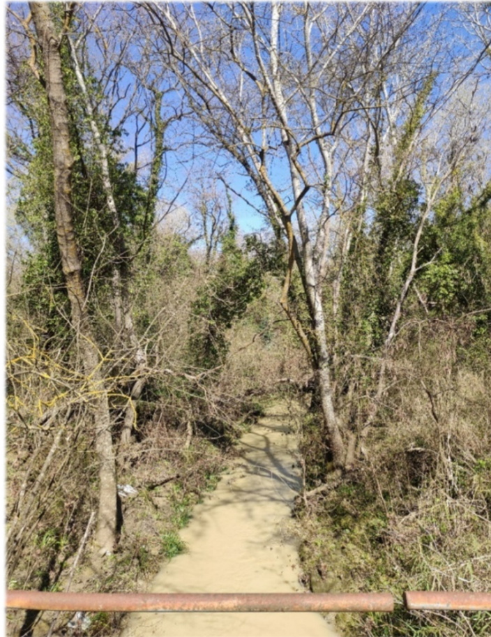
Figura 3-4 - Bosco ripariale interferito dai tracciati in progetto e dismissione, ricadente in comune di Torino di Sangro, situato in prossimità del fiume Osento