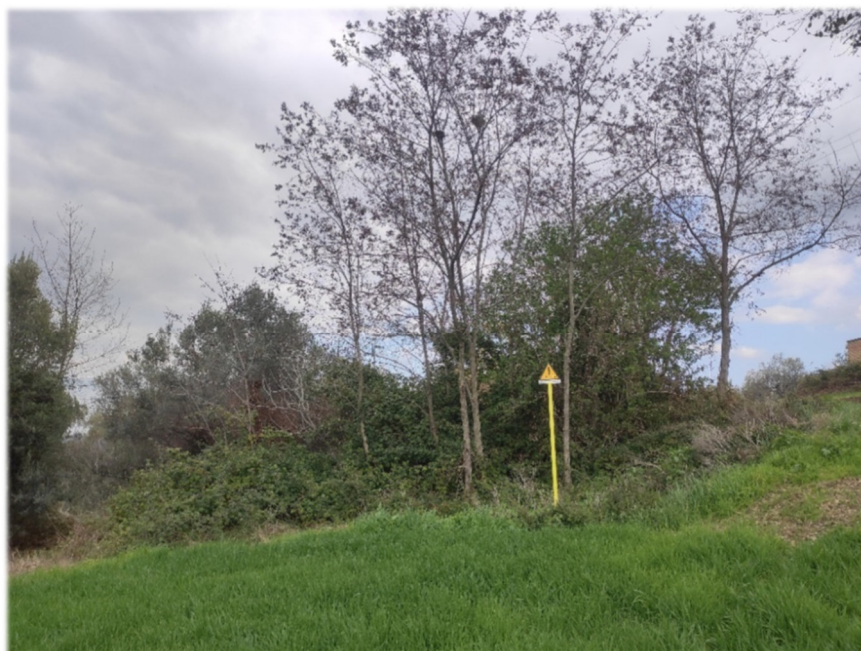
Figura 3-3 - Gruppo di vegetazione arborea invasiva, situato in comune di Paglieta, interessato dall'opera in dismissione