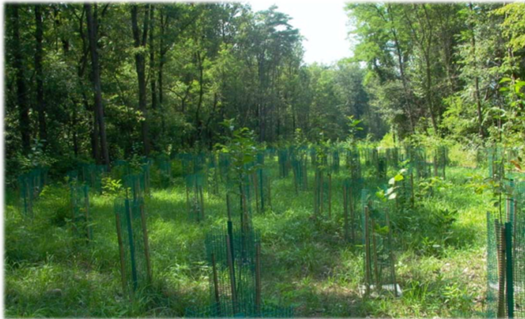
Figura 5-2 – Esempio di rimboschimento con uso di protezione individuale delle piante