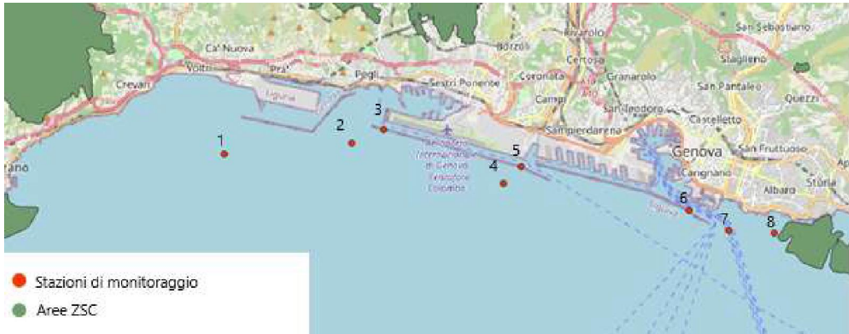
Figura 1 - Stazioni di monitoraggio Descrittore 8 per il campionamento degli inquinanti su colonna d'acqua e sedimento