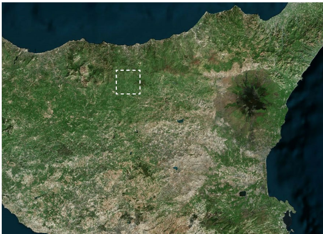
Figura 2-1: Inquadramento generale dell'area di progetto

Di seguito è riportato l'inquadramento territoriale dell'area di progetto e la configurazione proposta su ortofoto.