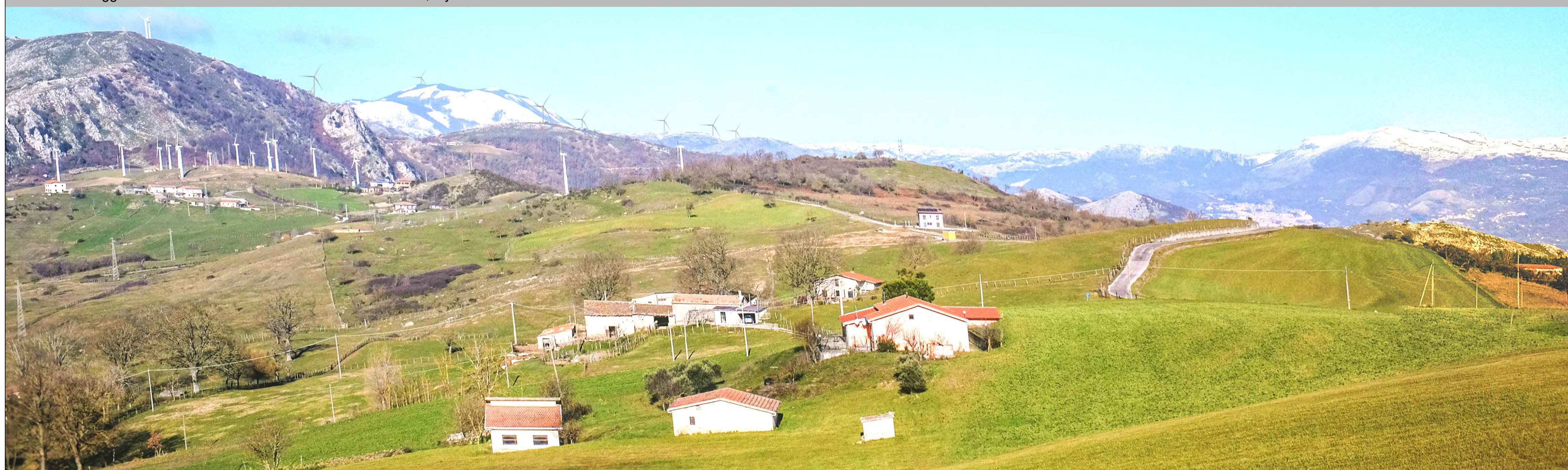
Vista del sito oggetto dell'intervento dall'area industriale di Balvano, layout di adeguamento tecnico