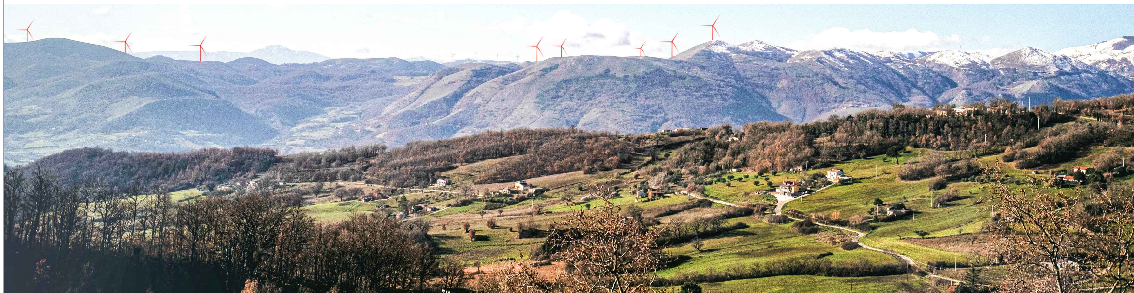
Vista del sito oggetto dell'intervento dal Comune di Bella - centro abitato, layout di adeguamento tecnico