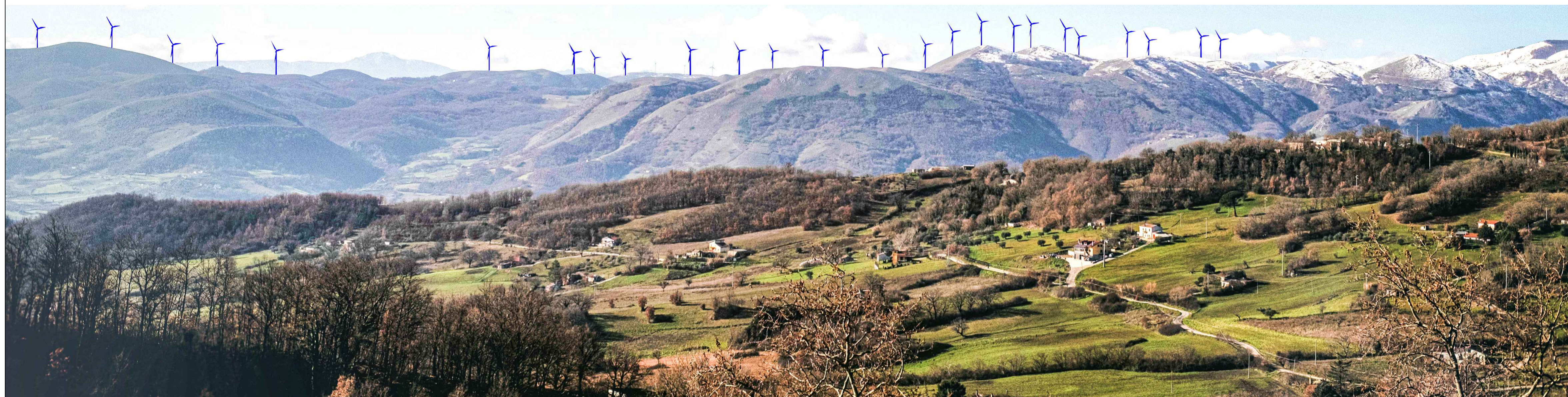
Vista del sito oggetto dell'intervento dal Comune di Bella - centro abitato, layout autorizzato