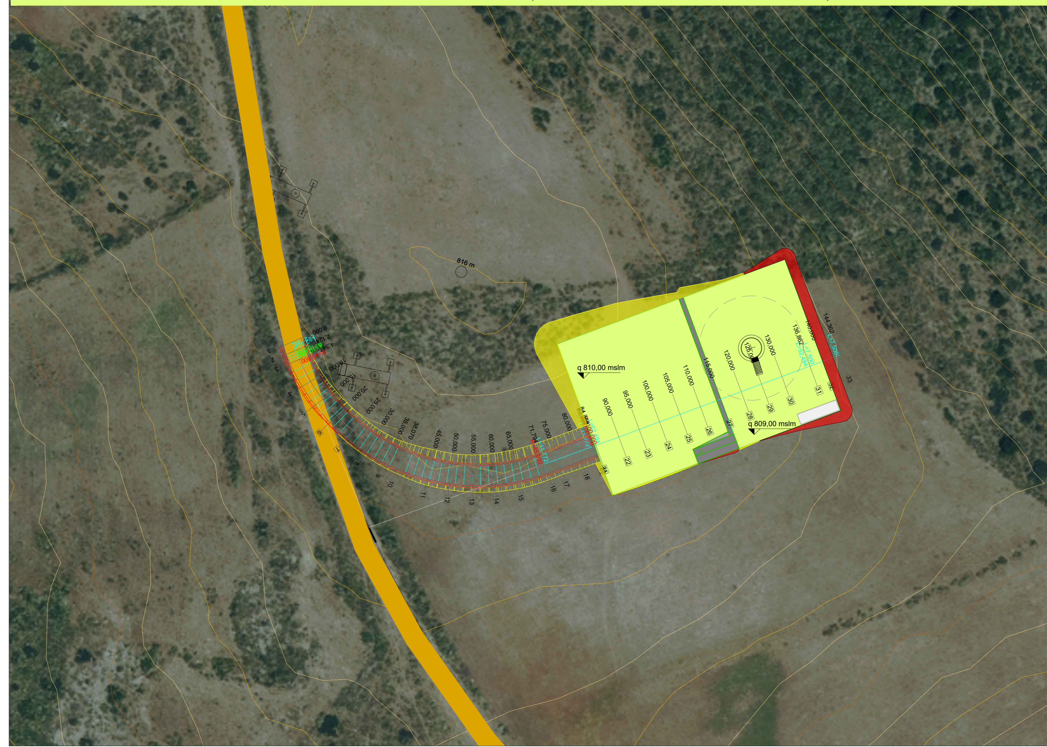
SE-06: VIABILITA' E PIAZZOLA IN FASE DI ESERCIZIO - PLANIMETRIA E SEZIONI SIGNIFICATIVE (tutte le sezioni sono raccolte nell'elaborato ELB.31-WTG06)