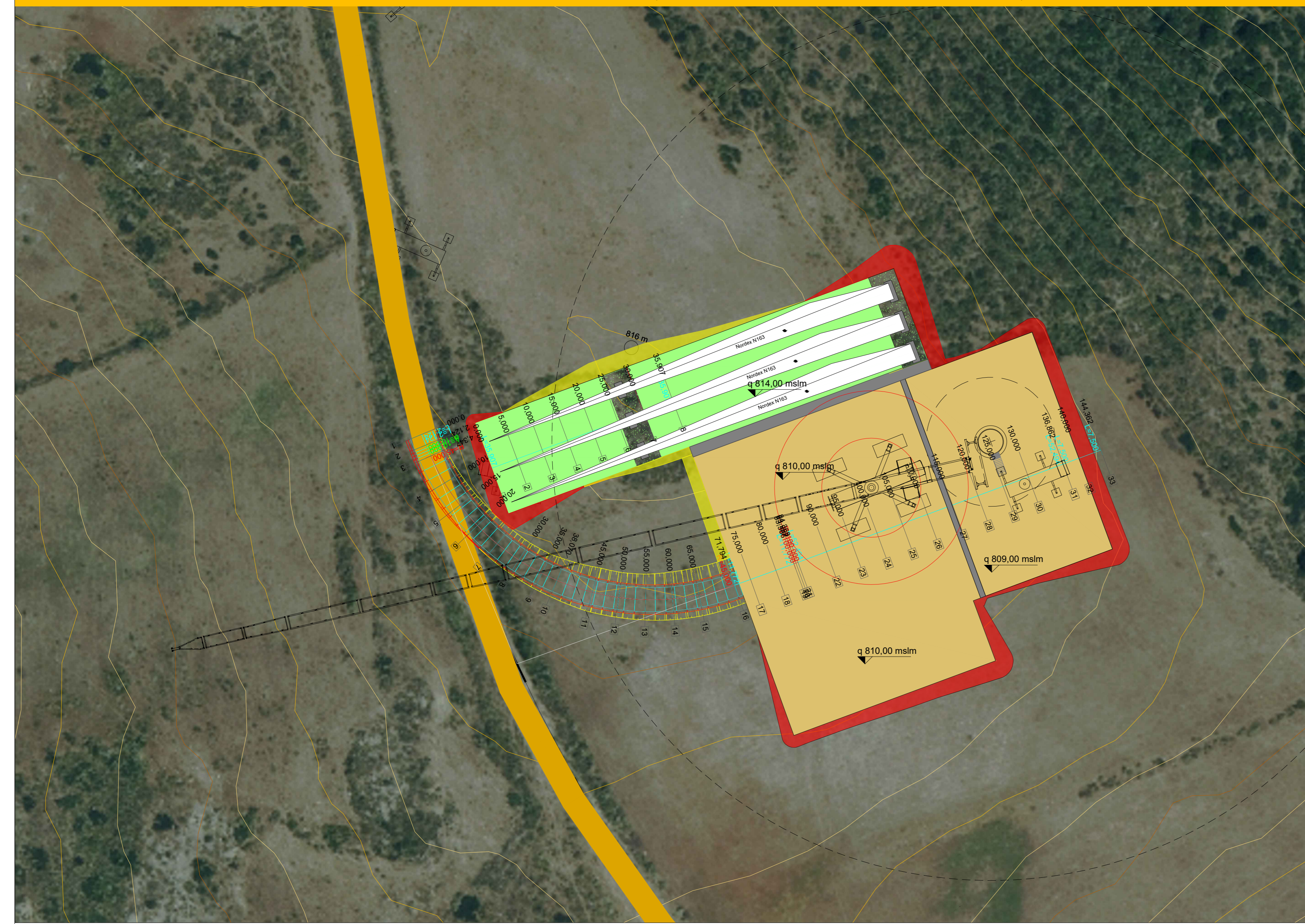
SE-06: VIABILITA' E PIAZZOLA IN FASE DI CANTIERE - PLANIMETRIA E SEZIONI SIGNIFICATIVE (tutte le sezioni sono raccolte nell'elaborato ELB.31-WTG06)