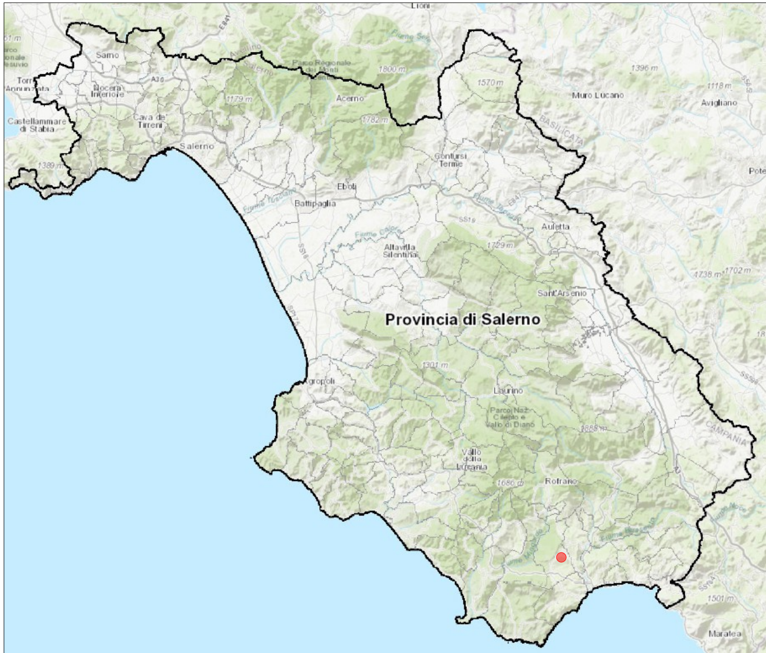
Cartografia di inquadramento provinciale – scala 1:500.000