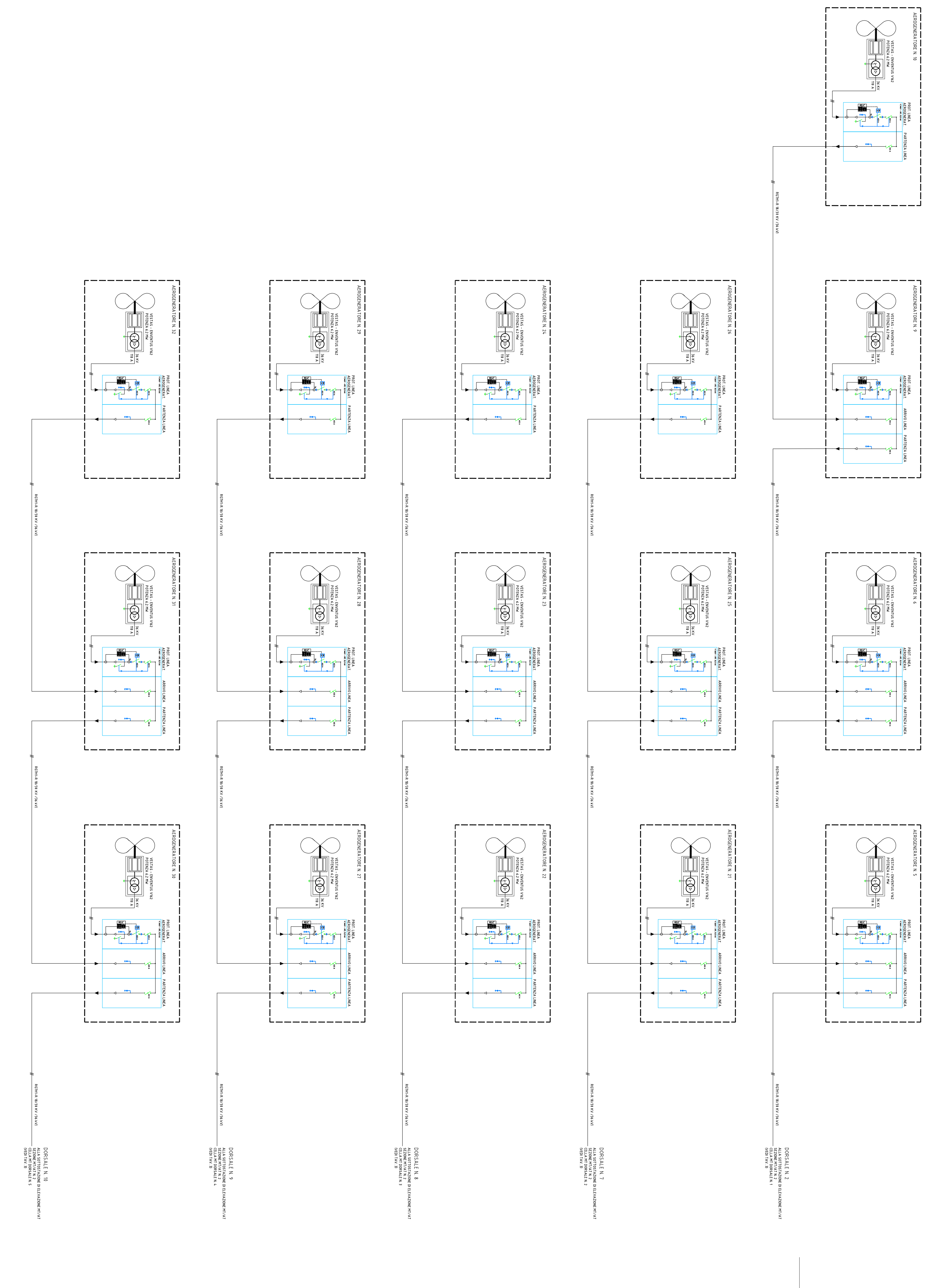
ALLA SOTTOSTAZIONE UTENTE DI ELEVAZIONE MT/AT (TAVOLA 3)