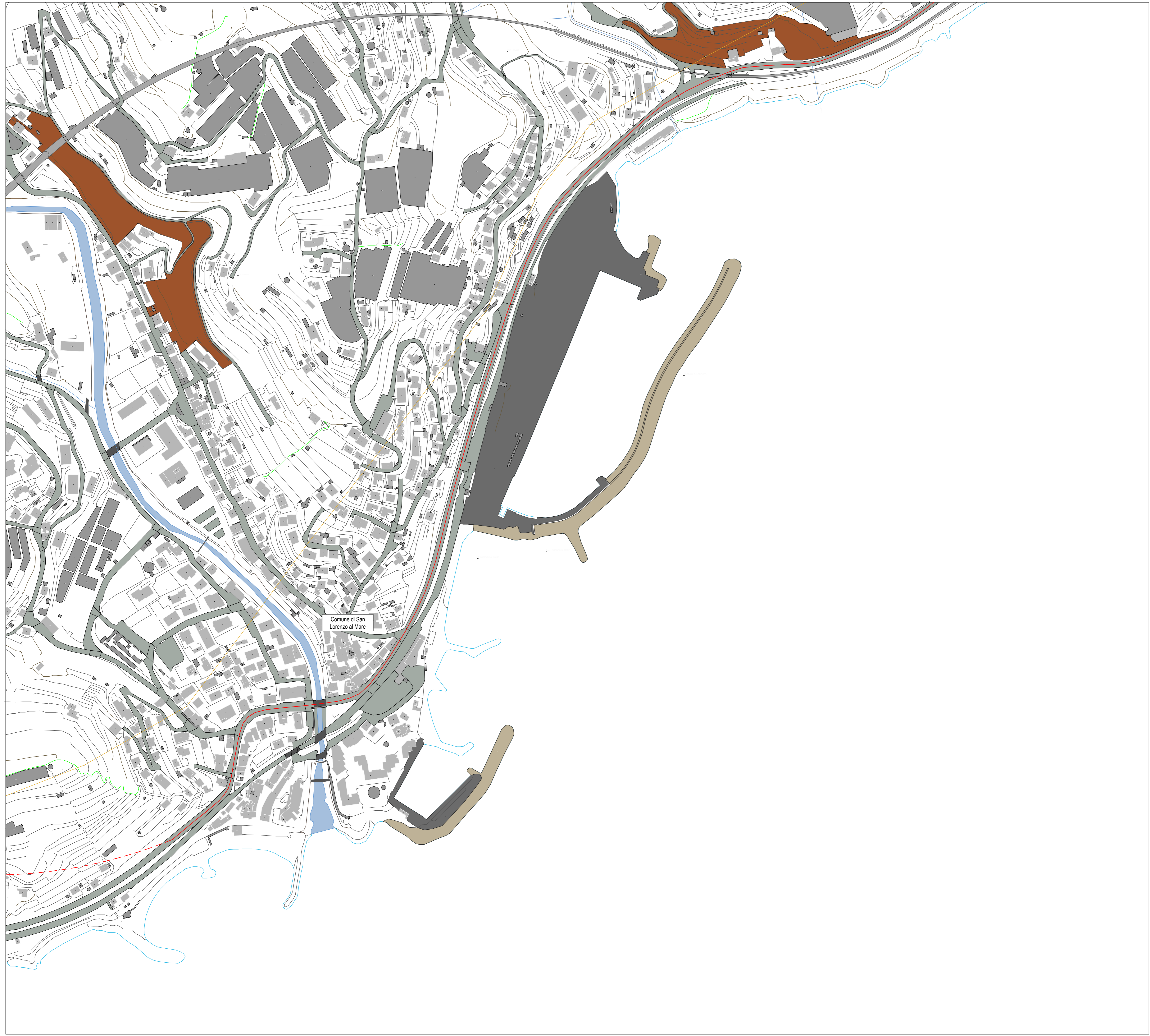
INQUADRAMENTO AREA SU ORTOFTO

PLANIMETRIA DI RIFERIMENTO SCALA 1:2.000