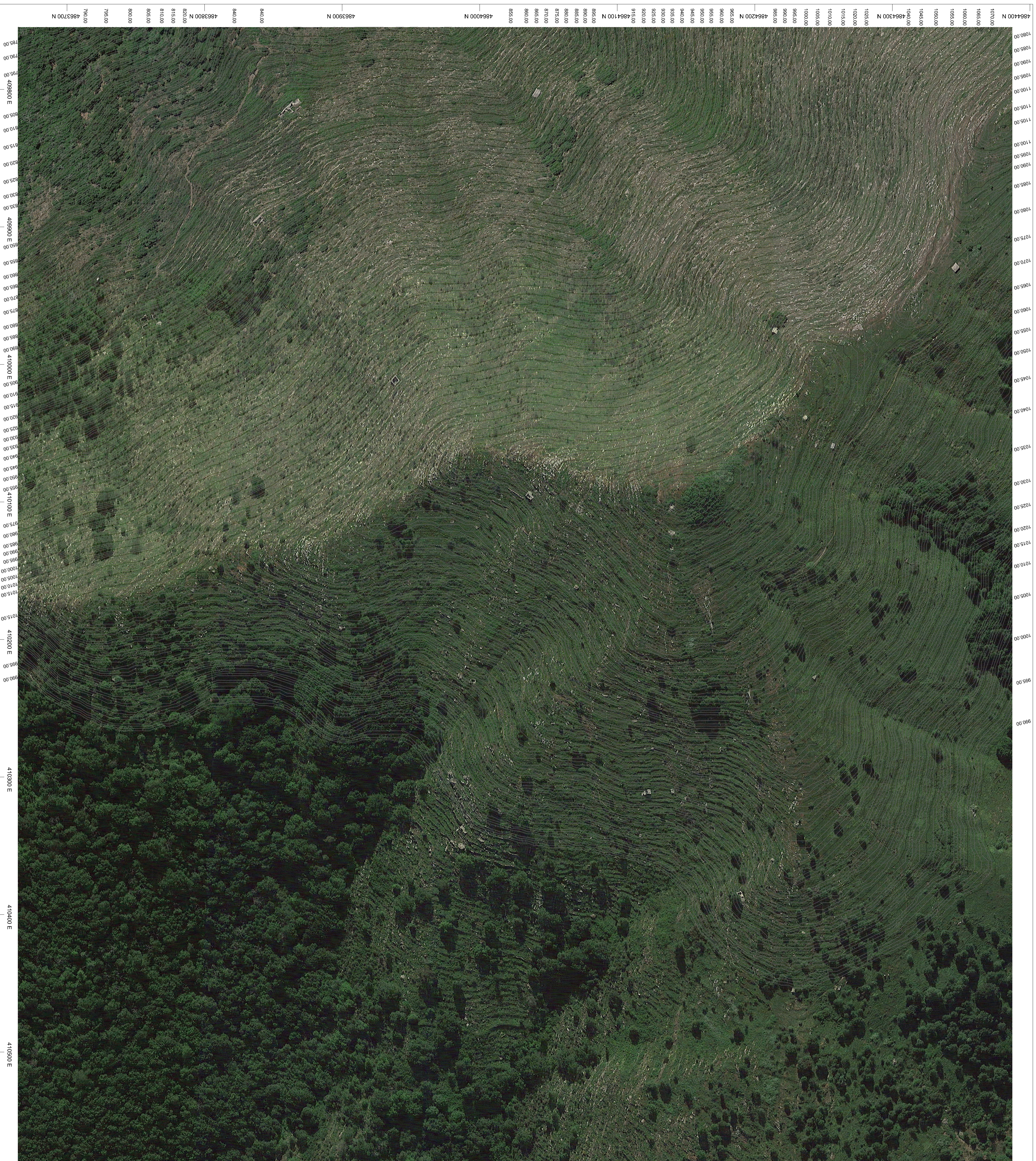
PLANIMETRIA ORTOFOTO-CURVE DI LIVELLO scala 1:1.000