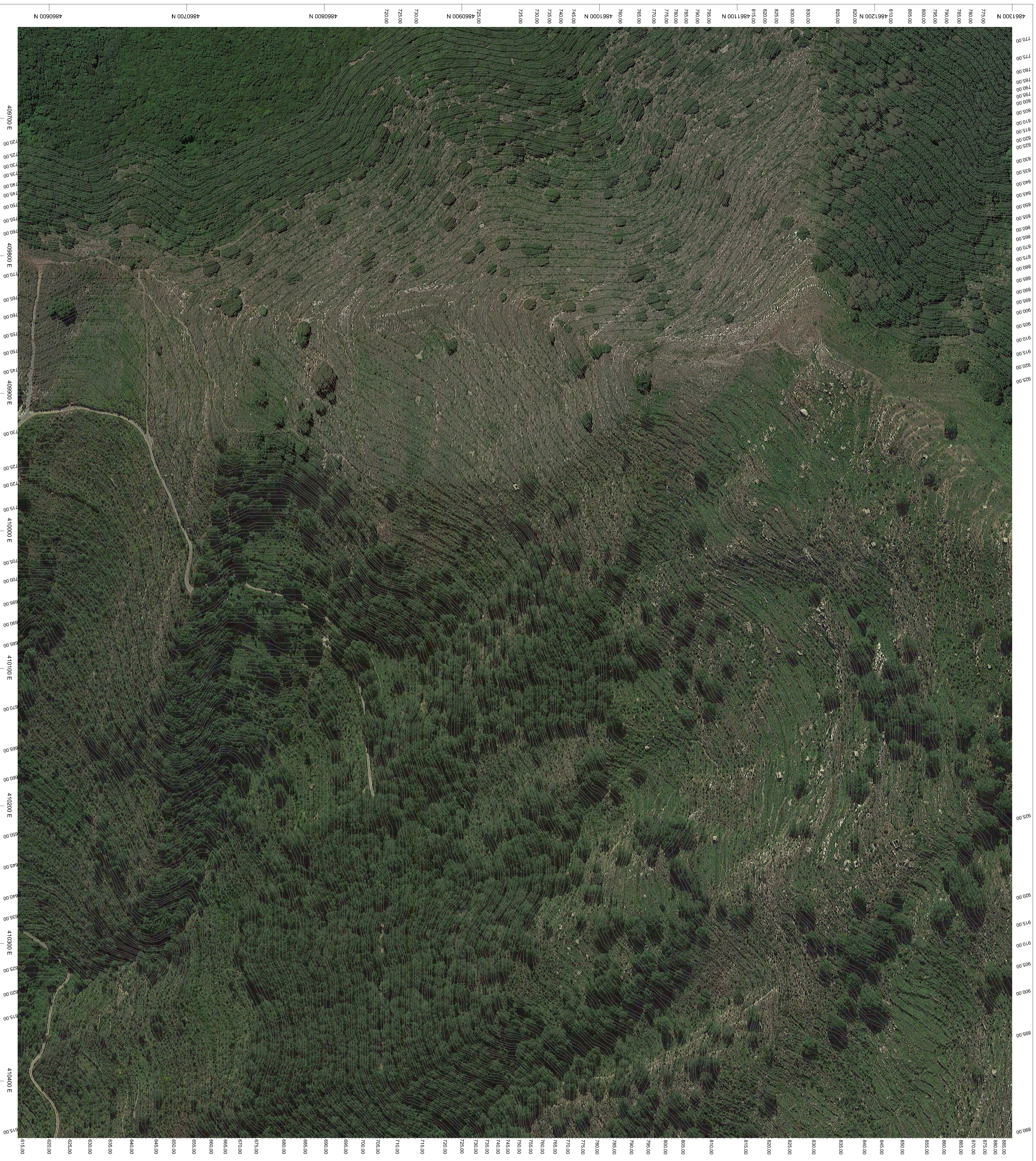
PLANIMETRIA ORTOFOTO-CURVE DI LIVELLO Scala 1:1.000