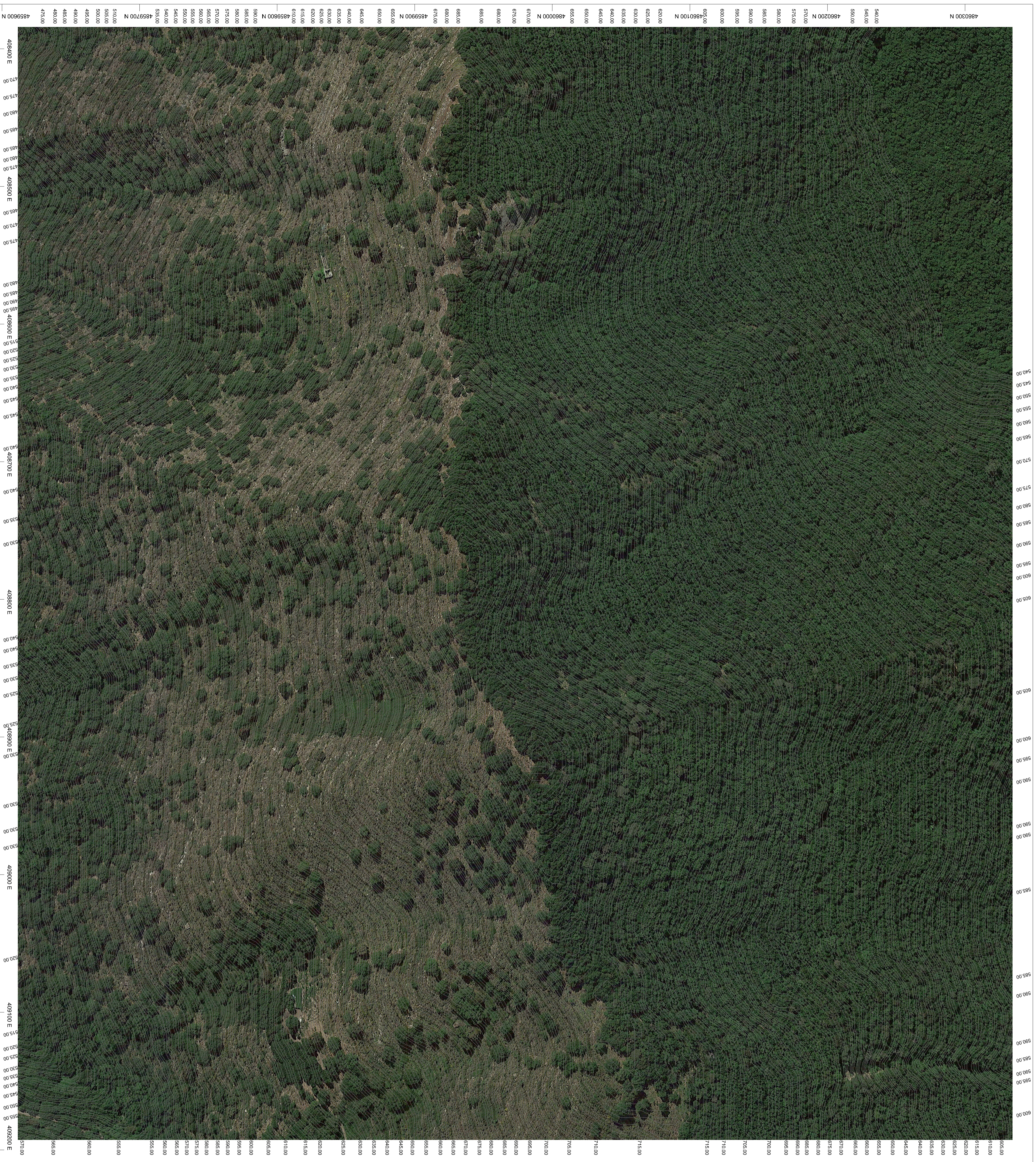
PLANIMETRIA ORTOFOTO-CURVE DI LIVELLO Scala 1:1.000