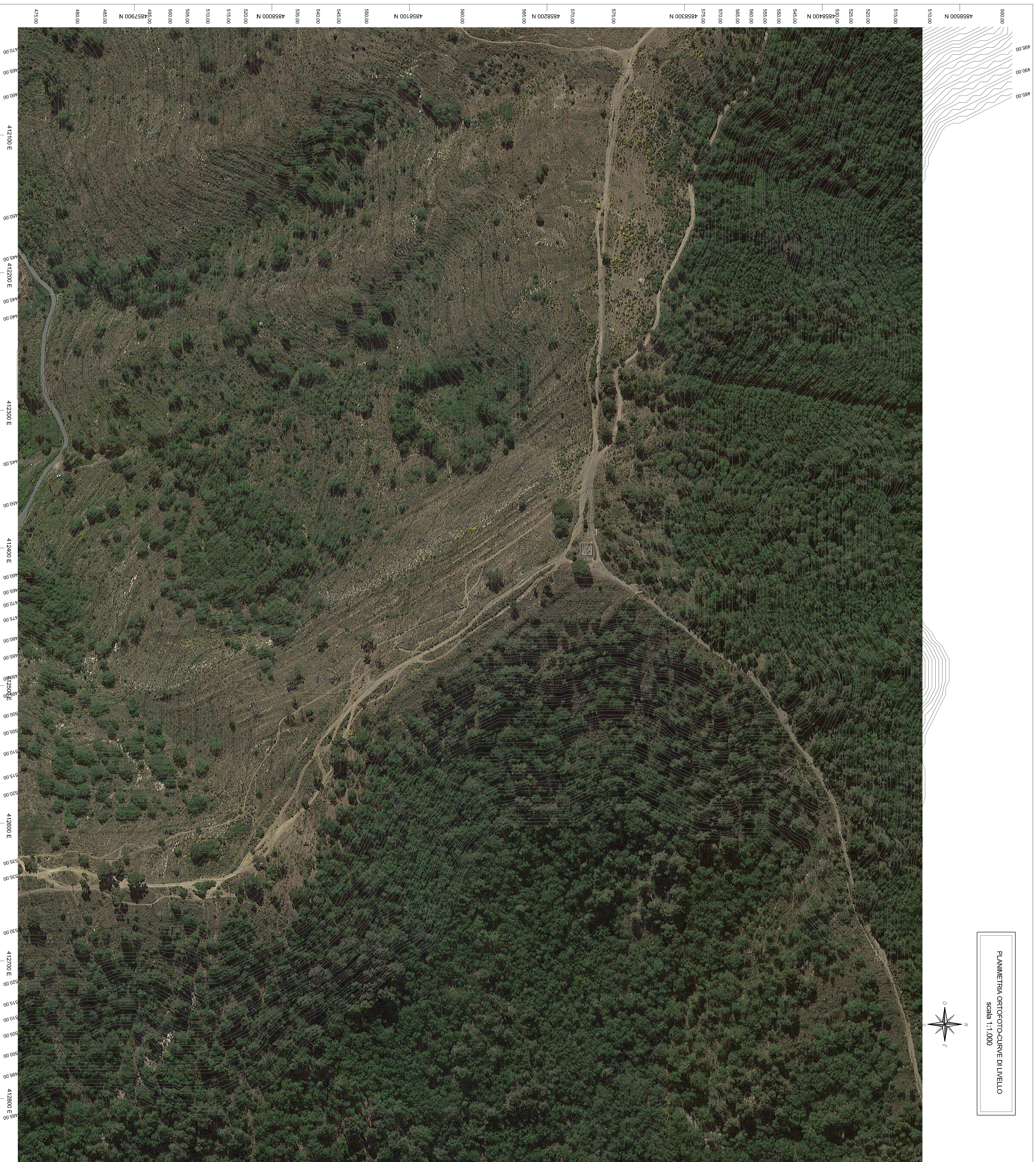
PLANIMETRIA ORTOFOTO-CURVE DI LIVELLO scala 1:1.000