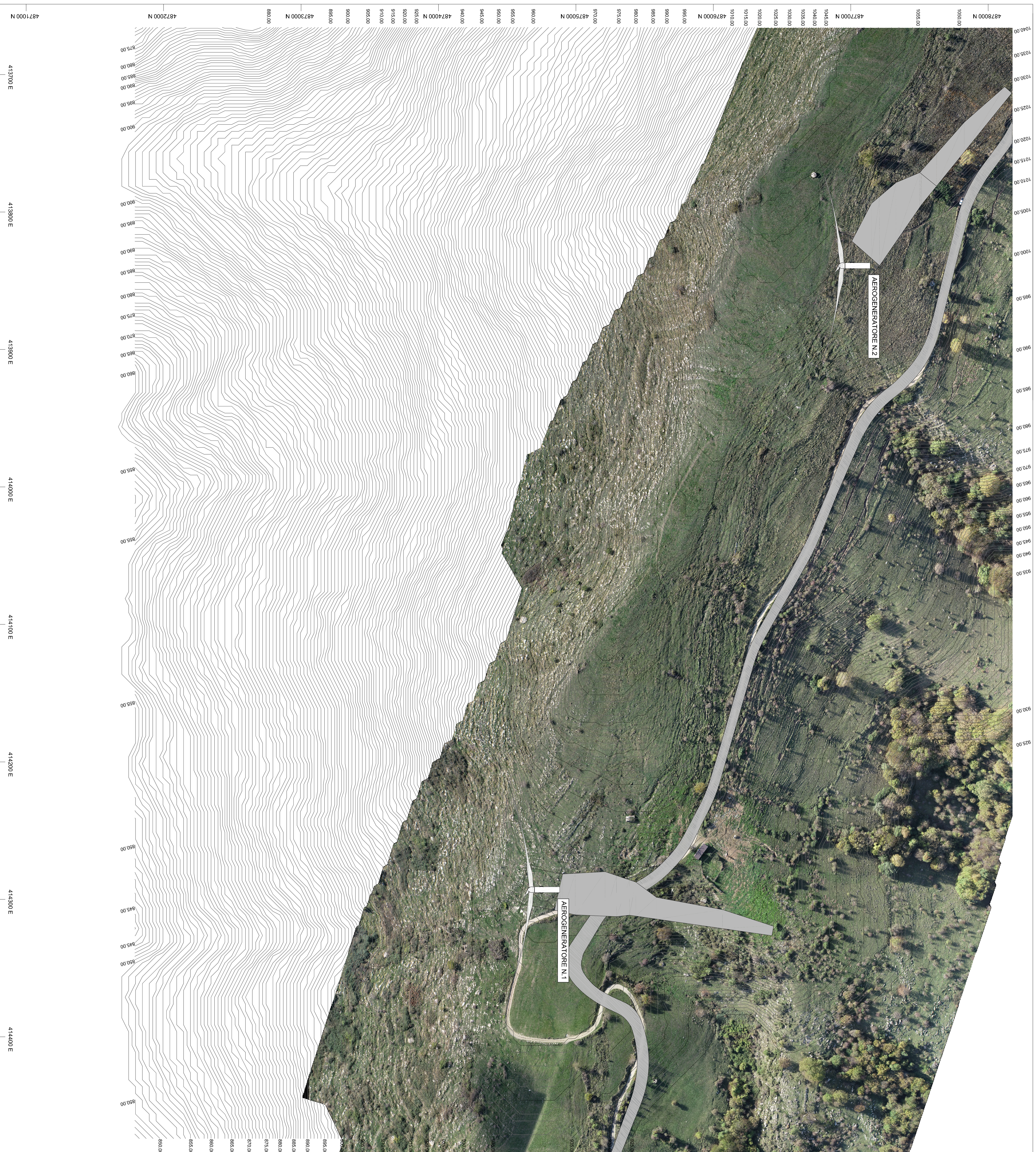
PLANIMETRIA ORTOFOTO-CURVE DI LIVELLO Scala 1:1.000