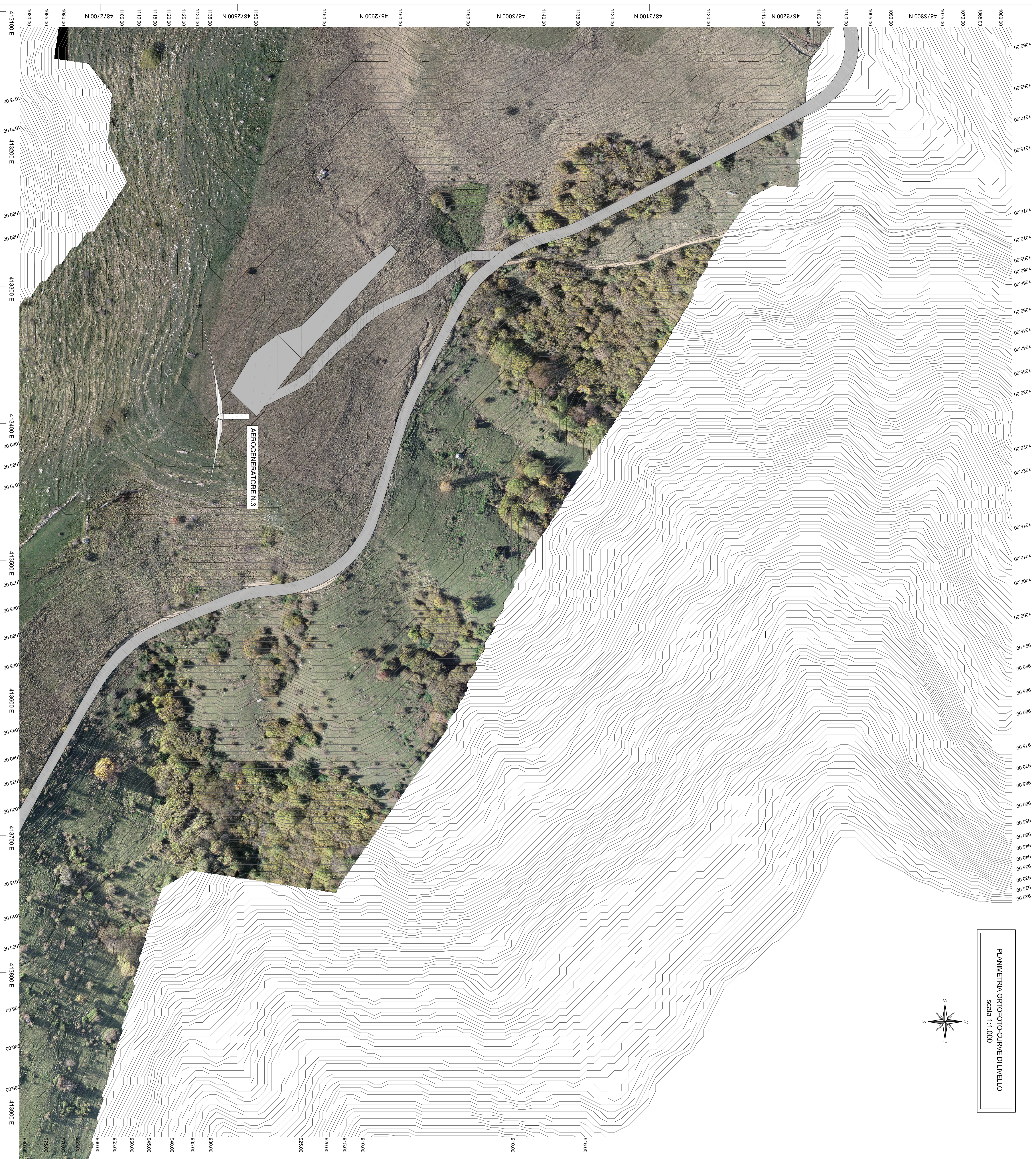
PLANIMETRIA ORTOGOTO-CURVE DI LIVELLO scala 1:1.000