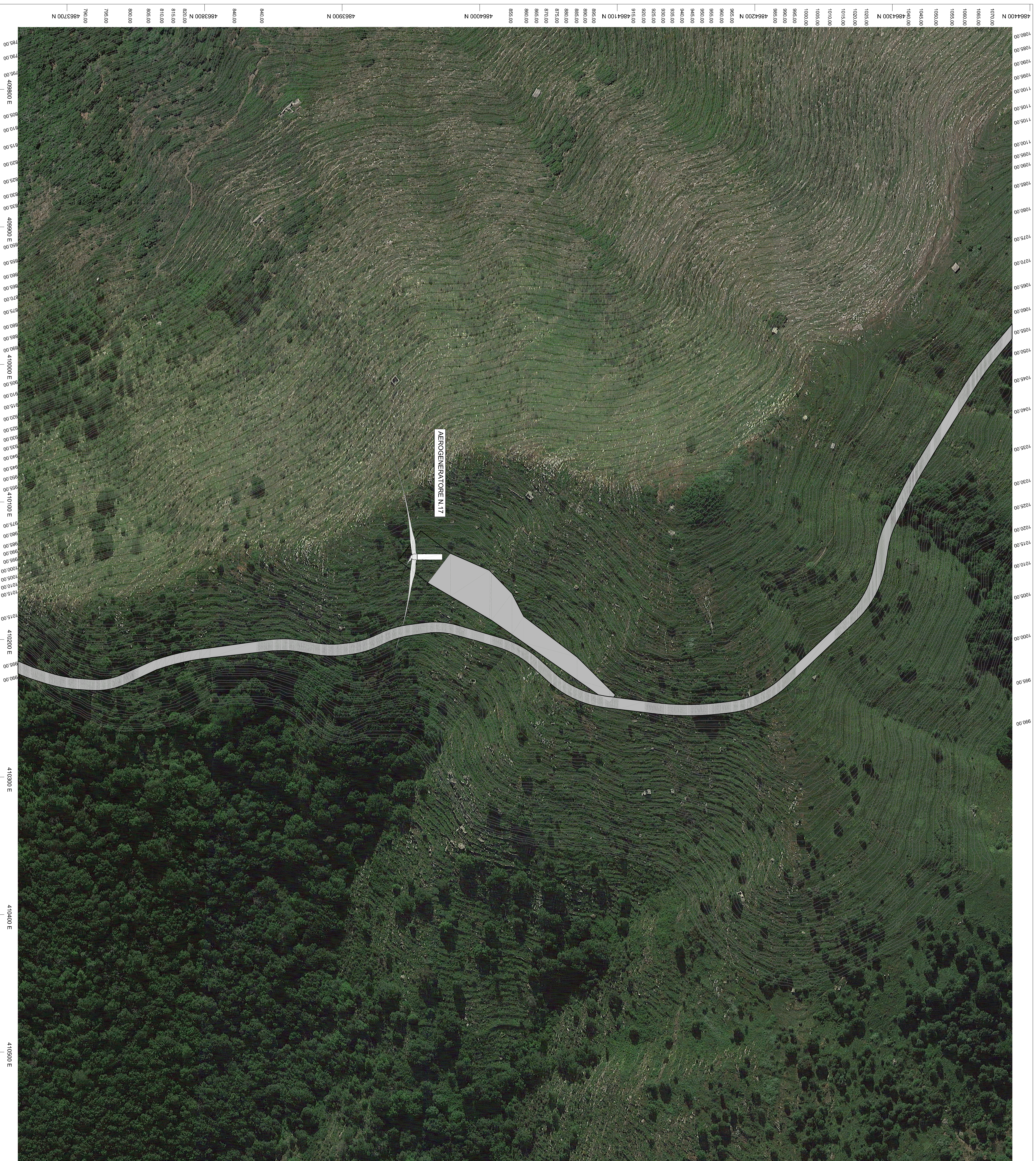
PLANIMETRIA ORTOFOTO-CURVE DI LIVELLO scala 1:1.000